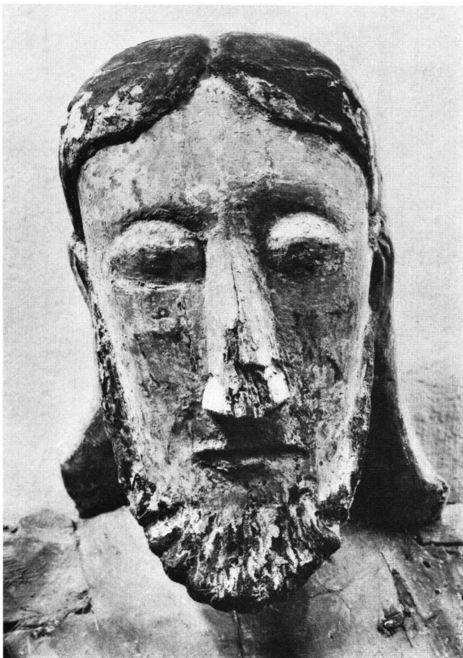
Abb. 13 Holzkruzifixus in der Abtei Liesborn. Kopf

Wenn es uns auch nicht gelungen ist, das Objekt richtig ins «Kreuz» der suchenden Scheinwerfer zu fassen, so hoffen wir, in diesem Beitrag doch wenigstens die «cruX» der Probleme aufgezeigt und das Kruzifix zur wissenschaftlichen Diskussion gestellt zu haben.