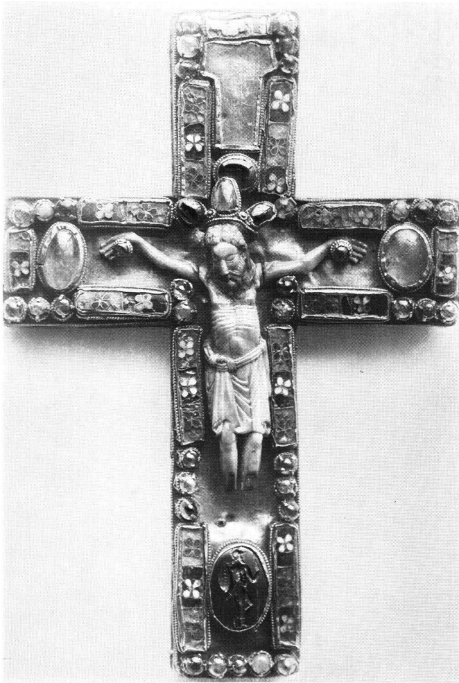
Abb. 8 Sogenanntes Egbert-Kruzifix. St. Servatius, Maastricht

dem schwäbischen Raum gemeinsam, die Georg Himmelheber dem Hirsauer Kreis zuordnet 4 . Einzig der hölzerne Reichenauer Kruzifixus in Oberzell 5 , den Himmelheber an den Anfang der Reihe stellt, zeigt eine etwa vergleichbare Biegung des Rumpfes bei parallelgestellten Beinen. Die Kruzifixe im Umkreis des Reiner von Huy 6 scheiden als engere Parallelen schon deswegen aus, weil ihr unsymmetrischer Überhang vor dem linken Knie bald zu einem eigentlichen Diagonaltypus mit runden Schüsselfalten wird, was auf die Illusion des plastisch gerundeten Körpers abzielt, während das Lententuch des Münstiger Kruzifixus seine Faltenmotive kontrastreich in der «Bildebene» ausbreitet. Immerhin sind die Tütenfalte vor dem rechten Oberschenkel und das gürtelartige Zingulum mit Knoten an der rechten Hüfte sowie das Motiv der frontalen Winkelfalten bei den frühen Vertretern der Gruppe als leise Anklänge zu werten.