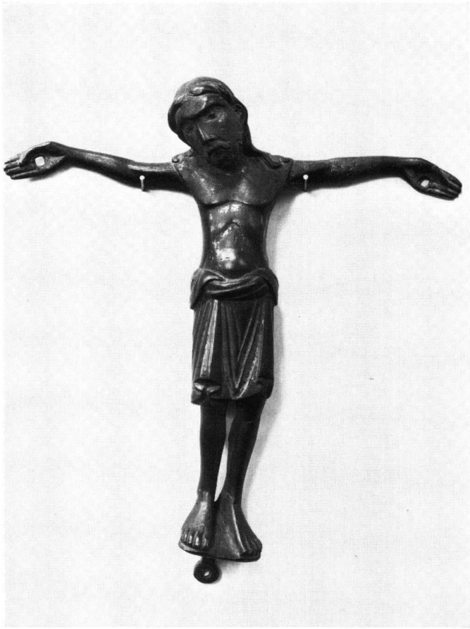
Abb. 10 Bronzekruzifixus. Schnütgen-Museum, Köln

linken Körperseite, in der Frontalansicht des Münstiger Kruzifixes vielleicht noch als verkümmerte Illusion erkennbar.