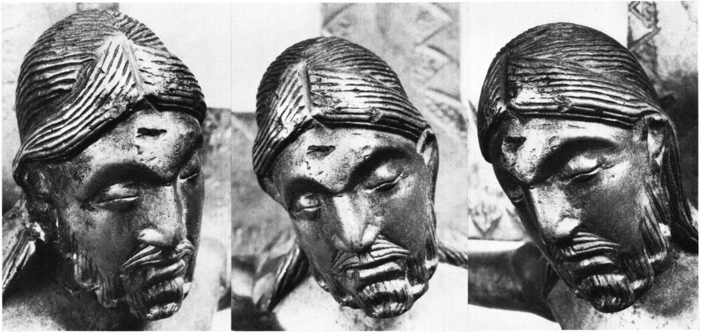
Abb. 4–6 Messingkruzifix von Münster. Kopf in halbem Rechtsprofil; Kopf in Frontalansicht; Kopf in halbem Linksprofil

gewinkelten Händen lassen den Eindruck des Hängens nicht aufkommen; sie wirken vielmehr tänzerisch zur Balance ausgebreitet, vor allem wenn das auf dem Messing spielende Licht sie geschmeidig rundet. Und der zurückhaltende «Kontrapost» schafft mit Hilfe der Tütenfalte bisweilen, ungeachtet der annähernd parallelen Stellung der Füße, sogar die Illusion des Schreitens.