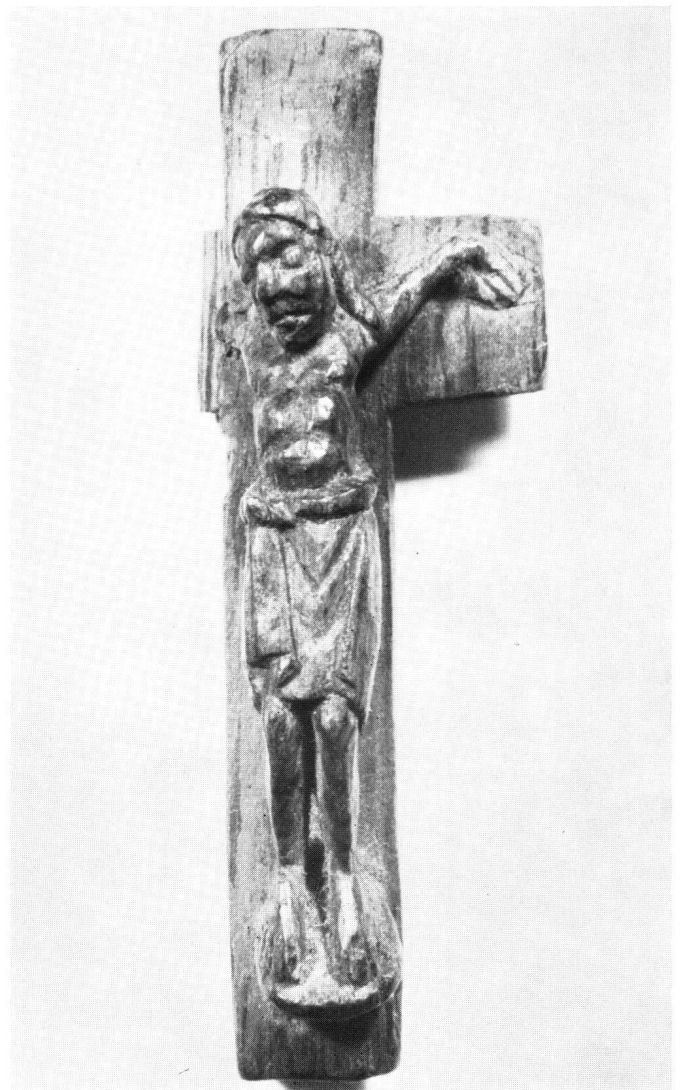
Abb. 9 Kreuzchen aus Zedernholz. Halberstädter Domschatz

Kruzifix in der St.-Servatius-Kirche in Maastricht (Abb. 8). Die Perizonien beider Kruzifixe gleichen sich in der hochgezogenen Tütenfalte mit rhomboider Öffnung vor dem rechten Oberschenkel, in den auf den linken Oberschenkel übergreifenden (!) Winkelfalten – häufiger sind schmalere Winkelfalten zwischen den Oberschenkeln – und sogar in den Winkelfalten an der rechten Körperseite (Profil). So sehr diese Entsprechungen bei der Seltenheit vergleichbarer Perizonien ins Gewicht fallen, seien andererseits auch die Unterschiede nicht verschwiegen: beim Egbert-Kruzifix der illusionistisch schlaff herabhängende Gürtel, eine ganz andere Knüpfung über der Tütenfalte, wohl zu deuten als hochgeraffte und dann angepreßte Tuchpartie, beim Münstiger Kruzifix, nach der Form des Knopfs zu schließen, dagegen eher als Teil eines verschlauten hängenden Zipfels; beim Egbert-Kruzifix ferner die gedrückte Tütenfalte mit Überhang an der