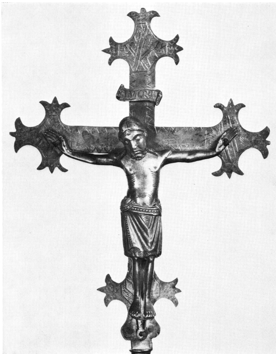
Abb. 1 Messingkruzifix von Münster. Frontalansicht

Kopf und Gliedmaßen sind kompakt gegossen; der Rumpf ist hohl. Die nur sehr wenig geneigte Suppedaneumplatte ist samt Hals und Öse mitgegossen. Christus steht mit fast parallel gestellten ungenagelten Füßen auf dem Suppedaneum (Abb. 1). Der Körper wirkt frontal symmetrisch, doch ist das Haupt sanft geneigt und die