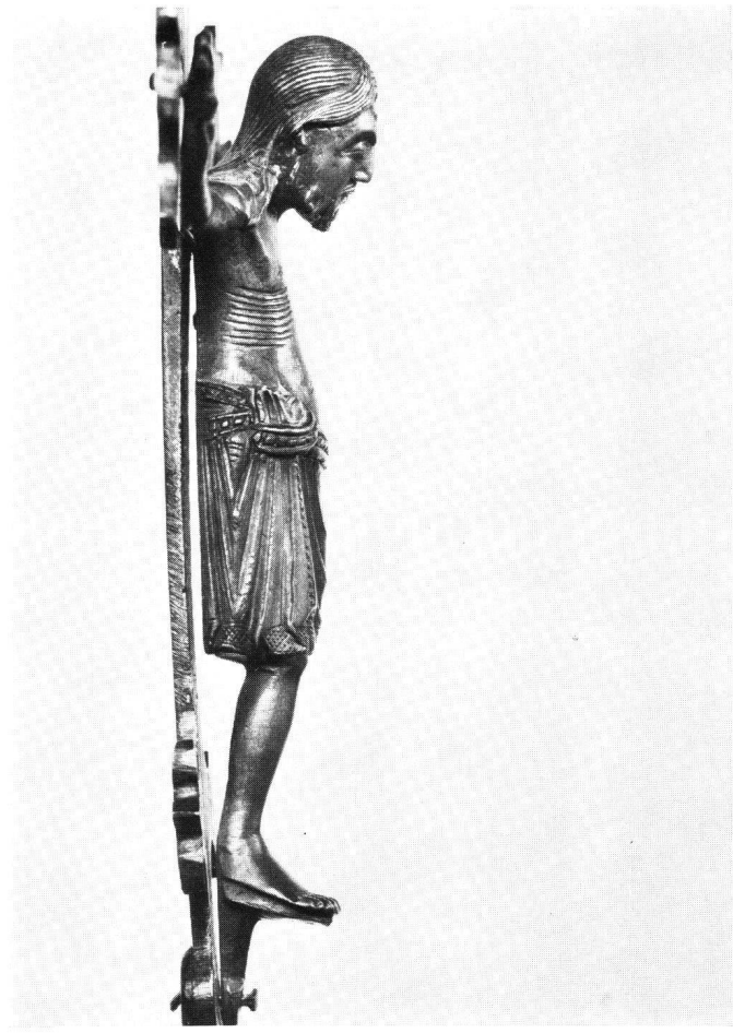
Abb. 3 Messingkruzifix von Münster. Rechtsprofil

wenig ausschwingende rechte Hüfte leicht angehoben. Während der linke Arm ganz waagrecht gehalten wird, knickt der rechte im Ellbogengelenk etwas ein. Die langen, genagelten Hände sind auffallend nach oben gewinkelt. Das breite Oval des Kopfes wird von stilisierten eingerollten Bartbüscheln in symmetrischer Anordnung gerahmt (Abb. 4–6). Das nur vorn gescheitelte Haupthaar fällt beidseits auf die Schultern herab. Die Brust mit den punzierten Warzen ist je als kleine halbrundliche Platte abgehoben, die sich über die Achselhöhle hin bis zum Oberarmrücken erstreckt. Die Rippen sind als gehäufte Kerben gegeben. Gebrochene Kerben über dem Nabel betonen die Rundung des vorstehenden Bauches. Das Perizonium wird von einem Zingulum (Abb. 7) gehalten, das an beiden Hüften geknüpft ist, an der rechten jedoch kräftiger, weshalb hier eine Tütenfalte hochgerafft wird; der kleinere Knoten an der linken Hüfte mutet bei Frontalansicht wie ein überlappendes Ende an. Die Knoten lassen sich logisch nur zu einem kleinen Teil entwirren. Die zwei Zingulumbahnen an der rechten Körperseite (Abb. 3) wird man als Hinweis auf eine kreuzweise Verschlaufung deuten müssen 1 . Über den linken Oberschen-