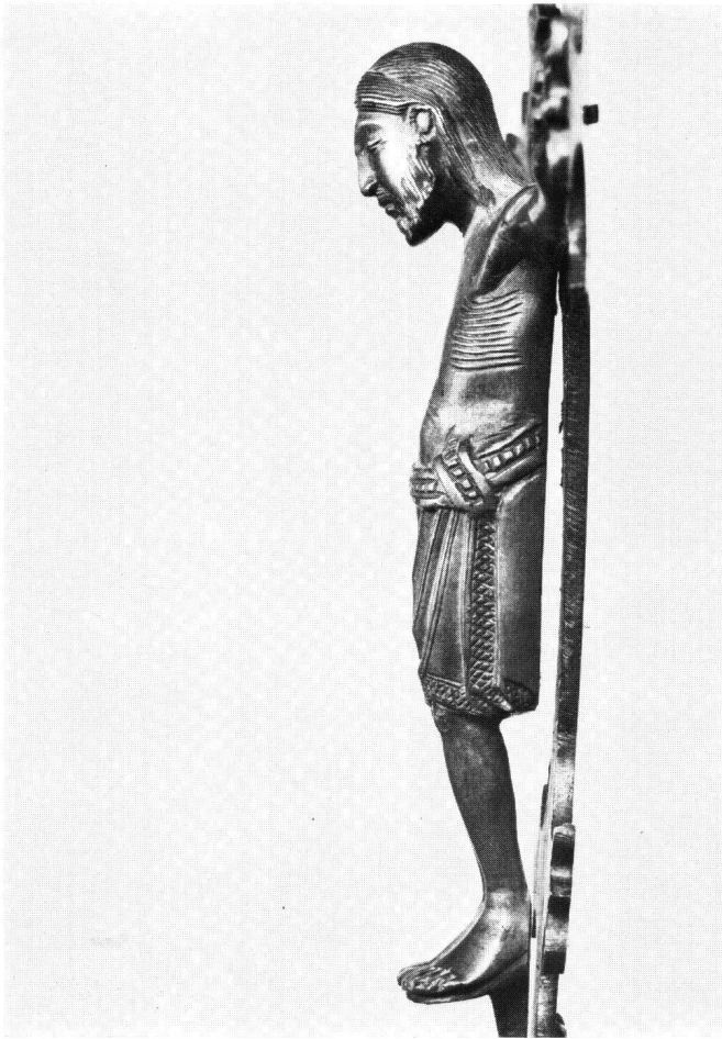
Abb. 2 Messingkruzifix von Münster. Linksprofil