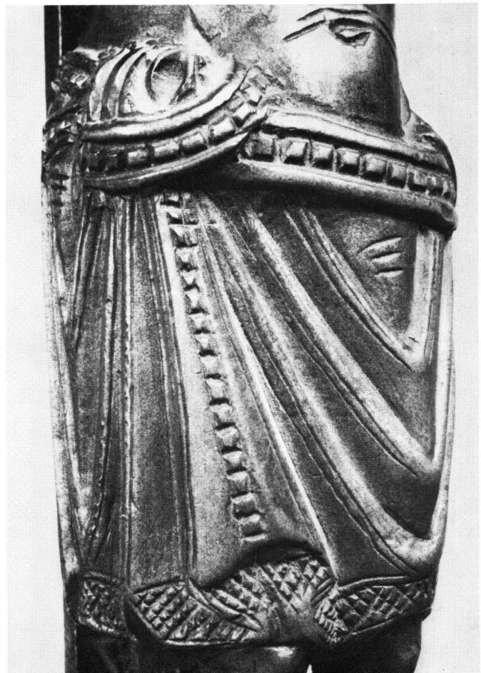
Abb. 7 Messingkruzifix von Münster. Lententuch in halbem Rechtsprofil

Unser Kruzifixus – es handelt sich mit größter Wahrscheinlichkeit um einen künstlerischen Importgegenstand – steht inmitten der romanischen Kruzifixe der Schweiz beinahe isoliert da 3 . Bei den byzantinischen Elfenbeinreliefs finden sich keinerlei Entsprechungen, weder im Körperbau noch in der Anlage des Lententuchs. Kaum mehr hat der Münstiger Korpus mit den Bronzekruzifixen aus