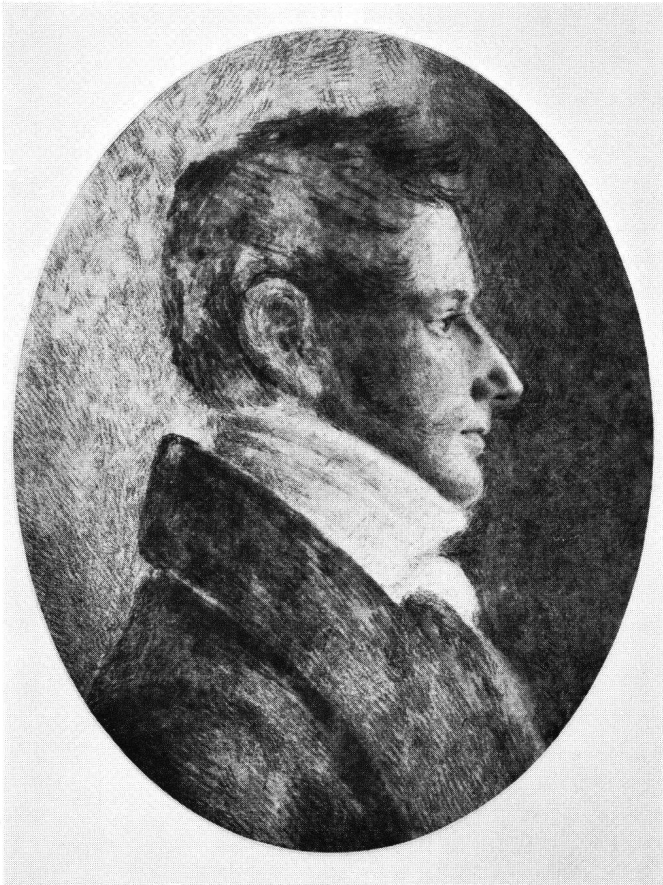
Abb. 1 Diethelm Heinrich Lavater: Selbstporträt. Schwarze und weiße Kreide, Bildoval 347:270 mm. Um 1810. Auf der Rückseite von späterer Hand bezeichnet: Stiftsarchivar

Seit 1973 besitzt die Zentralbibliothek Zürich (fortan zitiert als ZBZ) in ihrer Graphischen Sammlung den weitestgehendsten Teil der Porträtzeichnungen eines Zürcher Künstlers, der trotz seines bekannten Namens praktisch unbekannt geblieben ist, obwohl er zu den bedeutendsten Schweizer Porträtisten des frühen 19. Jahrhunderts gehört. Ausgelöst durch die Publikation des Fundes von in Zürich zurückgebliebenen umfangreichen Resten des «Physiognomischen Kabinetts», der 1804 nach Wien verkauften großangelegten Kunst- und Porträtsammlung Johann Caspar Lavaters 1 , vermehrte eine spontane Schenkung von privater Seite die bis dahin bescheidenen Bestände der ZBZ von 3 kleineren Arbeiten Diethelm Heinrich Lavaters (1780–1827) um 33 in schwarzer Kreide und öfter