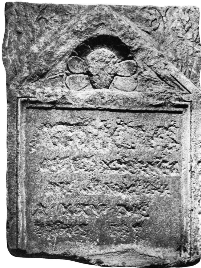
Fig. 1 Stèle funéraire d'Atticus Senator (Musée archéologique, Sion)

Grâce à un moulage, il nous a été possible de transcrire d'une manière satisfaisante l'inscription de 5 lignes: