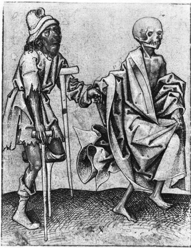
Abb. 3 Schwäbischer Meister, Ende 15. Jahrhundert. Der Tod und der Bettler . Gehöhte Zeichnung auf blaugrün grundiertem Papier. 132 × 103 mm. Oxford, Ashmolean Museum

don, 22. November 1974, Nr. 14, mit Abb. – Feder in Schwarz; weiß, gelb und rosa gehöht auf blaugrün (?) grundiertem Papier. – Merkwürdige, stilistisch uneinheitliche Zeichnung, die vielleicht im 19. Jahrhundert stellenweise übergangen wurde. – Eine qualitätvollere Zeichnung des heiligen Christophorus , fälschlich als Mair von Landshut auf der Auktion Sotheby's, London, 18. November 1959, Nr. 15, mit Abb., ist nach der Beschreibung offenbar nur weiß gehöht.