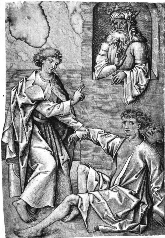
Abb. 4 Schwäbischer Meister, um 1500. Ein jugendlicher Heiliger heilt einen Besessenen . Gehöhte Zeichnung auf grün grundiertem Papier. 290 × 195 mm. Stuttgart, Württembergisches Hauptstaatsarchiv

tes Papier. Von etwa einem Dutzend unumstrittenen Zeichnungen weisen nicht weniger als sieben eine derartige Clair-obscur-Technik auf; genannt sei etwa das «Ungleiche Liebespaar mit Teufel» im Kupferstichkabinett Berlin 10 .