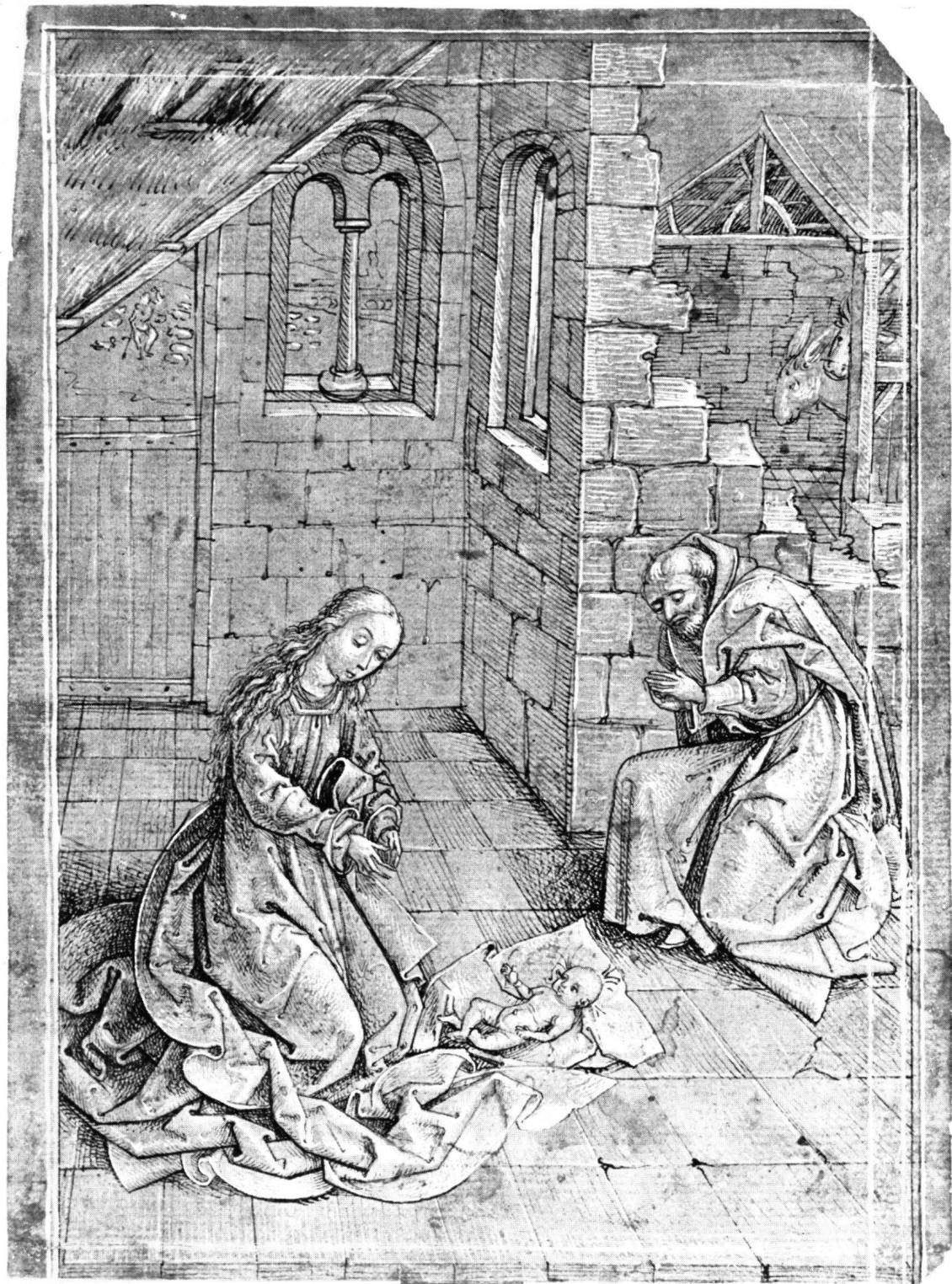
Abb. 2 Schwäbischer Meister, 1482. Die Geburt Christi . Gehöhte Zeichnung auf grün grundiertem Papier. 259 × 189 mm. Erlangen, Universitätsbibliothek