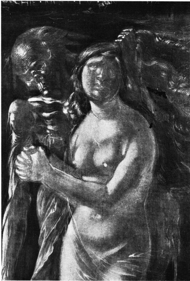
Abb. 11 Hans Baldung Grien: Der Tod und das Mädchen, 1517. Ausschnitt, Röntgenaufnahme von 1956. Kunstmuseum Basel