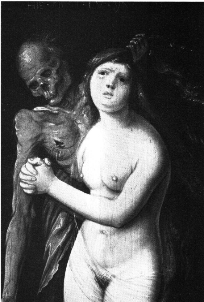
Abb. 9 Hans Baldung Grien: Der Tod und das Mädchen. 1517. Ausschnitt, Infrarotaufnahme von 1956. Kunstmuseum Basel