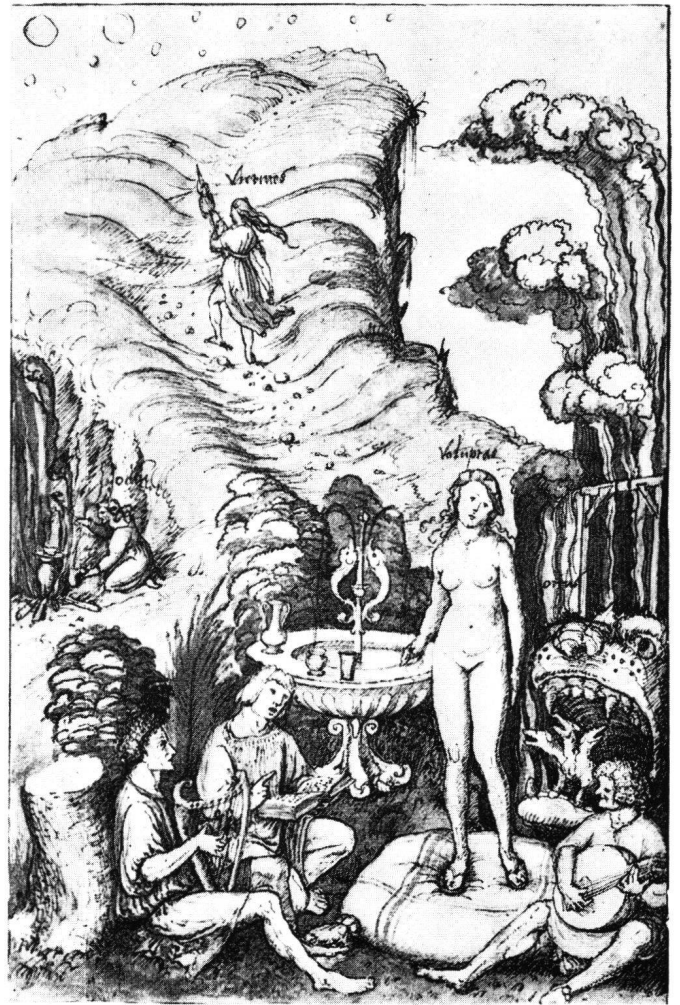
Fig. 4 P.Vischer le Jeune, Virtus et Voluptas , dessin, Berlin-Dahlem, Kupferstichkabinett

Or, il existe un thème iconographique montrant deux allégories chacune de part et d'autre d'une vallée, celui du