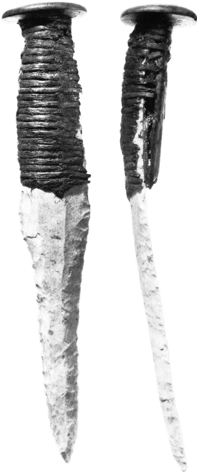
Abb. 34 Charavines (Département Isère, Frankreich), «Les Baigneurs». Grabung 1974. Saône-Rhône-Kultur. Dolch mit Rotbuchenknopf, Umwicklung aus Weißtannenästchen. Maßstab 1:1. Gefriertrocknung, 1974.