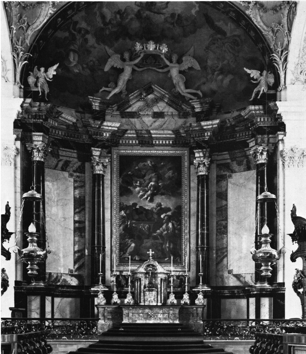
Abb. 3 Der heutige Hochaltar der St.-Galler Stiftskirche, 1808–1810 in klassizistischem Stil vom Stukkator Jos. Simon Mosbrugger aus Tschopperrau im Bregenzerwald errichtet. Das Gewölbe über dem Altar malte Jos. Keller von Pfronten im Allgäu aus, der auch Romanellis Altarblatt oben ergänzte.

nen aus der antiken Sagenwelt, während er bei seinem zweiten Frankreichaufenthalt 1655–1657 die Ausmalung der Sommerwohnung der Königinmutter Anna von Österreich im Louvre (Salles des Saisons, de la Paix, de Sévère, des Antonins) besorgte 29 . Der Zug zum Klassizismus eignet besonders seinen spätern Werken und ist auch beim St.-Galler Gemälde unverkennbar. Die zum Teil