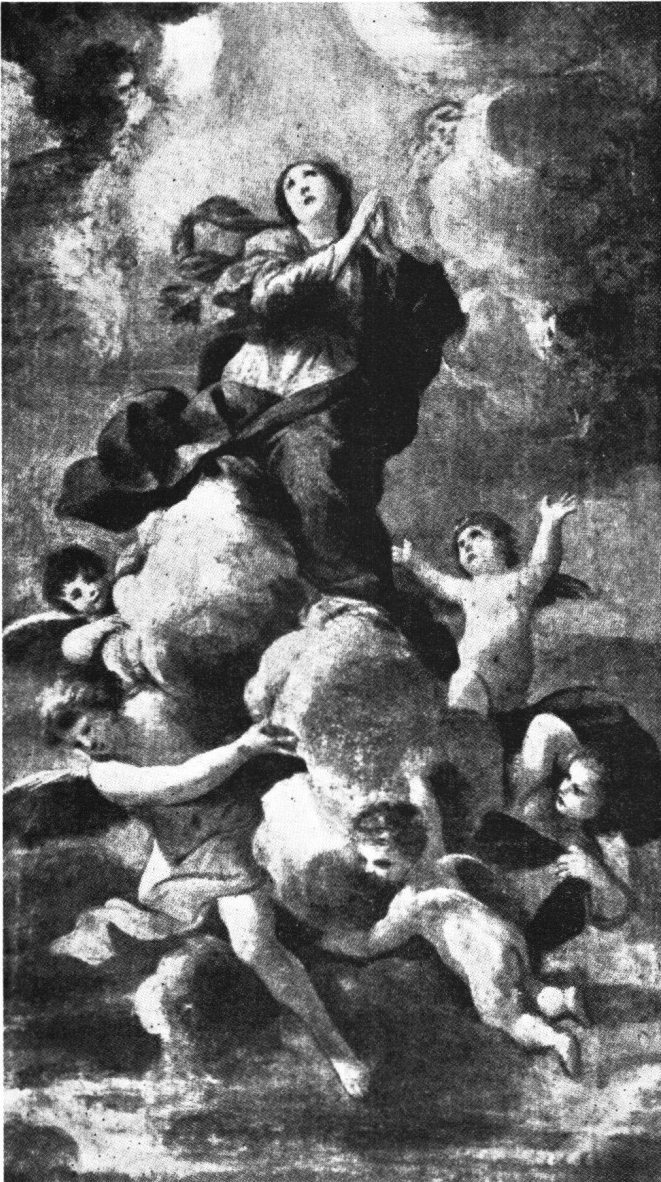
Abb. 4 Giovanni Francesco Romanelli, Assumpta. Bozzetto in der Collezione Marchesi Incisa della Rocchetta, Rom, zum 1638/39 entstandenen zentralen Deckenfresko in der Sakristei der Römer Kirche S. Maria dell'Anima.