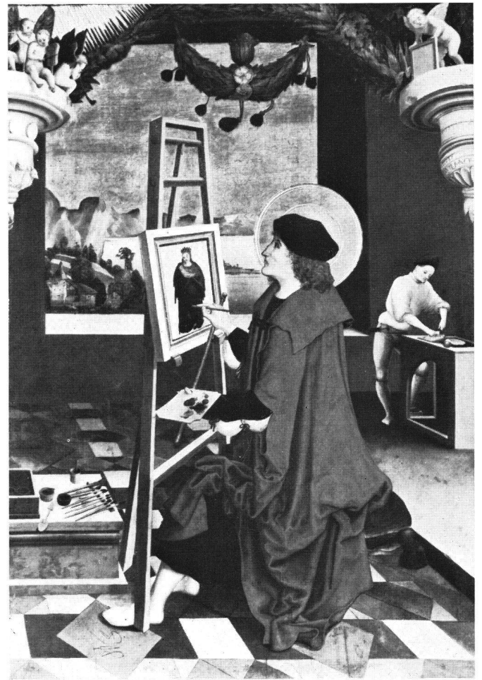
Abb. 2 Niklaus Manuel: Der heilige Lukas malt die Madonna. Kunstmuseum Bern.