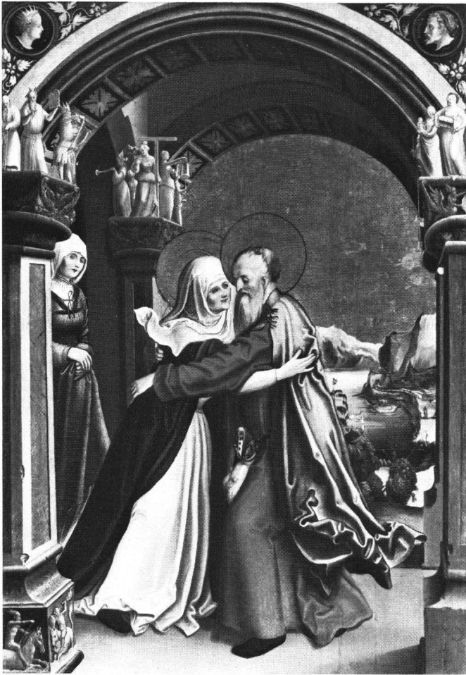
Abb. 3 Niklaus Manuel: Begegnung an der goldenen Pforte. Kunstmuseum Bern.