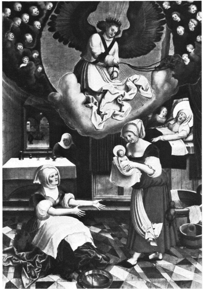
Abb. 4: Niklaus Manuel: Geburt der Maria (Wochenstube). Kunstmuseum Bern.

schnitt. Wie die Marienerscheinung beiden Heiligen gilt, sind diese in ihrer Arbeit einander zugewandt, doch ist die unterschiedliche Proportion der Figuren zu beachten: Lukas mag wohl um ein Viertel größer sein als Eligius. Die hauptsächlichlichen Orthogonalen treffen sich exzentrisch und extratabular außerhalb der Darstellung, vielleicht zwischen den beiden Rahmen, in der Höhe des unteren Kapitälringes, links etwas tiefer als rechts 2 . Die Durchblicköffnungen sind nicht gleich: rechts wird der obere Mauerschnitt sichtbar, der links sich hinter der Girlande verbirgt; die unteren Gesimse sind verschieden und liegen nicht in derselben Horizontale. Diese Wechsel oder Ungenauigkeiten widersprechen der angestrebten Einheit des Raumes, sie erklären sich aus dem Fortgang der Arbeit, in dem Erfahrung und Können sich mehrten. Der Fußboden im Lukas-Bild (Abb.2) zeigt ein Fliesenmuster – seit dem 14. Jahrhundert in Italien ein viel verwendetes Mittel, die Raumtiefe hervorzurufen. Der steinerne Belag gibt als auffallendes Bildmotiv ein Muster aus Quadraten und Rhomben. Zwischen den scharf ge-