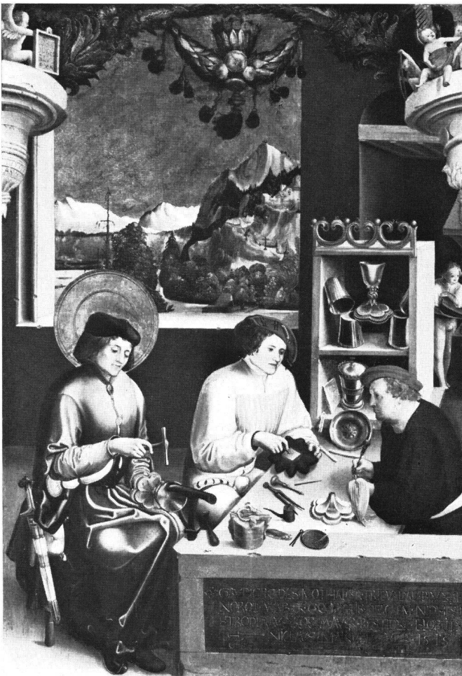
Abb. 1 Niklaus Manuel: Der heilige Eligius in seiner Werkstatt. Kunstmuseum Bern.

vische Konstruktion des Raumes. Diptychon und Triptychon verlangten eine gemeinsame Sicht und boten diesseits der Alpen den hauptsächlichsten Anlaß, daß die Maler die Wiedergabe eines Einheitsraumes erstrebten. Bei geschlossenen Flügeln zeigt die Außenseite eine Halle, der Seite eines Kreuzganges ähnlich, mit Säulen vorn und einer Rückwand, in der große Öffnungen Landschaftsausblicke freigeben. Die Mittelsäule, mit anderem Kapitäl als seitwärts, ergänzt sich aus den beiden Hälften, wie über ihr beidseitig die Strahlen der Marienerscheinung sich ausbreiten. Von dieser Mitte her gesehen, stehen links die Fensterwand mit einer Hohlkehle zwischen profilierten Stäben im Licht – Beginn oder Abschluß des Raumes – dagegen rechts ein breiter, im Schatten dunkler Wand-