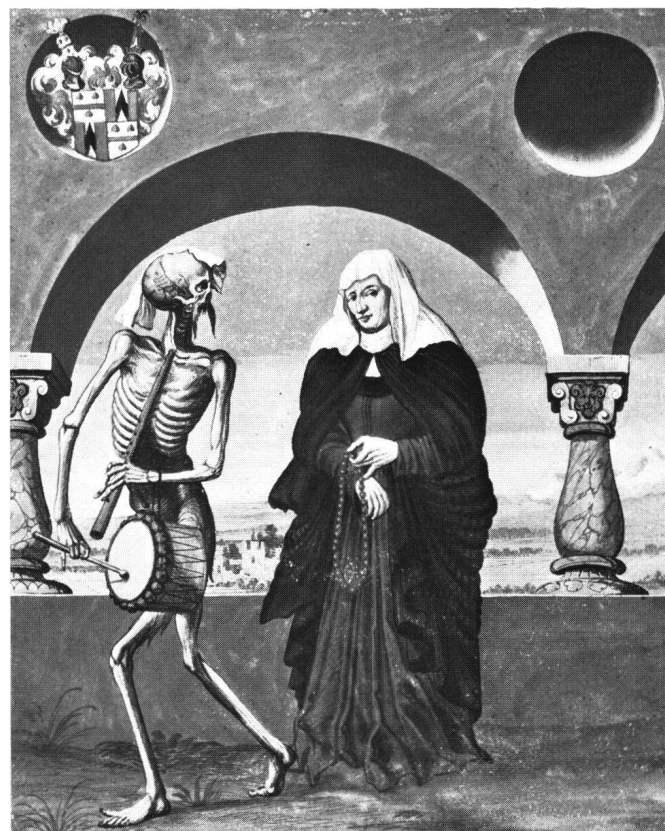
Fig. 3 Danse macabre de Niklaus Manuel, copie d'Albrecht Kauw. Veuve noble. Bernisches Historisches Museum (Inv. Nr. 822.18a).

Irrésistible meneur de jeu, comme le musicien de Hameln de la légende, comme le partenaire de «l'amoureux» de Guyot Marchant et comme le fifre de Bâle 38 , un mort moustachu joueur de serpent entraîne par le bras l'empereur de Nicolas Manuel; un autre précède la veuve (fig. 3), très digne dans sa robe pourpe et son manteau de deuil; il entame une danse «glissée» avec un accompagnement