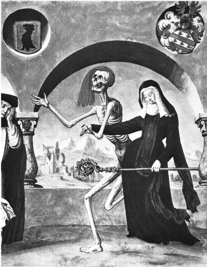
Fig. 6 Danse macabre de Niklaus Manuel, copie d'Albrecht Kauw. L'abbesse. Bernisches Historisches Museum (Inv. Nr. 822.8b).