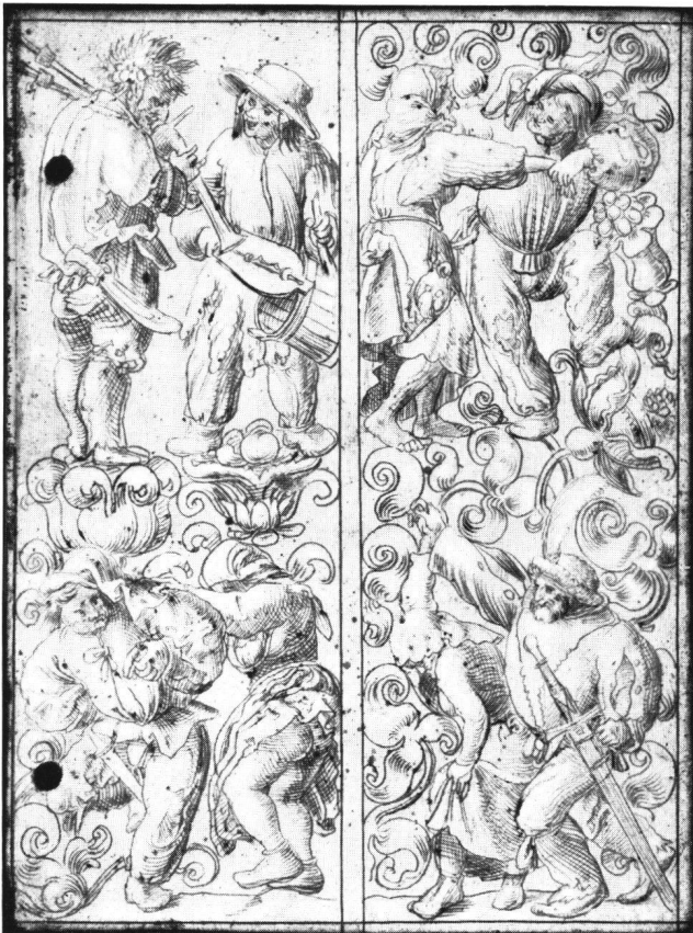
Fig. 2 Niklaus Manuel: Paysans dansant au son de la cornemuse et du battement improvisé, carnet de modèles. Mine d'argent sur bois, 10,7×8,1 cm. Cabinet des estampes du Musée des Beaux-Arts de Bâle (Inv. 1662.74).

Il faut attendre l'«Orchésographie» de 1588, par THORNOT ARBEAU, de son vrai nom Jean Tabourot, chanoine de Langres, pour trouver une explication systématique de «l'honneste exercice des danses 18 ». Né en 1519, Arbeau décrit aussi les danses d'origine ancienne, encore en usage au temps de sa jeunesse, avec une prédilection pour la