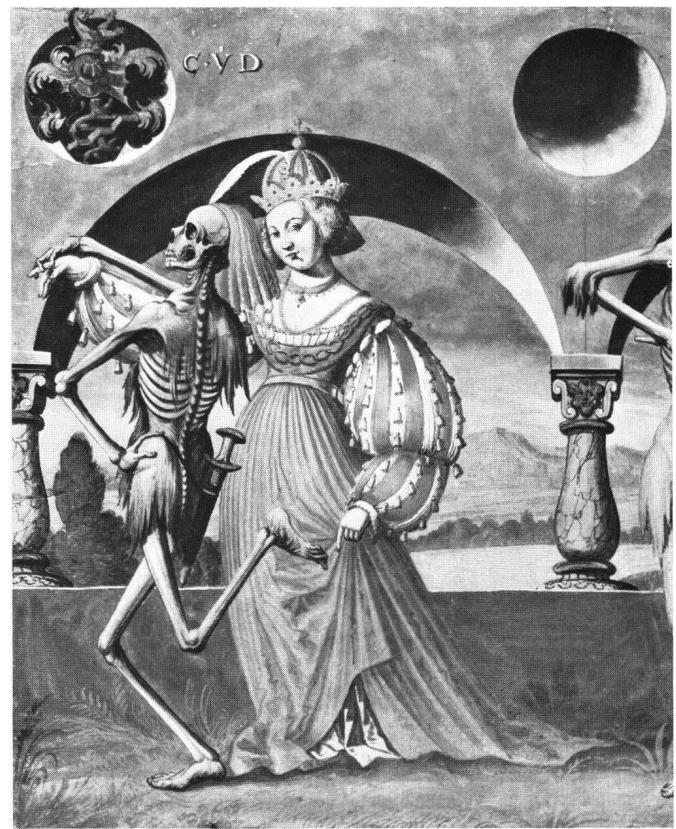
Fig. 5 Danse macabre de Niklaus Manuel, copie d'Albrecht Kauw. L'impératrice. Bernisches Historisches Museum (Inv. Nr. 822.11a).