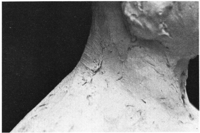
Fig. 3 Portrait de Mignet; plâtre primaire retouché sur la nuque.

De même, marchand et sculpteur définissent les conditions pour la cession des droits. Pour 1500 francs, par exemple, Auguste Klein 13 acquiert le droit de diffuser à son avantage le buste d'Elisabeth d'Autriche (Cat. H.B., n o 29, p. 132): «Je déclare céder à Monsieur Auguste Klein la propriété de mon petit modèle du buste de S.M. l'Impératrice