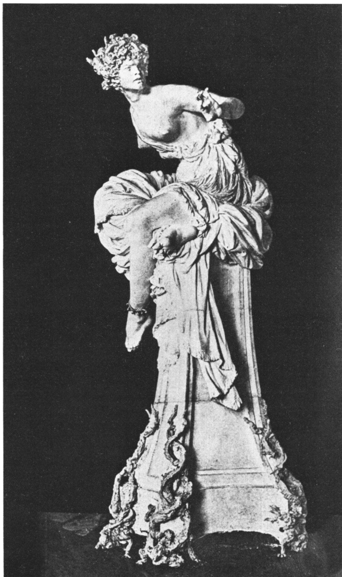
Fig. 7 Photographie de la Pythie , 1870; retouchée à la plume par Marcello pour corrections ultérieures. Fondation Marcello, Fribourg.

L'exécution d'une sculpture coûte fort cher. Si Marcello est parvenue à vendre sa Pythie de bronze pour l' Opéra Fr. 12000.—, elle a déboursé Fr. 6271.95 au fondeur Thiébaud , sans compter les frais déjà déboursés à Rome et pour le transport de Rome à Paris.