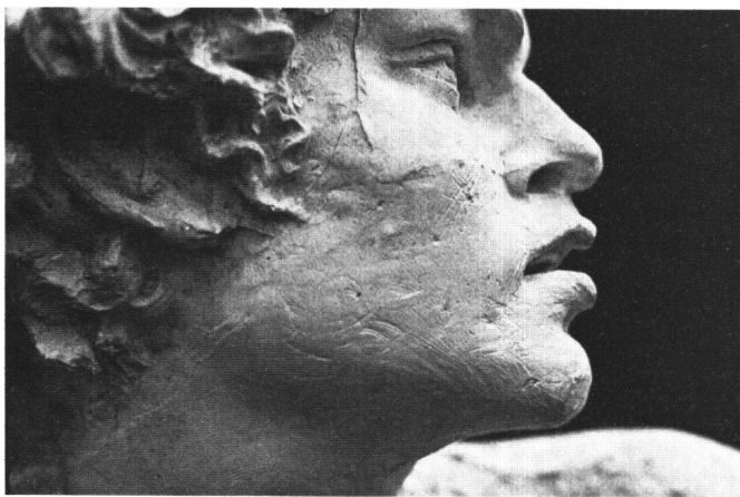
Fig. 1 La Pythie, 1870, fragment du plâtre; moulage obtenu à partir d'un moule à bon creux: plusieurs barbes de couture visibles. Fondation Marcello, Fribourg.

culier «l'éternité de la pierre». Le mouleur intervient, exécutant un moule à creux perdu pour obtenir la réplique exacte en plâtre à partir de laquelle le praticien, après la mise aux points (chefs-points ou points de basement, points secondaires, points justes), exécutera un marbre auquel on donnera la qualité de réplique, de reproduction authentique , que Marcello se chargera de terminer elle-même, selon contrat passé avec le praticien.