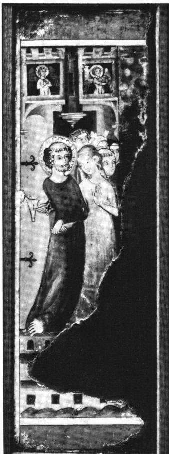
Abb. 1d Fragment eines Jüngsten Gerichts . Rückseite der nur teilweise erhaltenen Partie der sogenannten «Bieler Tafeln». Zürich-Konstanz, gegen 1330. Schweizerisches Landesmuseum Zürich (LM 7192.2). 85,5 × 28,5 cm.

malen Möglichkeit der Verbildlichung Gottes!) könnte dafür sprechen.