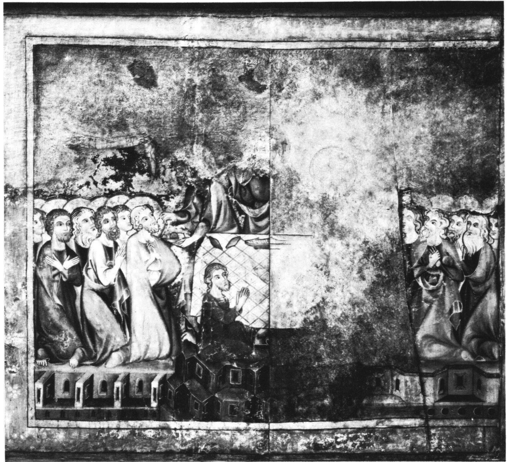
Abb. 1c Apostelkommunion . Rückseite des in der ganzen Größe erhaltenen Teils der sogenannten «Bieler Tafeln». Zürich-Konstanz, gegen 1330. Schweizerisches Landesmuseum Zürich (LM 7192.1). 85,5 × 99 cm.