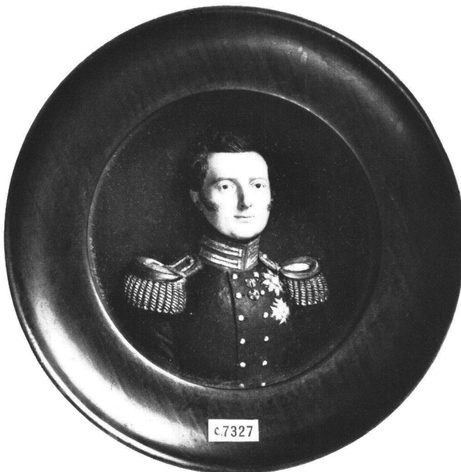
Abb. 5 Franz Xaver Heuberger: Bildnis von Großherzog Leopold von Baden , 1832. Badisches Landesmuseum, Karlsruhe.

König von 1816 bis 1864 Signiert: X. Heuberger fecit 1843 Brustbild en face, in ordensgeschmückter Uniform Rahmen viereckig, 22 × 21,2 cm Lit.: ANGELETTI, Abb. 18; PYKE, S. 68 Schweizerisches Landesmuseum, Zürich, LM 19837 Abb. 7