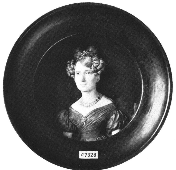
Abb. 6 Franz Xaver Heuberger: Bildnis von Großherzogin Sophie von Baden , 1832, Badisches Landesmuseum, Karlsruhe.