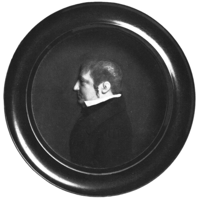
Abb. 16 Josef Gregor Heuberger: Bildnis eines Mannes aus der Familie Pfeninger. Schweizerisches Landesmuseum, Zürich.