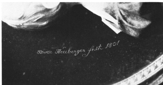
Abb. 21 Signatur von Franz Xaver Heuberger (Werkverzeichnis Nr. 9). Schweizerisches Landesmuseum, Zürich.

Signiert: Anton Heuberger fecit 1821 Brustbild, Profil, ein um die Schulter geschwungenes rotes Tuch bildet unten den Abschluß Rahmen rund, Dm. 9,5 cm Lit.: ПУКЕ, S. 67, Abb. 133 Städtisches Reiss-Museum, Mannheim, Vb 140