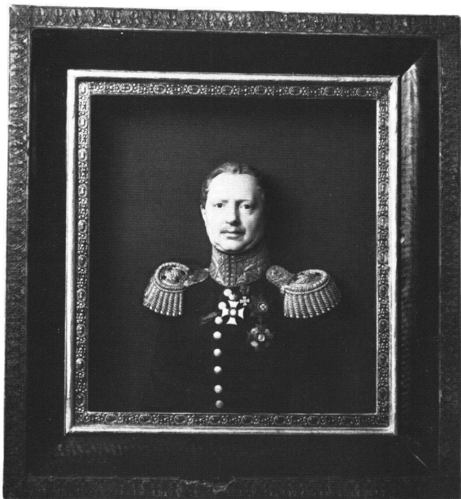
Abb. 7 Franz Xaver Heuberger: Bildnis von König Wilhelm I. von Württemberg , 1843. Schweizerisches Landesmuseum, Zürich.