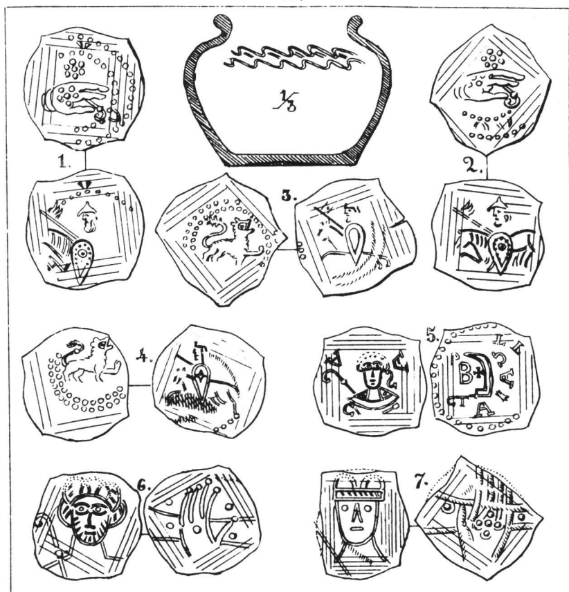
Abb. 1 Ausschnitt aus Tafel I des Werkes von C. F. TRACHSEL, Semi-bracteates inédites suisses et souabes du X e , du XI e et du XII e siècle, retrouvées en 1883, Lausanne 1884.

Münzen blieb. Ursache für die Brakteatenprägung war ein deutlicher Gewichtsverlust. Wog der Denar Karls des Großen 1,7 Gramm, so verringerten sich die Pfennige in unseren Gegenden bis zur Mitte des 12. Jahrhunderts auf knappe 0,5 Gramm, um später noch tiefer zu sinken. Genau an diesem Punkt steht der Schatz von Steckborn.