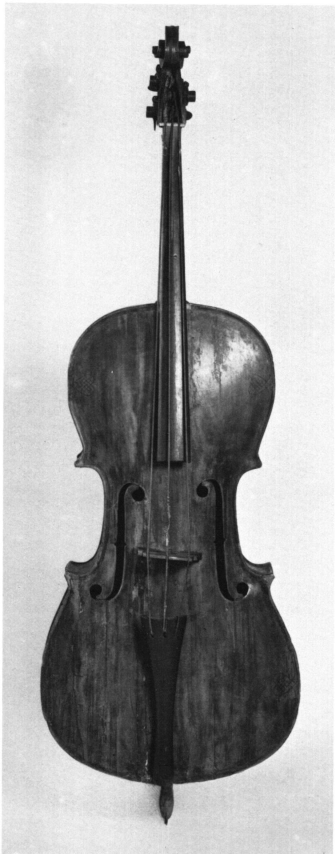
Abb. 3 Bassett wie Abb. 1. Vor der Restaurierung.