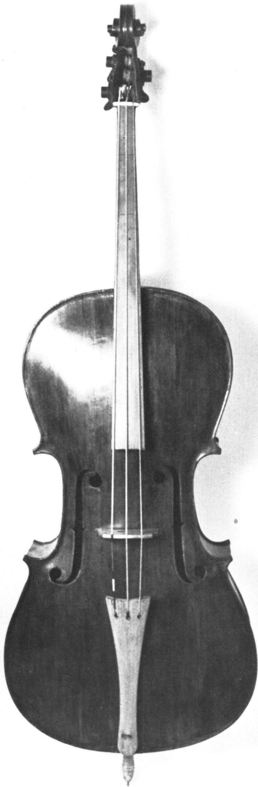
Abb. 1 Bassett von Hans Krouchdaler aus dem Jahr 1685 (LM 6504). Nach der Restaurierung.