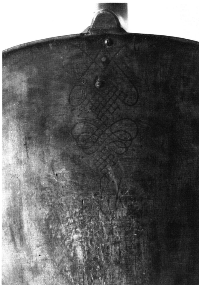
Abb. 4 Detail von Abb. 1. Intarsienornament im Boden. Vor der Restaurierung.

eingepaßt werden mußte. Weit offene Risse wurden mit Spänen gefüllt und ebenfalls durch Taqués verstärkt. Drei Ecken mußten auch am Boden ersetzt werden. Der mehrfach gerissene Oberklotz wurde geleimt. Die störenden Schrauben im Boden sind entfernt und die Löcher mit Holzapfen ausgefüllt worden. Fehlende Einlagen im Ornament mußten ersetzt werden.