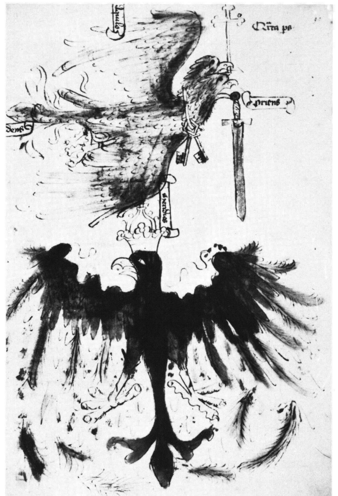
Abb. 3 Fol. 92r; Doppeladler über einköpfigem Adler.

In der Darstellung des Studium-Adlers schimmert die im 15. Jahrhundert geläufige Auslegung des Reichsadlers als Herrschaftszeichen über das westliche und das östliche Reich durch 35 . Bei Winandus ist die Zweiköpfigkeit allerdings programmatisch auf eine Vereinigung der westlichen und der östlichen Kirche hin stilisiert.