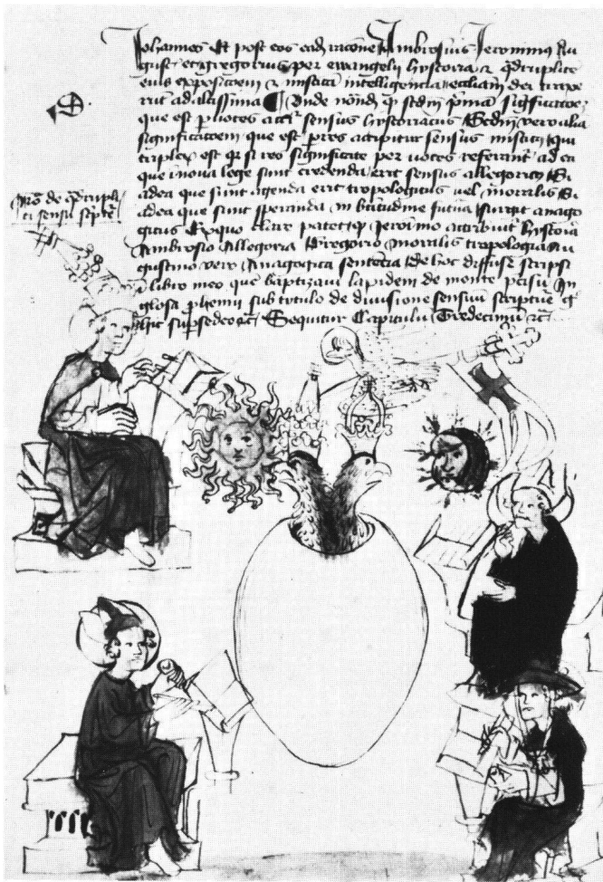
Abb. 2 Fol. 85v; Doppeladler aus Ei entschlüpfend.

ges Gefieder aus der Zeit des Schismas nun verliert. Über ihm fliegt der ungekrönte Doppeladler, an dessen Hals die zwei Schlüssel hängen, von Westen gegen Osten. Dem in die eschatologischen Koordinaten eingefügten Doppeladler ragen aus den beiden Schnäbeln das Kreuz und das Schwert, d.h. das geistige und das weltliche Schwert 27 . Die Anspielung auf Christus als Weltenrichter ist unübersehbar, zumal im Text der Adler auch Christus bezeichnet 28 und vom sol iustitiae , der im Westen aufgeht, die Rede ist 29 .