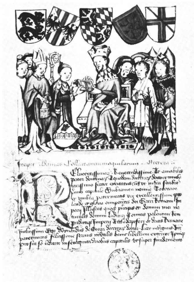
Abb. 1 Fol. 1r; Widmungsbild.

Absurditäten solcher Art sind möglich, weil die Bilder des Adamas collectancium aquilarum noch in keiner Weise in Verbindung zum Text, den sie begleiten, gebracht und nicht einmal geläufige religiöse Themen als solche erkannt worden sind 5 .