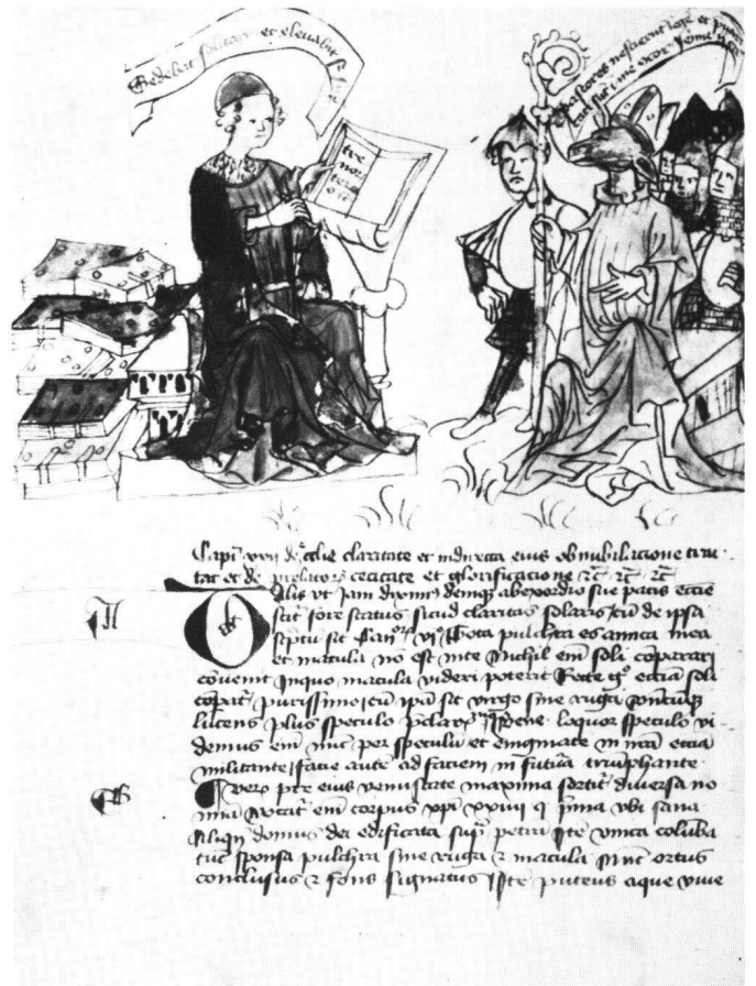
Abb. 5 Fol. 43v; Bischof mit Eselkopf.

In der Tat hebt sich eine Reihe von Bildmotiven von dem recht akademisch gehaltenen Text, mit dem sie oft nur in losem Zusammenhang stehen, ab. Diese Motive sind nicht direkt von biblischen und exegetischen Texten abgeleitet und gehören auch nicht zum festen Bestand kirchenpropagandistischer Motive, sondern stammen letztlich aus dem profanen Kulturbereich. Dazu gehört das schon erwähnte heraldische Motiv des Doppeladlers und dann Motive, die kirchliche Missstände anprangern, nämlich die Bilder eines affenköpfigen Bischofs mit heraushängender Zunge und insbesondere das Bild eines Bischofsesels 46 . Beim Anblick tierköpfiger kirchlicher Würdenträger kann man nicht umhin, an den durch Luther und Melanchthon berühmt gewordenen Papstesel zu denken. Damit kommen wir zum Problem der Bildpropaganda vor der Zeit der Reformation, die auf satirische Weise Missstände anprangert oder eventuell die römische Kirche als Institution überhaupt in Frage stellt.