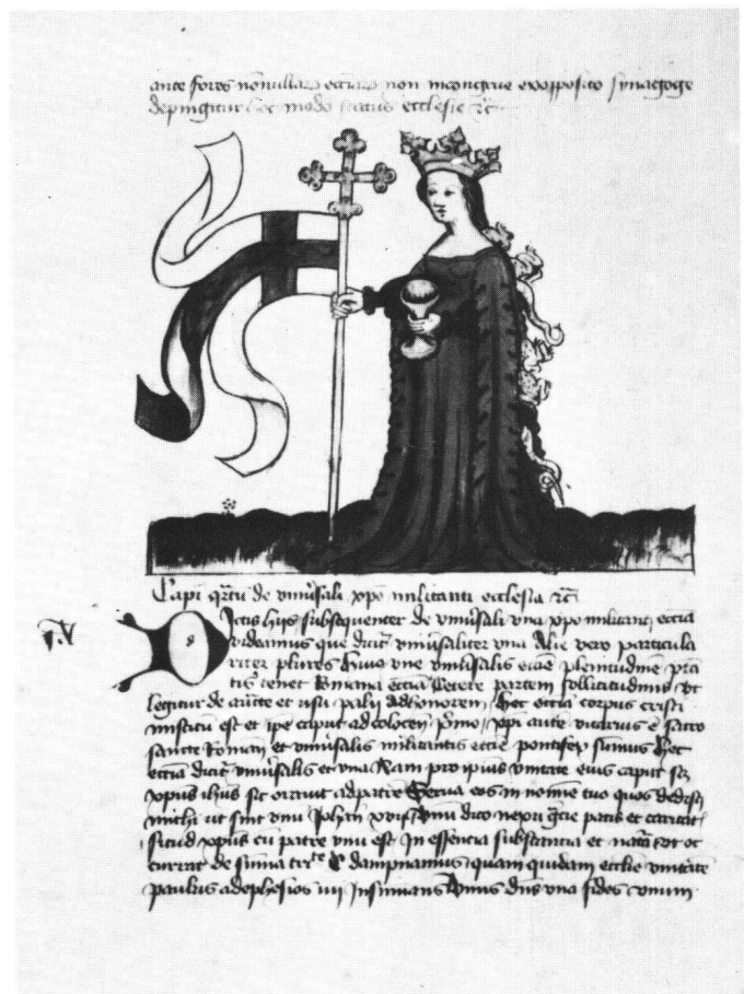
Abb. 6 Fol. 12v: Ecclesia als Frau Welt.

einigen kirchlichen Würdenträgern gegenüber als ein Unikum zu betrachten. Der allgemeine sittliche Verfall der Geistlichen stand am Konzil von Konstanz auf der Traktandenliste. Winand kritisiert denn auch, entsprechend einer langen Tradition, den jämmerlichen Zustand der Glieder, jedoch nicht des Hauptes und auch nicht der Institution an sich. Die symbolische Entkopplung der kirchlichen Institution, durch einen tierköpfigen Papst ausgedrückt, bleibt den radikalen Gegnern der bestehenden Kirche vorbehalten. Im Laufe des 15. Jahrhunderts wird zum Beispiel der Papst als Reinhard Fuchs auf dem Rad der Fortuna dargestellt 59 . Andererseits kann doch die Tatsache, dass Winand in der Eigenkritik so weit geht, Bischöfe mit Affen- und Eselskopf, also Figuren, die wie die hussitischen Christ-Antichrist-Bilder im öffentlichen Schandritual dienen konnten, aufzunehmen, als bezeichnend für die Krise der Kirche angesehen werden. So finden wir auch in der Zeit des Exils von Avignon, in der zum Teil geradezu vorreformatorische Zustände herrschten, und in der darauffolgenden Epoche des Schismas von Seiten reformgesinnter Prediger beissendste Satiren auf den Klerus. Der Dominikaner John Bromyard zum Beispiel, ein erbitterter Gegner Wycliffs, geisselt die gesamte Hierarchie und beschwört die bei Winand dargestellte Kirche als Frau Welt mit ihrem verrotteten Rückenteil 60 . Er betont,