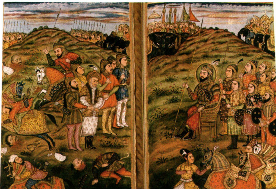
Fig. 4 et 5 Malfūzāt-i Tīmūr (folios 487 et 488). Inde, 1820. (page droite: H. 0,205 m; L. 0,148 m. Page gauche: H. 0,208 m; L. 0,155 m). Prisonniers présentés à Tīmūr.