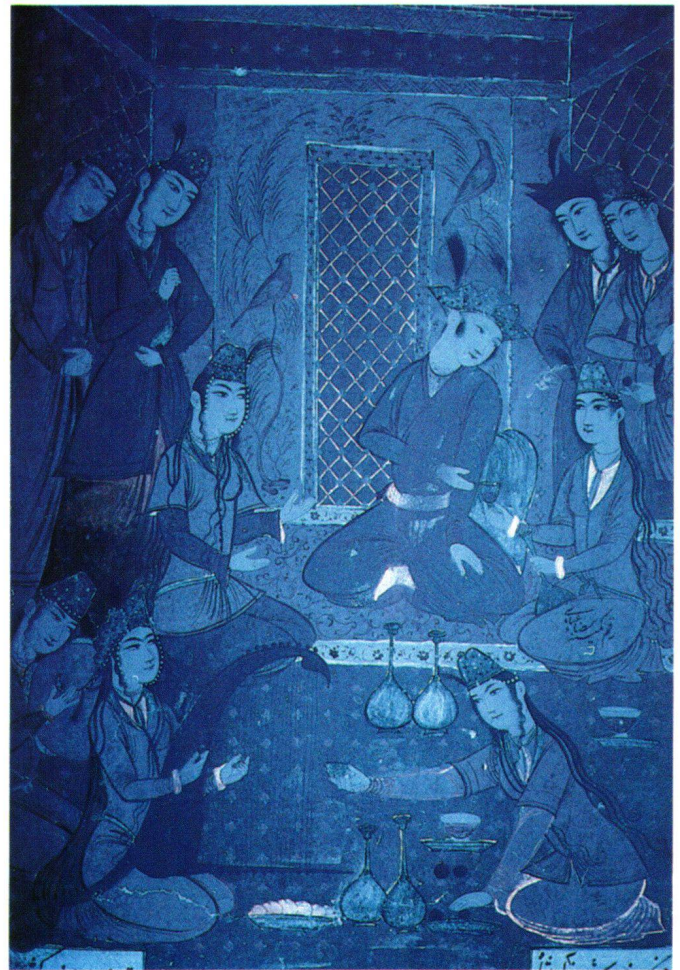
Fig. 1 et 2 Haft paykar de Nizâmi: Bahrâm Gûr chez la princesse du pavillon jaune (folio 29v). Peint par Riza 'Abbâsi. (H. 0,258 m; L. 0,199 m).