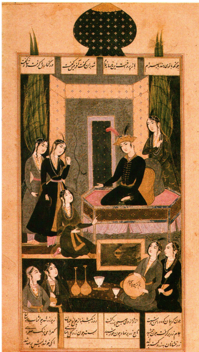
Fig. 3 Bahrâm Gûr chez la princesse du pavillon noir (folio 27r) (H. 0,252 m; L. 0,138 m). Peint par Riza 'Abbâsi.

jaune indien dans de nombreuses langues 15 . Retrouver par l'analyse un pigment présumé indien, pouvait être un indice intéressant pour l'identification du manuscrit. C'est ce qui a été réalisé par FRANÇOIS SCHWEIZER, au laboratoire du Musée d'art et d'histoire de Genève.