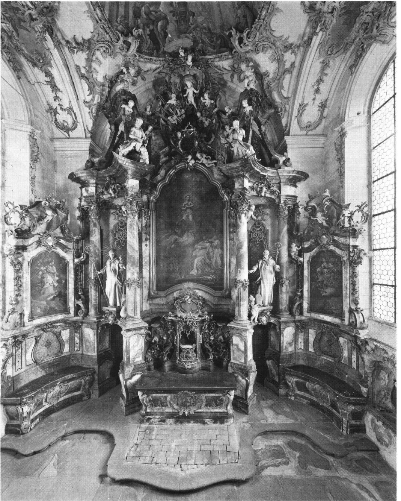
Abb. 2 Photogrammetrisches Messbild des Hochaltars vor der Restaurierung. Verzeichnungsfreie Aufnahme mit Präzisionskamera Wild P 31/45.