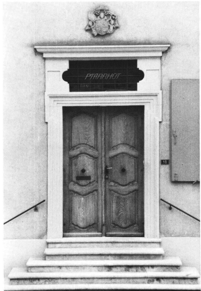
Abb. 3 Türe des Domherrenhauses 10 (heute kath. Pfarrhaus) in Arlesheim. Profilierte Türrumrahmung mit «Ohren».