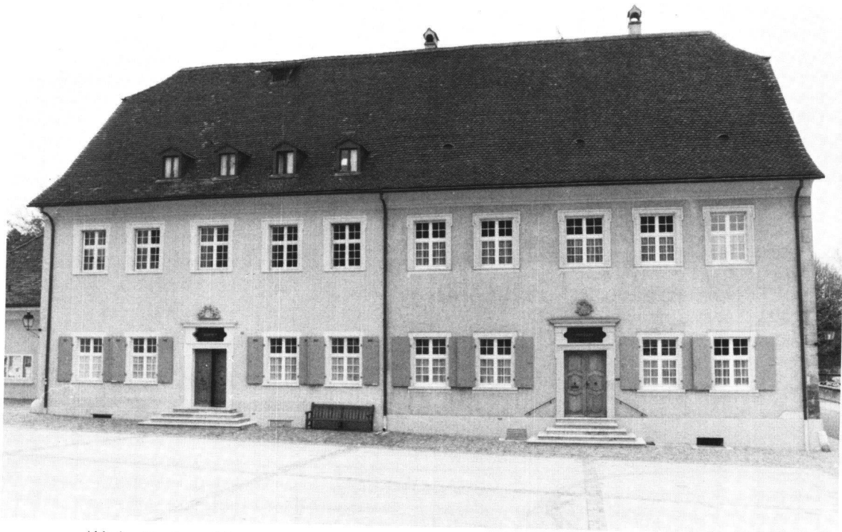
Abb. 1: Domherrenhäuser von Arlesheim, Domplatz 10/12, erbaut 1682/83 nach Plänen von Jakob Engel.