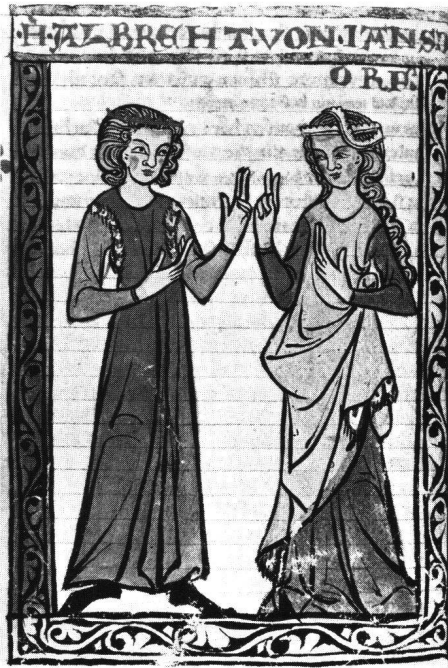
Abb. 1 Stuttgart, Württembergische Landesbibliothek: Cod. HB XIII 1, Bl. 40: Albrecht von Johansdorf .