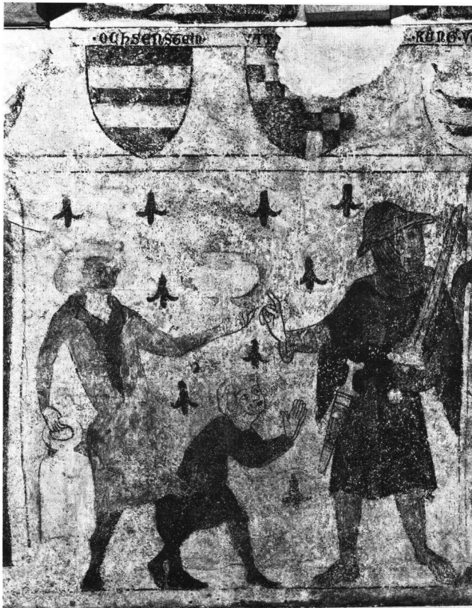
Abb. 2 Zürich, Schweizerisches Landesmuseum, Wandgemälde ehemals im Haus «Zum langen Keller»: Erste Ritterszene (Ausschnitt).