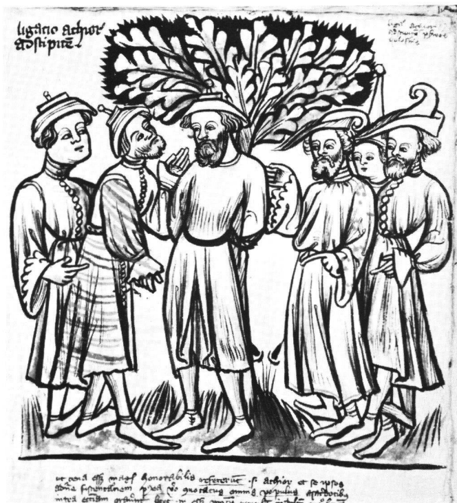
Abb. 5 Basel, Universitätsbibliothek: A II 5, fol. 182: Achior am Baum.