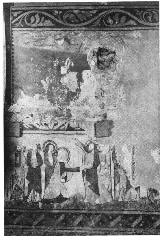
Abb. 4 Ormalingen, St. Nikolauskapelle, Nordseite: Ungläubiger Thomas (?).

Im Kontext des eingangs vorgeschlagenen Modells der Kunstlandschaft muss der Frage nach dem Stellenwert dieser Tradition innerhalb der Kommunikationsstruktur der Region nachgegangen werden. Gewisse Einblicke in die möglichen Gründe für die Bewahrung einer solchen Formtradition liefert bereits ein kurzer historischer Überblick 23 : Als neue, integrativ wirkende Kräfte treten im Lauf des 14. Jahrhunderts die durch verschiedene Hilfsabkommen miteinander verbundenen oberrheinischen Städte in den Vordergrund 24 . Nicht allein auf politischer Ebene, sondern noch viel enger im wirtschaftlichen und sozialen Bereich besteht zwischen