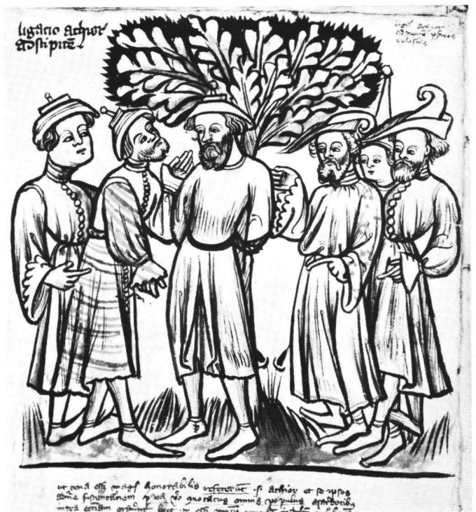
Abb. 5 Basel, Universitätsbibliothek: A II 5, fol. 182: Achior am Baum.