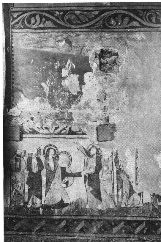
Abb. 4 Ormalingen, St. Nikolauskapelle, Nordseite: Ungläubiger Thomas (?).

Im Kontext des eingangs vorgeschlagenen Modells der Kunstlandschaft muss der Frage nach dem Stellenwert dieser Tradition innerhalb der Kommunikationsstruktur der Region nachgegangen werden. Gewisse Einblicke in die möglichen Gründe für die Bewahrung einer solchen Formtradition liefert bereits ein kurzer historischer Überblick 23 : Als neue, integrativ wirkende Kräfte treten im Lauf des 14. Jahrhunderts die durch verschiedene Hilfsabkommen miteinander verbundenen oberrheinischen Städte in den Vordergrund 24 . Nicht allein auf politischer Ebene, sondern noch viel enger im wirtschaftlichen und sozialen Bereich besteht zwischen