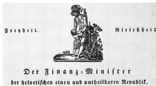
Abb. 10 Der Tell der Helvetischen Gesellschaft als Signet auf amtlichen Papieren der Helvetischen Republik: Links: Papier des Vollziehungs-Directoriums; Rechts: Papier des Finanzministers.