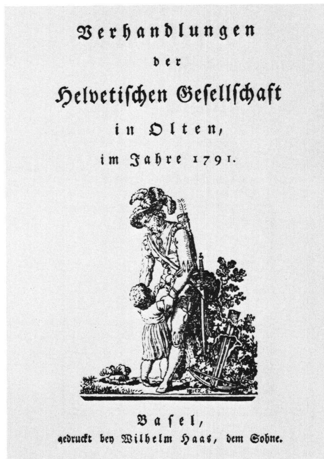
Abb. 8 Titelblatt zu den Verhandlungen der Helvetischen Gesellschaft im Jahre 1791.