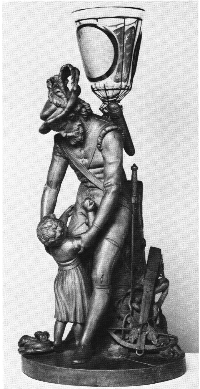
Abb. 1 Tellgruppe aus Holz von Alexander Trippel, 1782 der Helvetischen Gesellschaft in Olten überreicht. Höhe der Figur 47,5 cm. Der Pokal um 1830 erneuert. (Schweizerisches Landesmuseum).

Dass diese Tell-Statuette (Abb. 1) im Schweizerischen Landesmuseum über mehr als ein halbes Jahrhundert ein verborgenes Dornröschendasein führen konnte, ist nicht ganz verständlich. Denn an Gelegenheiten, auf sie aufmerksam zu werden, hat es nicht gefehlt. Wilhelm Tell und seine bildliche Überlieferung war im fraglichen Zeitraum ein aktuelles Forschungsthema 4 , ein anderes die Vergangenheit und geschichtliche Bedeutung der «Helvetischen