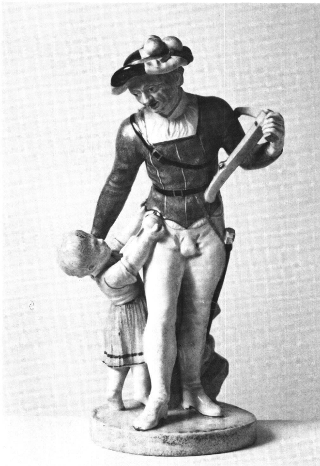
Abb. 4 Tellgruppe aus Pâte tendre. Porzellanmanufaktur Zürich. Um 1785. Höhe 27,5 cm. (Schweizerisches Landesmuseum).

der helvetischen Gesellschaft, sub Inventario, denen Herren Obrist Imhoof, und Obrist Sutter, Mitgliedern des Stadtrates von Zofingen, in Verwahrung übergeben» 34 . Und als man sich 1819 nach einem weiteren, durch die Besetzung der Schweiz 1814/15 bedingten Unterbruch in Schinznach wieder traf, freuten sich alle Anwesenden «beym traulichen Male und beym Kreisen des schönen Gesellschaftsbechers, welcher von Zofingen aus übersendet worden war, des Wiederauflebens der Gesellschaft, und schlossen enger den Bund eidgenössischer Freundschaft» 35 . Im folgenden Jahr wurden die Ziele der Gesellschaft neu definiert. «Sich mit allen Anstalten bekannt zu machen, welche in verschiedenen Cantonen zur Beförderung der Volksbildung, der Kenntnis der vaterländischen Geschichte, der Landeskultur bestehen» 36 , lautete eine Devise, der nachzuleben Johann Rudolf Schinz am Ende seiner Präsidiarrede die Versammlung mit dem Ausruf anspornte: «Auf denn, Freunde, Brüder, Eidgenossen! ein Trunk aus unserem Gesellschaftsbecher, der Tells Bild vorstellt, besiegle unsern Bund, unsern ernsten Vorsatz» 37 ! 1822 findet sich nochmals der Vermerk: «Unter Wechsel von traulichem Gespräch und begleitet von sinnvollen, herzlichen Trinksprüchen kreiste der alte Tellsbecher um das durch heiterste Stimmung gewürzte Mahl» 38 , und 1823 «tranken alle aus dem Tellsbecher unter dem Chorgesang vaterländischer Lieder» 39 .