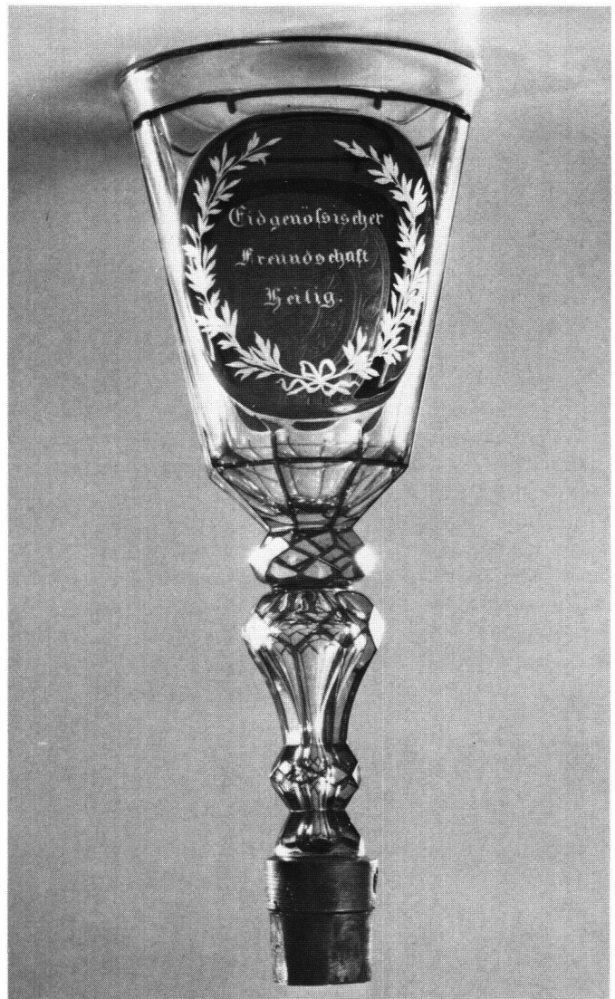
Abb. 2b Seite mit dem Widmungsspruch.

Riemen befestigt. Das Haupt des Helden schmückt reiches, gelocktes Haar; sein Gesicht, von einem kräftigen, gekrausten Vollbart umrahmt, zeigt fein und lebendig modellierte, klassisch anmutende Züge. Die schlank und beweglich gebildeten Hände fassen den Kleinen an den Schultern; gleich wird ihn der Vater zu sich hochziehen.