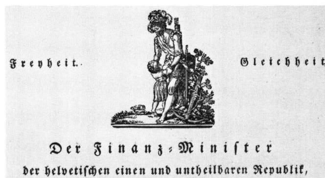
Abb. 10 Der Tell der Helvetischen Gesellschaft als Signet auf amtlichen Papieren der Helvetischen Republik: Links: Papier des Vollziehungs-Direktoriums; Rechts: Papier des Finanzministers.