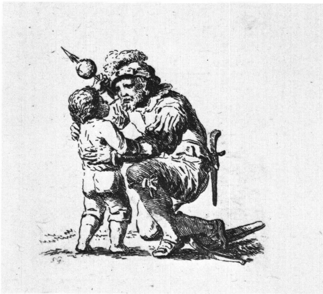
Abb. 6 Tellgruppe. Radierung von Salomon Gessner. 1779. (Schweizerisches Landesmuseum).

in den Figuren von Daphnis und Micon die sicher und geschmeidig gebildeten Körper und die sprechenden Gesten wiederfindet, desgleichen die Genauigkeit und Virtuosität in der stofflichen Beschreibung von Details und Zubehör wie der Lockenköpfe, des von Micon getragenen Vlieses, der Gewandfalten, der lebendig modellierten Baumstämme und der reich und dicht belaubten Baumkronen 48 .