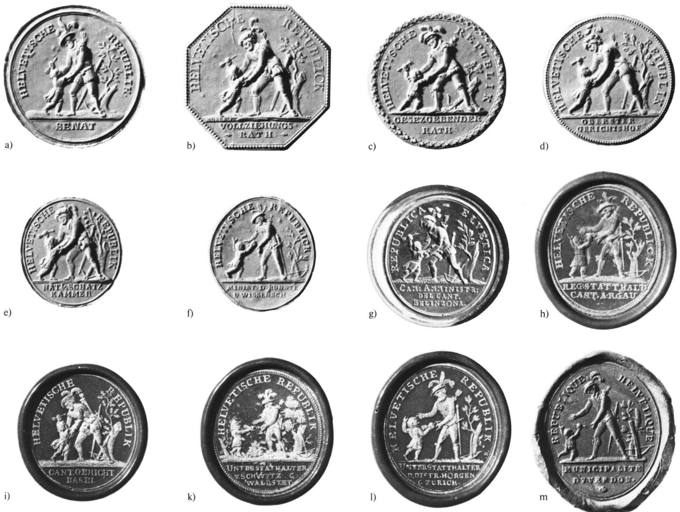
Abb. 9 Der Tell der Helvetischen Gesellschaft als Siegelbild der Helvetischen Republik:

a) Senat, b) Vollziehungsrath, c) Gesetzgebender Rath, d) Oberster Gerichtshof, e) Nationale Schatzkammer, f) Ministerium der Künste und Wissenschaft. – g) Siegelstempel Kantonale Verwaltung Bellinzona, h) Siegel der Regierungsstatthalters des Kantons Aargau, i) Siegel des Kantonsgerichts Basel, k) Siegel des Unterstatthalters von Schwyz, l) Siegel des Unterstatthalters des Distriktes Horgen, m) Siegel der Stadtverwaltung Yverdon.