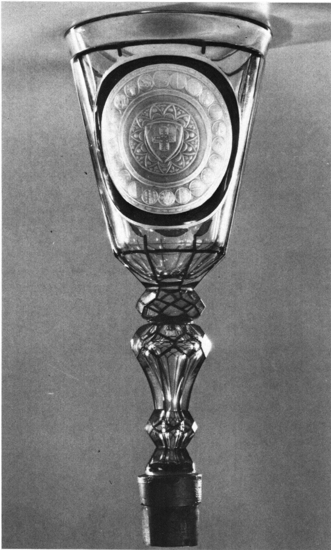
Abb. 2a Pokal vom Tafelaufsatz der Helvetischen Gesellschaft. Um 1830. Höhe 30,0 cm. Seite mit dem Schweizerischen Staatssiegel von 1815.