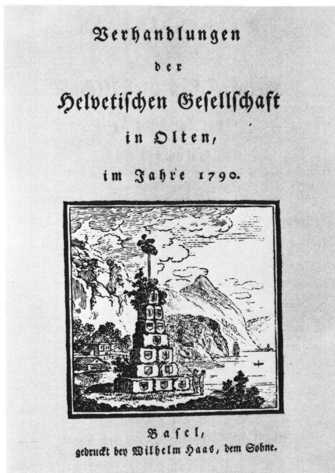
Abb. 7 Titelblatt zu den Verhandlungen der Helvetischen Gesellschaft im Jahre 1790.

Der Tell der Helvetischen Gesellschaft zeigte den Helden für Zurlauben von einer ihm bis anhin unbekanntem, völlig neuen Seite; hier war nicht die grausame Tat der Schussabgabe dargestellt, sondern der Vater, der nach der glücklich bestandenen, unmenschlichen Prüfung erleichtert und gerührt sein gerettetes Kind in die Arme schliesst. Die Szene mit dem Knaben, der nach erfolgtem Treffer dem Vater eilends den Apfel überbringt, war zwar im Tellenlied Lavaters vorgebildet, das die Gesellschaft seit 1767 sang; die entsprechende Strophe lautet dort: «Voll jugendlicher Munterkeit / sucht ihn der Knab; in Eil / bringt er dem Vater voller Freud / am Apfel seinen Pfeil» 58 . Neu und überraschend war im Bildwerk vor allem aber die Reaktion des Vaters festgehalten, war nicht der Heldentat, sondern der Vaterliebe ein Denkmal gesetzt. Zwar war auch dieser Aspekt schon früher beachtet worden. Die Frage nach den Gefühlsregungen von Tell und Sohn nach dem Schuss hat Lavater in einem Tellrecitativ gestellt, das 1779 als Neujahrsstück der Zürcher Gesellschaft ab dem Musiksaal erschienen ist mit dem Duett:» (1) Vater Tell! Wie war dir! Da / dein Aug den Knaben frey, den Apfel rollen sah? – (2) Knabe Tell! Wie war dir! Da / dein Blick