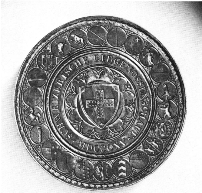
Abb. 3 Siegelstempel der Schweizerischen Eidgenossenschaft von 1815. (Schweizerisches Landesmuseum).

dem Versprechen, sie zu segnen, wenn er den helvetischen Becher bei seiner Einweihung an die Lippen setzte 23 . Er wird nicht versäumt haben, sein Versprechen einzulösen.