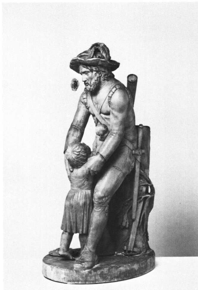
Abb. 5 Tellgruppe aus Holz von Franz Abart. Um 1800/1810. Höhe 46,0 cm. (Historisches Museum Sarnen).

Neben Abarts Tell, der sich leicht als Nachbildung zu erkennen gibt, erweist sich unser Exemplar als so lebendig gestaltet, dass die Frage, ob es sich nicht auch bei ihm um eine Kopie nach einem