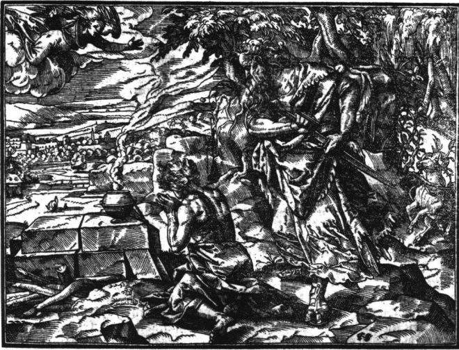
Abb. 17 Tobias Stimmer: Abraham und Isaak. Aus «Josephus Flavius, Historien und Bücher...», 1574. Holzschnitt Fol. 13 recto (Formschneider Hans Christoffel Stimmer).