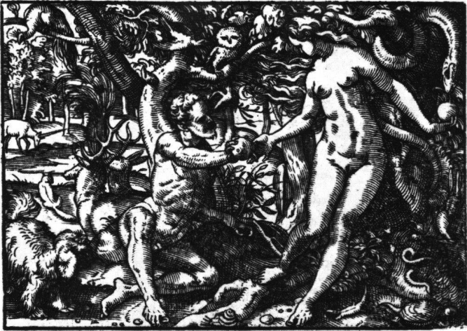
Abb. 2 Tobias Stimmer: Der Sündenfall. Aus «Neue Künstliche Figuren Biblischer Historien», 1576. Holzschnitt 3.