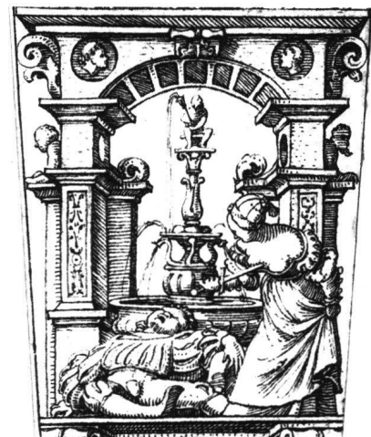
Abb. 21b Kopie nach Hans Holbein d.J.: Der Tod des Pyramus. Entwurf für eine Dolchscheide (Ausschnitt). Dessau, Gemälde-Galerie.