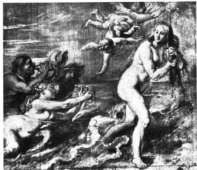
Abb. 5 Peter Paul Rubens: «Geburt der Venus», um 1636/38. Ölskizze. Brüssel, Musées Royaux des Beaux-Arts.