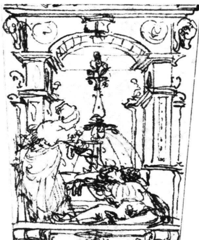
Abb. 21a Hans Holbein d.J.: Der Tod des Pyramus. Entwurf für eine Dolchscheide (Ausschnitt). Basel, Kupferstichkabinett.

Mit seinen Reizfiguren, besonders den Liegefiguren, nimmt Stimmer an einer Experimentierung teil, die in Oberitalien, stellenweise auch in Süddeutschland, seit den 1520er Jahren einsetzte und sich als ein Ferment der Entwicklung auswirkte, stilistisch sowohl