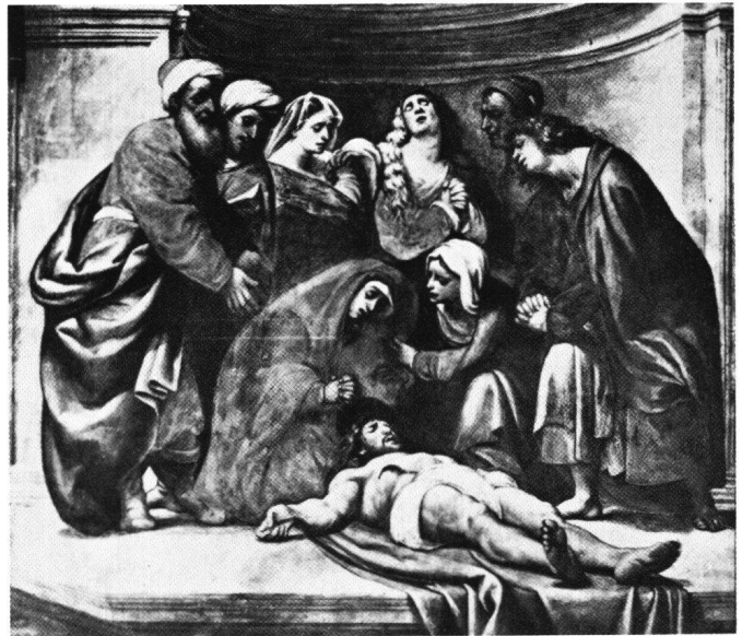
Abb. 22 Giovanni Antonio Pordenone: Beweinung Christi, 1522. Fresko. Cremona, Dom.

Allerdings, vor radikalen Konsequenzen der Skurzierung, wie sie sich bei intellektueller Konstruktionsarbeit einstellen, hat sich Stimmer gehütet. Die Sorge um ein Minimum an Proportionierung und um gute Lesbarkeit hält ihn von Fusssohlen- und Nasenlöcheransichten ab. 56 Diese Vorbehalte decken sich – gewiss ohne Zusammenhang – mit der zunehmenden Skepsis in den italienischen Traktaten seit etwa 1560. Es entspricht Stimmers Vorgehen, wenn LODOVICO DOLCE um 1557 einen sparsamen Einsatz der «scorti» empfiehlt (um umso sicherer den Effekt der «meraviglia» zu erzielen). 57 Im gleichen Sinne äussert sich PIETRO ARETINO . Indessen gehört der «scurto», aus Gründen der «difficultà» und des «stupore», doch zu den Prärogativen der Maler. 58 In der gegenreformatorischen Reaktion gilt dann das «Augenmass», zugunsten des «decoro», mehr als die perspektivische Verblüffung.