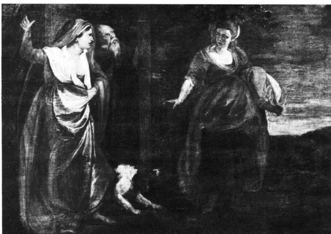
Abb. 8 Peter Paul Rubens: Verstossung der Hagar, um 1618. Leningrad, Eremitage.

Einen direkten Fingerzeig auf die Art seiner Faszination hinterlässt Rubens auf dem Blatt mit Judith und Hiobs Frau (Abb. 6). 25 Zu Judith ist beigeschrieben: «sy taster int doncken naer» (sie tastet danach im Dunkeln, d.h. nach dem Haupt des Holofernes). Stimmer gibt nicht die Enthauptung des Holofernes selber, auch nicht die Triumphierende mit dem Haupt des Getöteten, wie es im späteren 16. Jahrhundert international üblich war, 26 vielmehr die Ertastung des Todgeweihten in der Finsternis, eine absonderliche Geste voller Spannung (Abb. 7). Vergeblich hätte man in den zahlreichen Judith-Darstellungen oder den Affektbeschreibungen des 16. Jahrhunderts nach einer solchen analytisch differenzierten Pointierung gesucht. Sie ist offenbar Stimmers Erfindung. Rubens beobachtet auch genau das rätselhafte Buckelgebilde rechts, mit Kissen, Bettwange, Kopf und Arm: in der Sicht der Tastenden, die in der Dunkelheit zu unterscheiden versucht. Hingegen nimmt der Kopist kaum die nachhaltigen Schraffuren auf, die die Nacht