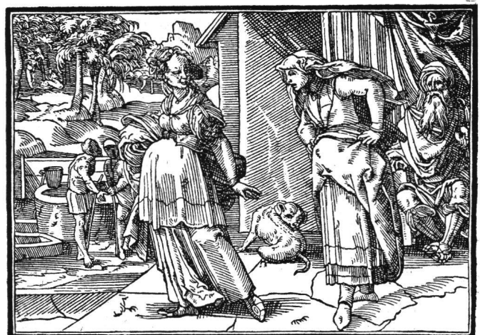
Abb. 9 Tobias Stimmer: Verstossung der Hagar. Aus «Neue Künstliche Figuren Biblischer Historien», 1576. Holzschnitt 13.