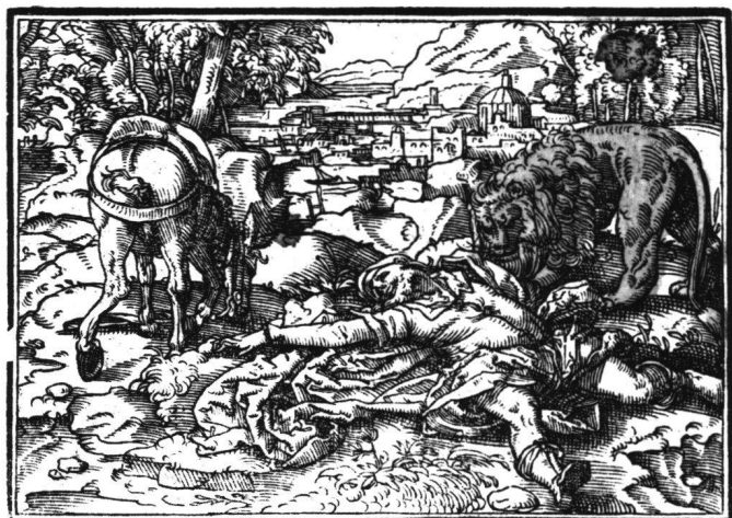
Abb. 11 Tobias Stimmer: Die Strafe des ungehorsamen Gottesmannes. Aus «Neue Künstliche Figuren Biblischer Historien», 1576. Holzschnitt 92.

tionelle Disposition (wenn auch nicht die Gestik Sarahs) folgt ausnahmsweise der Stimmerschen Anlage. Im Repertoire des reifen Rubens hat sich die Affektgestalt Hagar gehalten, gewiss infolge ihrer auffälligen «Serpentinata»-Bewegung, in welcher sich gleichzeitig Vorwärts- und Rückwärtsdrang, Demut und Selbstsicherheit zu erkennen geben.