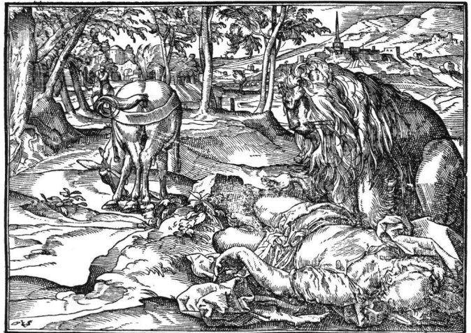
Abb. 13 Tobias Stimmer: Die Strafe des ungehorsamen Gottesmannes. Aus «Josephus Flavius, Historien und Bücher...», 1574. Holzschnitt Fol. 125 verso (Formschneider Christoffel van Sichem).

Eine solche Beteiligung des Betrachters durch direkte Einholungen formaler und emotiver Art wird bekanntlich in der Bildregie des Barocks zu ihrer vollen Konsequenz kommen. Indem der Bildraum – und was darin geschieht – in den Betrachtarraum geöffnet wird, kühnen Tiefenachsen folgend, die «heilige» vordere