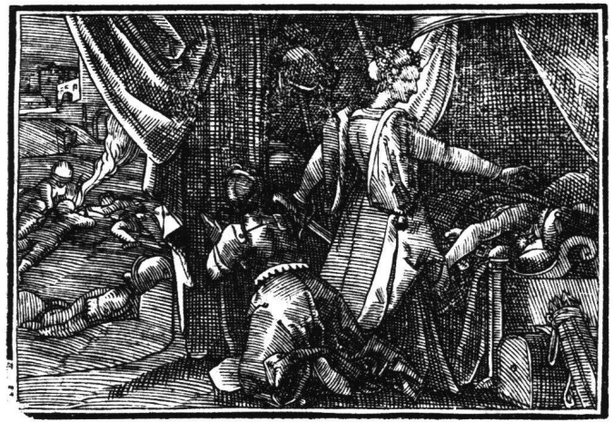
Abb. 7 Tobias Stimmer: Judith und Holofernes. Aus «Neue Künstliche Figuren Biblicher Historien», 1576. Holzschnitt III.

Für alle hier besprochenen Blätter gilt, dass Rubens mit Feder und Tinte (in Braun) arbeitet, dem Material, das der Struktur des Holzschnitts am nächsten kommt. Sowohl die Umriss- wie die Schraffuren Stimmers sind respektiert, ohne Vorzeichnung, mit einer Treffsicherheit, die ein ungewöhnliches Mass an Identifikation voraussetzt. Rubens, sonst bekannt als Erfinder, zeigt sich hier, beim Nachvollzug, einführend, Linie für Linie. Und doch dringen schon hier seine besonderen Intensitäten durch. Die Schraffuren