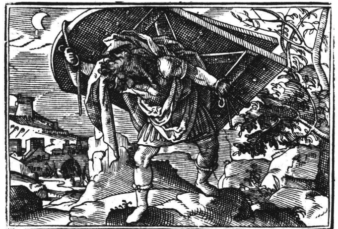
Abb. 15 Tobias Stimmer: Samson trägt die Türen des Stadttors von Gaza weg. Aus «Neue Künstliche Figuren Biblischer Historien», 1576. Holzschnitt 69.

An dieser Stelle kommt man in Versuchung, zur Beglaubigung des Barockgehalts in seinen Kühnheiten einen eher übermütigen Sprung zu tun. 1584, das Todesjahr Stimmers, ist zugleich ein markantes Carracci-Jahr. «Bologna 1584» hiess eine bolognesische