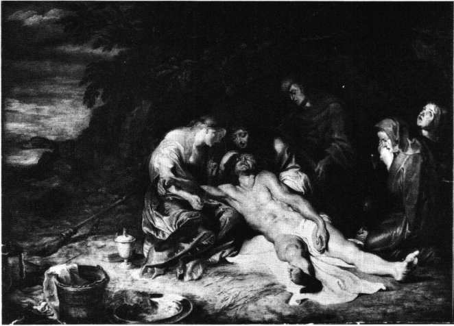
Abb. 12 Peter Paul Rubens: Beweinung Christi, um 1614. Antwerpen, Musée Royal des Beaux-Arts.

Wohlgestalt nicht auf, dem «decoro» entsprechend. Sowohl Stimmer wie Rubens gehen indessen nicht von der Liegefigur der Theorie und der Unterweisung aus, sie entwerfen sie aus der «historia».