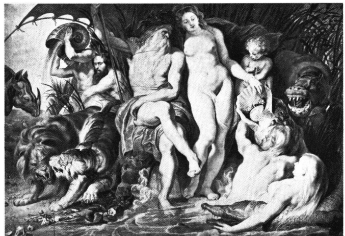
Abb. 4 Peter Paul Rubens: «Neptun und Amphitrite», um 1618, Berlin-Dahlem, Staatliche Museen Preussischer Kulturbesitz.

Das Skizzenblatt mit vier weiblichen Akten (Louvre Abb. 1) 11 entspricht dem traditionellen Musterbuchverfahren: viermal ein Akt; viermal in einer andern Haltung und Bewegung, stehend, liegend, wegeilend; viermal aus einer andern Bildquelle (davon eine aus Jost Amman 12 ), je unverbunden; jede für sich abrufbar für späteren Gebrauch – zusammen ein kleines Repertoire exemplarischer weiblicher Aktmotive. Alle vier stammen aus Eva-Szenen (Abb. 2 und 3), doch sind die Eva-Attribute ausgeschieden. Damit sind die Figuren mit ihren Bewegungstopoi verfügbar gemacht.