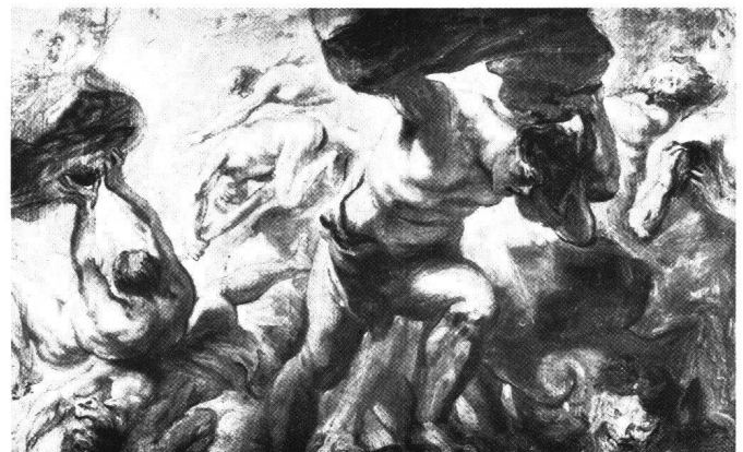
Abb. 16 Peter Paul Rubens: Titanensturz, um 1636/38. Ölskizze. Brüssel, Musées Royaux des Beaux-Arts.