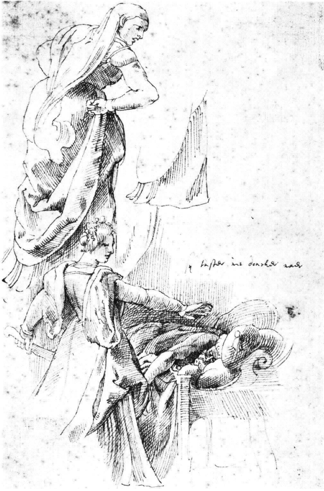
Abb. 6 Peter Paul Rubens: Hiobs Weib (oben), Judith und Holofernes (unten), nach Tobias Stimmer, um 1595/98. Federzeichnung. Privatbesitz.

Tatsächlich verfügt Rubens lebenslang über sie. Die Stehende rechts oben kehrt wieder in der Berliner Amphitrite (Neptun und Amphitrite, um 1618, Berlin-Dahlem, Abb. 4) 13 , in derselben, etwas unfreien, doch sinnlichen Ponderation, wenn auch nun eher frontal und ohne die – situationsbedingte – Zuwendung des Oberkörpers nach links. Der schlanke, geschmeidige Typus, in welchem weibliche Ausladungen und Dellungen vermieden sind, unterscheidet sich deutlich von dem üppigeren Ideal, wie es in den «hochbarocken» Jahren nach 1612 vorherrscht. – Die Eilende (in der Rubens-Kopie rechts unten) mit dem vorgestellten näheren Bein – eine seltene Haltung mit «pudica»-Konnotation – und rückwärts gewandtem Kopf hat eine Nachfahrin in der Venus von Torre de la Parada, dem königlich spanischen Jagdschloss, einem Spätwerk von 1636/38 (Abb. 5) 14 Die Bewegung (der aus dem Paradies vertriebenen Eva) geht hier über in die Geburt der Venus – der Göttin, die leuchtend dem Meer entsteigt und, ihrerseits rückwärts blickend, auf Seegötter und Nymphen, ihr berühmtes nasses Haar auswindet. Die Gleichung Eva = Venus – dass, in Rubens' Schaffen, der Typus der schuldbeladenen Eva ihre Wieder-Geburt in der Venus Anadyomene haben kann – lässt die ganze Freiheit und Souveränität, aber auch die Hintergründigkeit in der Auswertung des Topos