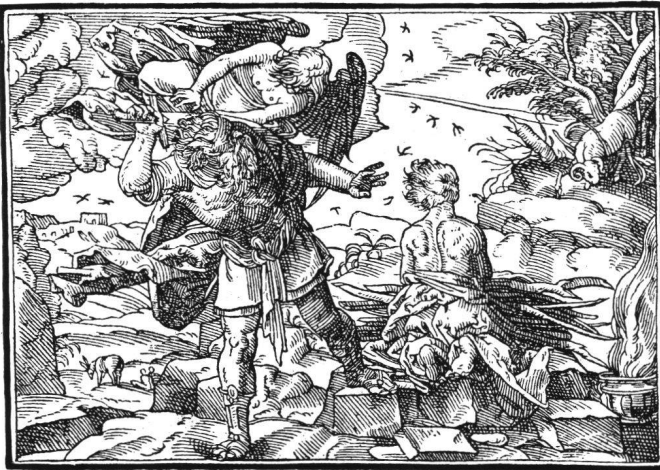
Abb. 18 Tobias Stimmer: Abraham und Isaak. Aus «Neue Künstliche Figuren Biblischer Historien», 1576. Holzschnitt 17.

Ausstellung im Herbst 1984, zu Ehren der Friesmalerei im Palazzo Fava, die vom Barocktriumph in der Galleria Farnese in Rom (1597) manches vorausnimmt. 42 Dort, am Hauptort der römischen Frühbarockmalerei, hat Rubens seinerseits später gezeichnet. 43