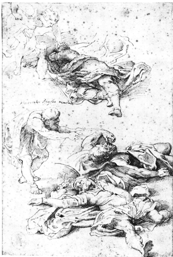
Abb. 10 Peter Paul Rubens: Studien mit Liegefiguren, nach Tobias Stimmer, um 1595/98. Federzeichnung. Rotterdam, Museum Boymans-van Beuningen.

Wie tief und wie anhaltend solche Stimmer-Eindrücke haften, kann seine Verstossung der Hagar (Leningrad) von etwa 1618, also volle zwanzig Jahre später, bezeugen (Abb. 8). 27 Der Maler selber schreibt zu diesem Bild, anlässlich des Verkaufs an Sir Dudley Carleton 1618: «ein wirklich origineller Vorgang, der weder sakral noch profan genannt werden kann . . . ; er stellt Sarah dar, im Begriff Hagar zu schelten, die schwanger in einer Haltung voll weiblicher Würde das Haus verlässt». 28 Eben dies, den «wirklich originellen Vorgang» und die «Haltung voll weiblicher Würde», hatte Rubens dem Vorbild Stimmers entnommen (Abb. 9). Selbst die komposi-