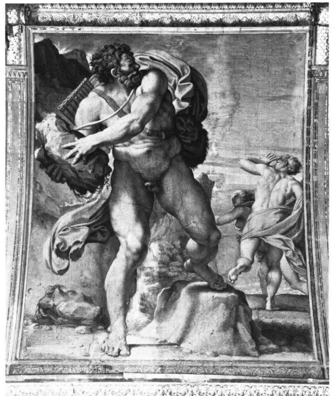
Abb. 19 Annibale Carracci: Polyphem und Acis, 1597. Fresko. Rom, Galleria Farnese.

Die Stichworte verraten, dass die aktuelle humanistische Kunsttheorie samt ihren antiken Grundlagen dem Autor in grossen Zügen bekannt war. Unter seinen Gewährsmännern erscheint bereits VASARI. Dem Text liegt die Horazische Doktrin «ut pictura poesis» zugrunde. Ja, der dreiteilige Aufbau der Bildseiten – mit Bibelnachweis und Inscriptio (quasi Lemma), Bild (Icon) und anschliessendem Fünfzeiler (als Subscriptio, quasi Epigramm) – ergibt eine besondere Engführung von Text und Bild im Zeichen ihrer Gleichwertigkeit. 45 Die Historien der Bilderbibel seien «gmalte Poesi», indessen in einem weiteren Sinne – unter Einschluss scharfer Verstandeskkräfte – als «gmalte Philosophi». «Drum warn die Maler je und je / Poeten und Philosophi». Zudem meldet sich das – seit Alberti verbreitete – Ideal des «doctus pictor»: ausser der Kenntnis der heiligen Schrift sei auch Vertrautheit mit Geometrie