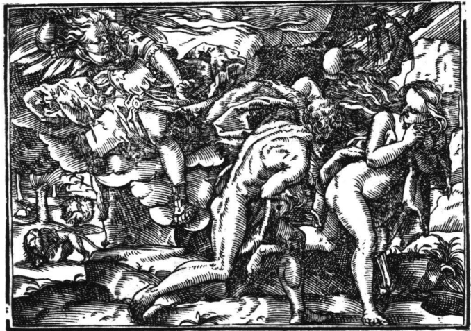
Abb. 3 Tobias Stimmer: Vertreibung aus dem Paradies. Aus «Neue Künstliche Figuren Biblischer Historien», 1576. Holzschnitt 4.

werke scheint dem Flamen vor Augen gekommen zu sein. Ihm tritt da der Erfinder von Historien entgegen, der bilderreiche Erzähler – der Erzähler dem Erzähler. Da die Historienmalerei, «ut poesis», mit Abstand auf der obersten Stufe der Gattungshierarchie stand, findet die Begegnung innerhalb der höchsten Ansprüche statt: es geht um erzählte Historie mit erzählten Figuren.