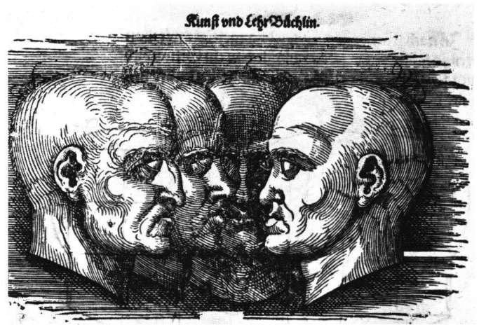
Abb. 9 Hans Sebald Beham: Vier in einem Quadratnetz konstruierte Männerköpfe. Holzschnitt aus dem «Kunst vnd Lehrbüchlein» (zuerst Frankfurt 1546, hier nach der Ausgabe von 1605 im Basler Kupferstichkabinett), 13,8×8,6 cm.