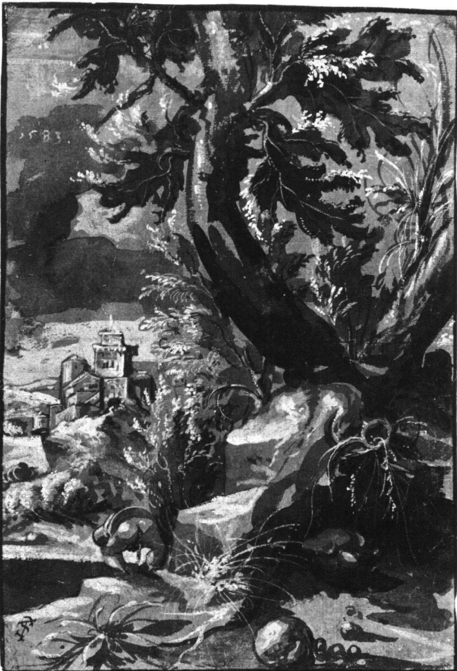
Abb. 1 Tobias Stimmer: Landschaft mit einem seine Notdurft verrichtenden Mann, 1583. Pinselzeichnung auf grau grundiertem Papier, 30,0×19,9 cm. Berlin Kupferstichkabinett (KdZ 17326).

Wenn es überhaupt, ausser dem Monogramm, Argumente für Stimmers Autorschaft gibt, so findet man sie nicht in Gestalt seiner späten Clair-obscur-Werke, eher zunächst in derjenigen einer frühen, einundzwanzig Jahre zuvor entstandenen Federzeichnung des 23jährigen Tobias Stimmer: in der Budapester Venus von 1562 (Abb. 2; Nr. 191). 8 Auch in dieser eigenartig freiräumigen, grosszügig bewegten Zeichnung scheint Stimmer (wie RAINER MASON in seinem Kolloquiumbeitrag nachwies) italienische Anregungen zu verarbeiten, allerdings so eigenständig, wie es Stimmer immer tat. 9 Die technischen Unterschiede erlauben freilich höchstens zu sagen, dass Ähnlichkeiten zu finden sind in der präzis-lockeren Markierung der Blätter und Schilfwedel sowie im Gefühl für den elastischen Zusammenhang zwischen einem festen Stamm, den bewegten Zweigen und den in der Luft spielenden Blättern. Dass die Landschaft im Verhältnis von Vorder- und Hintergrund hier wie