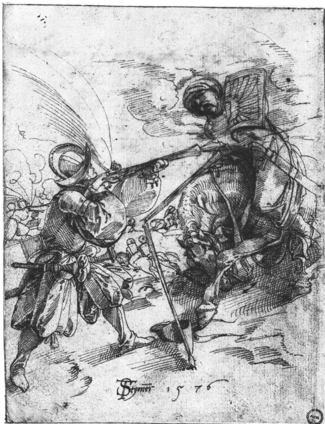
Abb. 4 Tobias Stimmer: Arkebusier und zusammenbrechender Türke zu Pferd, 1576. Federzeichnung, 19,8×15,1 cm. Basel, Kupferstichkabinett der Öffentlichen Kunstsammlung (1927.94).

HANSPETER LANDOLT hat in seinem Aufsatz über die Geschichte der zeichnerischen Form Dürers von der Türkenkampf-Zeichnung Stimmers aus dem Jahr 1576 (Abb. 4) gesagt, es werde «die Bewegung durch den trockenen [düererischen] Schraffurstil geradezu paralyisiert». 12 Er beobachtete ebenso die meisterhafte Differenzierung zwischen der straffen Gespanntheit des Strichs beim Schützen und der quasi symbolischen Gebrochenheit der Linien und Schraffurfelder beim zusammenbrechenden Türken. 13 Halten wir neben den Türken den von Stimmer etwa fünfzehn Jahre früher für eine Kabinettsscheibe gezeichneten Marcus Curtius (Abb. 5) – auch dies eine düererische Schraffurzeichnung (Nr. 258) 14 –, dann müssen wir bemerken, dass der üblicherweise positiv verstandene Begriff der «freien Dynamik» und der zunächst vielleicht negativ befrachtete Begriff der «Paralyse» auf Stimmers Kunst in einer besonderen Art angewendet sein möchten, gemäss einem besonderen «Kunstwollen». Der etwas weit hergeholte Vergleich mit einer michelangelesken, gleichmässig dichten, tonigen Federschraffurzeichnung von Lelio Orsi im British Museum (Abb. 6) 15 möge andeuten, dass wir das ruckhafte Hin und Her, die abstrakte Entdynamisierung oder Bremsung, die Verblockung des äusserlich heftigen Bewegungsmotivs und die dekorative Einbindung hier wie dort als Ausdruck eines neuen Stilwillens zu verstehen haben. Die Einkkerkerung der