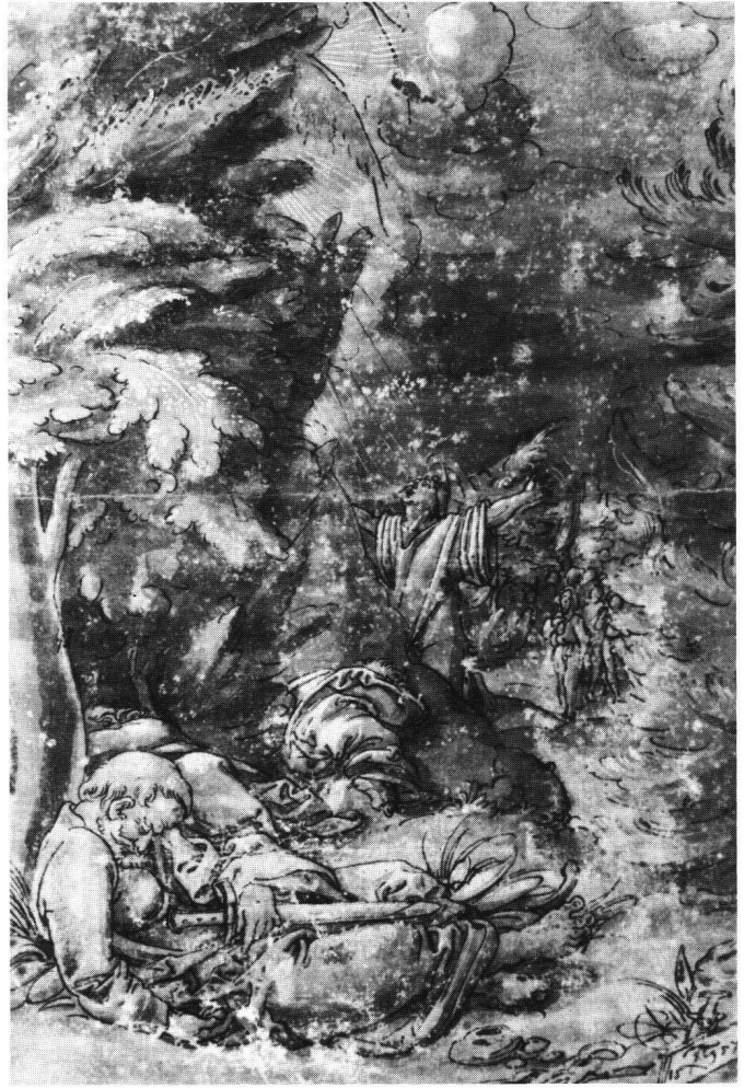
Abb. 3 Tobias Stimmer: Christi Gebet am Ölberg, 1557. Federzeichnung, mit dem Pinsel weiss gehöht und grau laviert, auf rot grundiertem Papier, 29,3×19,3 cm. Dessau, Staatliche Galerie (B V 11).

dort ähnlich aufgebaut und so lichterfüllt ist wie sonst selten bei Stimmer, wird gern notiert. Beachtlich scheint mir zu sein, dass wir in beiden Werken nicht einfach nur entspannte und naturseelige Formulierungen antreffen, sondern auch abstrakte Gebundenheit und Naturverfremdung: bei der Budapester Zeichnung durch die partielle Abstraktheit des Schraffurstrichs generell – und speziell beispielsweise im merkwürdig abwesenden Gesicht der Venus, bei der Berliner Zeichnung durch eine gewisse belastende, dadurch expressive Gefülltheit des Blattes, auch durch Spuren traditioneller zeichnerischer Elemente (bei der abgestuften Weisshöhung am Baumstamm, wo das dunklere Weiss einen Rest horizontaler Linearität nicht verleugnet). Italiener oder Niederländer hätten das anders gemacht: flockiger, freier im Zusammenwirken der feinen Einzelformen und der gross gedachten, offen ausgebreiteten Landschaft. Für die Grundstruktur niederländischer Landschaftsdarstellung sei auf die in der Jahrhundertmitte entstandenen Stiche von Hieronymus Cock verwiesen, für die relativ malerische Clair-obscur-Technik beispielsweise auf eine Gruppe von Zeichnungen, die früher Roelant Savery oder Paolo Fiammingo, dann Ulisse Severino da Cingoli zugeschrieben wurden – bezeichnend das