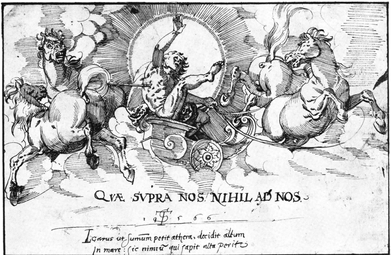
Abb. 7 Tobias Stimmer: Sturz des Phaëthon, 1566. Federzeichnung, 18,0×28,0 cm. Englische Privatsammlung.