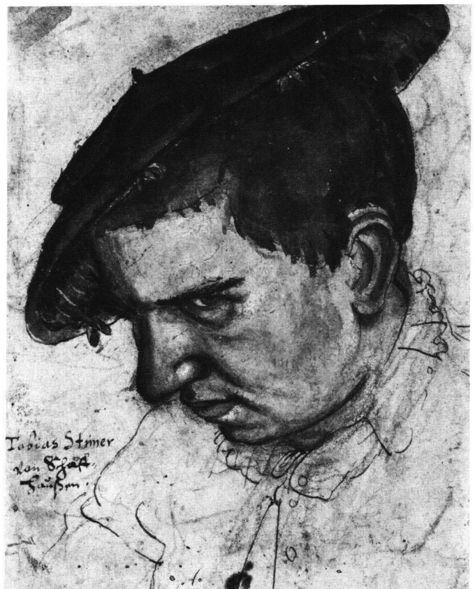
Abb. 12 Tobias Stimmer: Selbstbildnis, um 1563. Feder aquarelliert über Kreide, 19,7×15 cm. Donaueschingen, Fürstlich Fürstenbergische Sammlung.

Während Baldungs Holzschnitt auf Anhieb wirkt und schnell «gelesen» werden kann, verlangt Stimmers Zeichnung ein langsames Abtasten der relativ verschränkten Rhythmen, die sich in der dekorativen Fülle gegenseitig nicht nur steigern, sondern auch systematisch bremsen – gewollt offenbar. Solche «gebremste Lesbarkeit» gilt besonders deutlich auch für die Fassadenmalerei Stimmers, gerade wenn man sie mit Holbeins berühmten Gegenständen vergleicht, und ebenso für die Titelholzschnitte. Ja sie gilt sogar für die ausserordentlich rasch und frei gezeichnete, zügig erscheinende Helldunkel-Pinselzeichnung des «Malers mit seiner Muse», deren erst in eingehender Betrachtung sich erschliessende Komplexität uns zweifeln liess, ob sie sich als Plakatmotiv eigne (wir entschieden uns dann doch dazu). Gemessen an barocker Kunst oder nochmals an Urs Graf ist auch dieses Figurenpaar «paralysiert» in einem nur allmählich penetrierbaren Gefüge von Formen und Gegenständen. Die Langsamkeit der Lesung wird belohnt mit der Entdeckung wohlgebaute abstrakter Rhythmen auf der gültig bleibenden Grundlage eines ernsten Realismus.