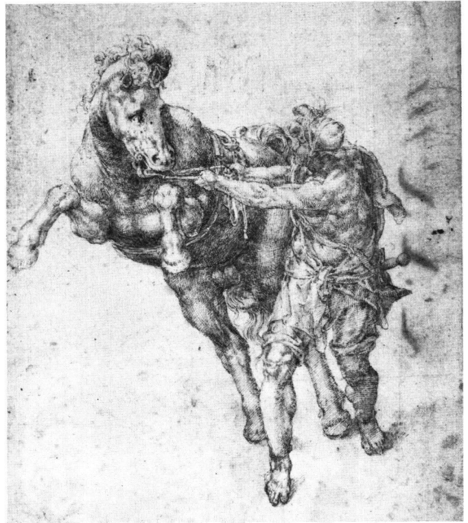
Abb. 6 Lelio Orsi: Mann mit sich aufbäumendem Pferd (in einer «Bekehrung Pauli»), um 1560. Federzeichnung, 22,7×17,7 cm. London, British Museum, Print Room (1946-7-13-38).

Deckenbild im Hirschvogel-Haus in Nürnberg italianisierend ausbildete. 18 Vermutlich stand Pencz unter dem Eindruck der damals neuen Deckenmalereien Giulio Romanos im Palazzo del Tè in Mantua. 19 Stimmer «paralysierte» die gegenständliche Dynamik formal durch Symmetrie, Ausgewogenheit, Fülle und bei aller Bewegung doch durch eine abstrakte Flächenbindung – ähnlich etwa wie auf dem späteren Holzschnitt des himmlisch thronenden Heilands (Nr. 150). Phaëthon stürzt noch nicht, er taumelt, vom Blitz-Pfeil getroffen: Statt eines rasanten Sturzes in der Vertikale (wie ihn Michelangelo vorbildlich für manieristische Künstler gestaltet hat) 20 sehen wir die einsetzende, im horizontalen Bild symmetrisch gegebene Desintegration. Die beiden Pferde auf der linken Seite, die sich von dem nach rechts fahrenden Gespann losgemacht haben, stabilisieren die Komposition. Das Zentralmotiv, die bedeutungsvolle Sonnenlichtscheibe, dominiert; sie fixiert das Bild im ganzen und im einzelnen – bis zu dem an den höchsten Punkt hochgehobenen Arm Phaëthons, der nicht wild fuchelt, sondern in letzter Balanceakt unfreiwillig exakt sich der göttlichen Macht der Sonne «einordnet». Die unter dem Bild (oder vielmehr im Bild) stehende Sentenz ( Was über uns ist, geht uns nichts an ) und