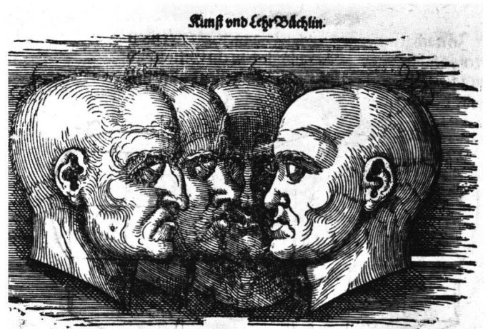
Abb. 9 Hans Sebald Beham: Vier in einem Quadratnetz konstruierte Männerköpfe. Holzschnitt aus dem «Kunst vnd Lehrbüchlein» (zuerst Frankfurt 1546, hier nach der Ausgabe von 1605 im Basler Kupferstichkabinett), 13,8×8,6 cm.

kopf am linken Blatrand oder beim selben Pferd die kurzen Kreuzlagen am Bauch und an der Hinterbacke rechts, wo übrigens die zuerst angelegte Schraffur (zwischen dem Schweif und den hinteren Beinen) bezeichnenderweise in zwei Gruppen zerlegt wurde, so dass der Zug der Linien geknickt ist – «mit vielen gleichwertigen kleinen Einheiten», wie MAX J. FRIEDLÄNDER von den prinzipiell ähnlichen Holzschnitten der deutschen Spätrenaissance schrieb. 23 Die Vergleichsmöglichkeit mit Lindtmayers Pferdeholzchnitten von 1588 sei hier nur gerade erwähnt. 24