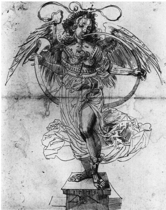
Abb. 11 Daniel Lindtmayer: Fama, 1579. Federzeichnung, 37,8×27,5 cm. Zürich, Graphische Sammlung des Kunstauses.