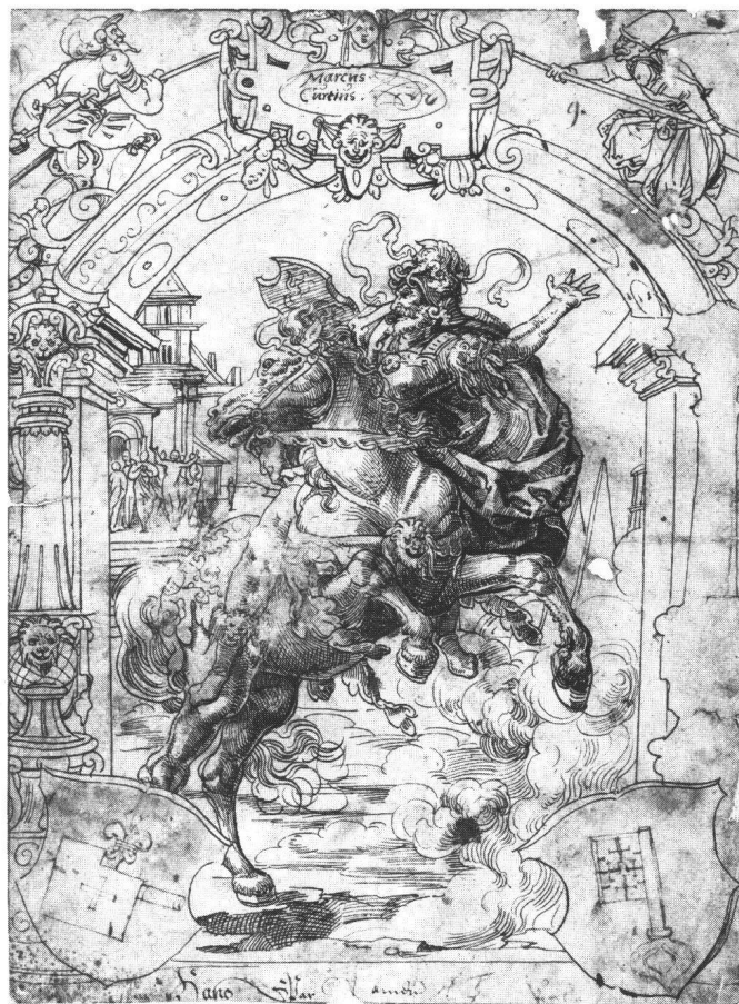
Abb. 5 Tobias Stimmer: Opfertod des Marcus Curtius, Scheibenriss, um 1561/62. Federzeichnung, 29,1×21,5 cm. Zürich, Graphik-Sammlung der ETH, Depositem der Eidgenössischen Gottfried Keller-Stiftung (1906.23:18).

ohnehin gebrochenen Bewegung durch das Netz der Schraffuren und durch den architektonischen Rahmen versteht sich bei der Zeichnung Stimmers gerade als das Eigentliche und Konsequente dieser Formulierung, mithin in einem positiven Sinne. Das sich aufbäumende Pferd und der gestikulierende, heroische Reiter agieren (WALTER FRIEDLAENDER sagte dies von den Propheten und Sibyllen Michelangelos an der sixtinischen Decke) in einem «grausam verengten, fast negierten Raum», was indirekt «auf eine Befreiung erst in einem transzendenten und göttlichen Raum» hinweisen wolle – oder, für Stimmers Marcus Curtius-Zeichnung gesagt: was hinweist auf eine zeichenhafte Überhöhung im moralischen Raum der Aufopferung dieses Vaterlandshelden, wie ihn ein bürgerliches Publikum unter dem kleinen Triumphtor des Scheibenrahmens festhalten und mit den eigenen Wappen dekorieren wollte. 16 Bedeutung und Dekor spannen die kühne Aktion des Römers in ein «paralysierendes» Gefüge ein.