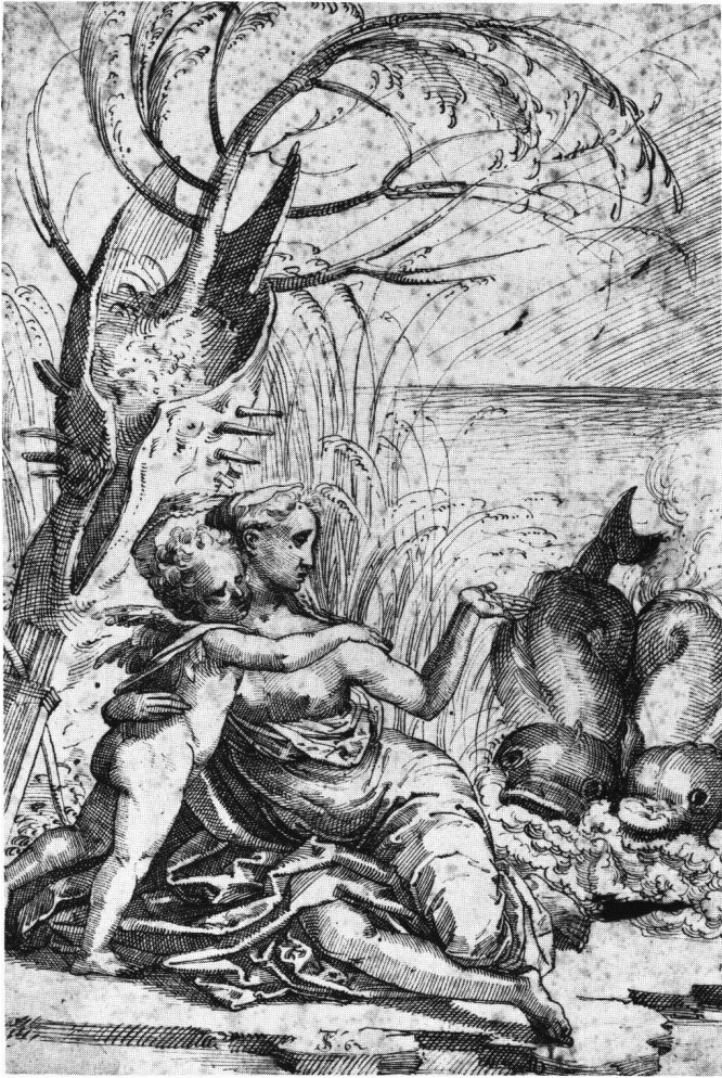
Abb. 2 Tobias Stimmer: Venus und Amor am Ufer des Meeres und einem Delphinpaar, 1562. Federzeichnung, 31,4×21,2 cm. Budapest, Kunstmuseum (1917–209).