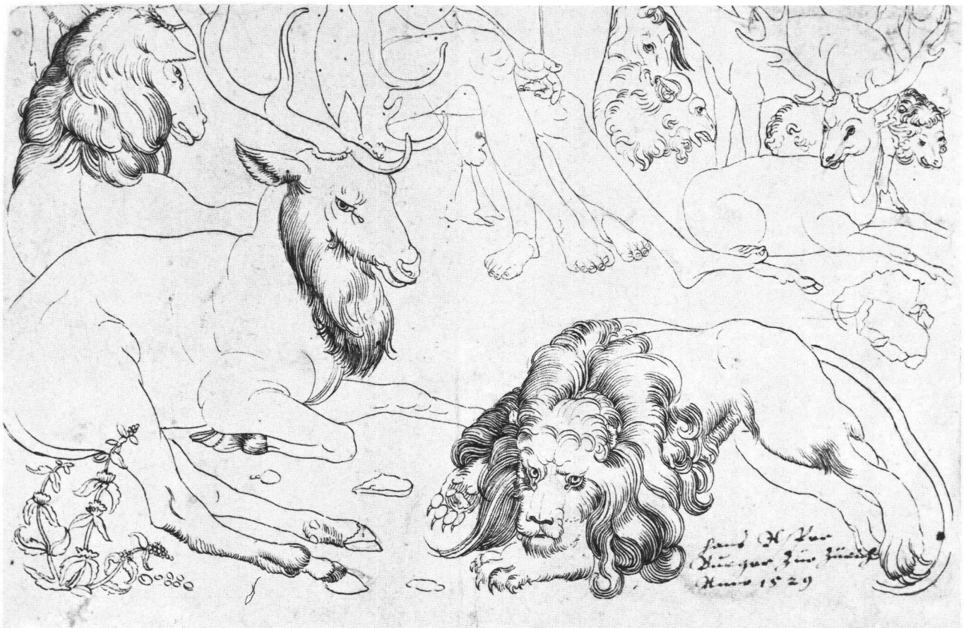
Abb. 1 Der Sündenfall (untere Hälfte), 1529. Von Hans Asper nach Lukas Cranach d.Ä. Weimar, Staatliche Kunstsammlungen.

einer Klärung verhelfen. Eine Asper-Zuschreibung der Leningrader Ermitage 2 dürfte sich auf einen jüngeren Angehörigen der Künstlerfamilie beziehen, wahrscheinlich den in Konstanz tätigen Hans Kaspar Asper. Gegen unseren Künstler spricht hier allein schon die Verwendung von farbigem (nicht grundiertem!) Tonpapier, das nördlich der Alpen erst später in Gebrauch kommt. Die Ursache für die Seltenheit von Zeichnungen des Zürcher Künstlers liegt zunächst wohl darin begründet, dass er – im Gegensatz zu den meisten seiner Schweizer Malerkollegen – seine Blätter nur in Ausnahmefällen signiert zu haben scheint. Möglicherweise kam der Zeichnung in seinem Werk auch ursprünglich keine grössere Bedeutung zu, etwa als selbständigem Verkaufs- oder Sammlerobjekt («Künstlerzeichnung»). Auch erweckt es den Anschein, dass Asper keine Scheibenrisse, wohl aber Visierungen zu Holzschnitt-Illustrationen und -Veduten gefertigt hatte. Er scheint sich überwie-