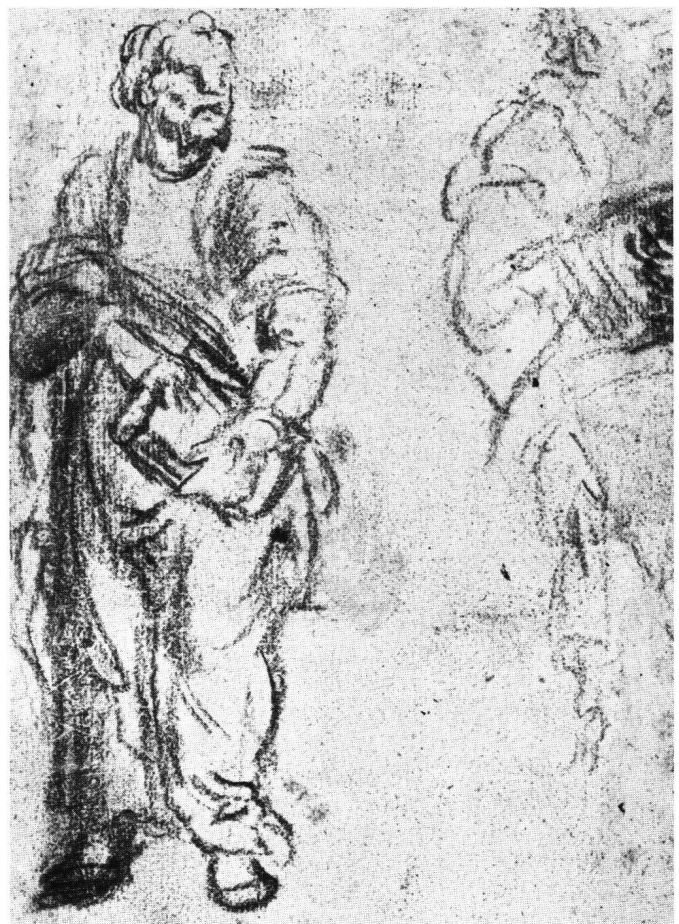
Abb. 4 Studien zu einer Apostelfigur, (Rückseite). Hans Asper (?). Nürnberg, Germanisches Nationalmuseum.

Die Rückseite enthält zwei flüchtig hingeworfene Figurenskizzen in schwarzer Kreide: etwas derbe, aber grosszügig kompakte Entwurfsvarianten zu einer stämmig unteretzten Männergestalt mit Buch – Apostelfiguren vermutlich. Deutlicher erkennbar ist nur die vollständig vorhandene linke Figur. Sie steht mit angedeutetem Kontrapost leicht nach links gewendet. Der fast kubisch gebildete Kopf mit stumpfer breiter Nase und kurzem Backenbart ist nach rechts gedreht, von woher auch das Licht einfällt. Die vage angedeuteten grossen Hände halten das Buch, wobei die prätentiose Geste der Rechten im auffallenden Gegensatz zur vierschrotigen