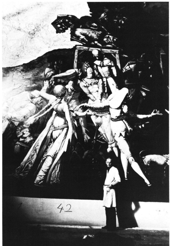
Abb. 2 Panoramabild in Bad Frankenhausen. Der Maler Werner Tübke vor einem Wandbildfragment.

1983 begann ich allein mit der Malerei, die Mitarbeiter waren weiterhin in der Werkstatt mit Übungsarbeiten beschäftigt. Allein deshalb, weil ich erst einmal etwa 150 m 2 als Beispiel und Massstab zeigen musste, also wie die Malerei strukturiert ist, welche Werkzeuge, Bindemittel, Spannung zwischen Lasuren und sehr pastoser Stofflichkeit usw. – Die Malerei vollzieht sich in Tagwerken. Eine zu bewältigende Fläche bekommt eine dunkle Imprimitur, farbig bereits differenziert, z.T. komplementär unterlegt, in die erst ins Dunkle, dann ins Helle gearbeitet wird mit möglichen grossen Bürsten bis 4 Zoll. Das Ergebnis sieht aus wie eine Schichtenmale-