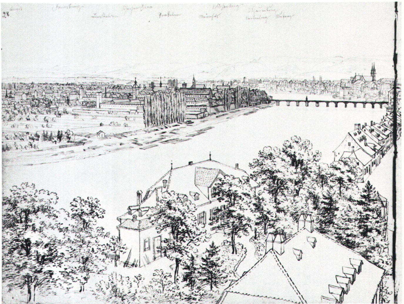
Abb. 3 Anton Winterlin: Blick vom St. Johannsturm (rheinaufwärts gegen Mittlere Brücke und Jurakette). Feder und Bleistift, aquarelliert. Auf dem Nebenblatt des Skizzenbuches wird der Rundblick fortgesetzt entsprechend Abb. 4.