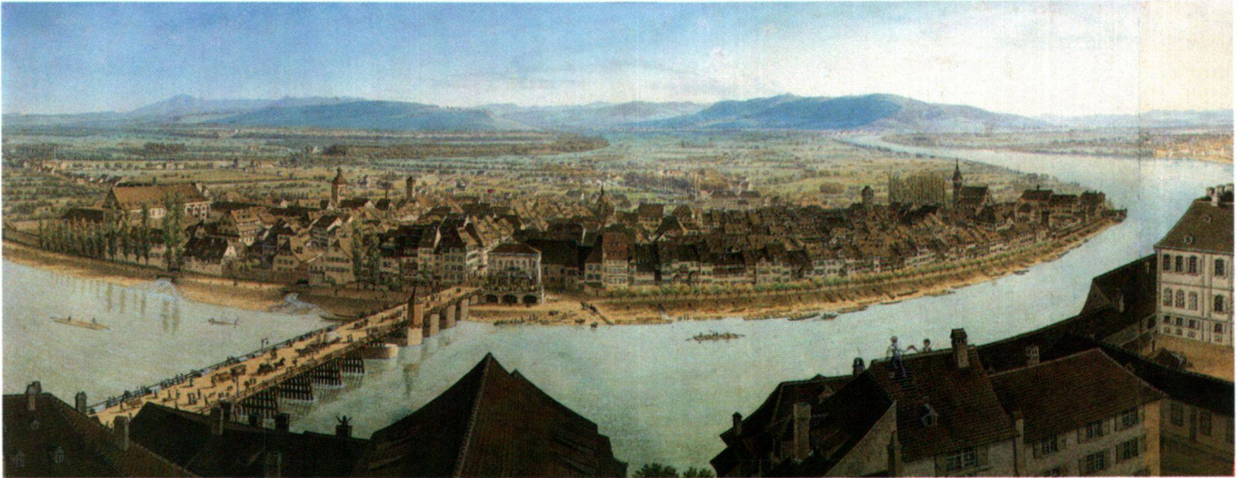
Abb. 1 Anton Winterlin: Panorama vom Turm der Martinskirche (Ausschnitt: Blick auf Mittlere Brücke und Kleinbasel). Federzeichnung, aquarelliert.