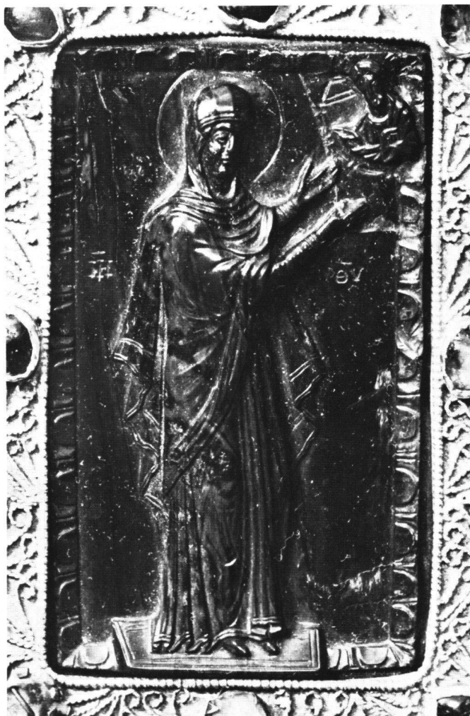
Abb. 1 «Chymeute». Gemme aus rot-grünem Jaspis, Höhe 6,8, Breite 4,1 cm (soweit in der Fassung sichtbar). Abegg-Stiftung, Riggisberg.

Vom Kreuz auf der Rückseite der Kamee wird später die Rede sein. Die Rückseitenverzierung vieler byzantinischer