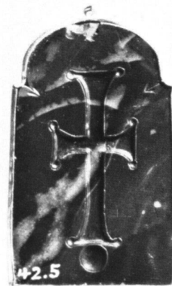
Abb. 11 «Hagiosoritissa», Rückseitenkreuz. Walters Art Gallery, Baltimore (vgl. Abb. 2).

Mit dieser letzten Gruppe sind einige Gemmen verbunden, die uns wieder zurückführen zu den drei Marienkameen in Riggisberg, Baltimore und London. Die Vorder-