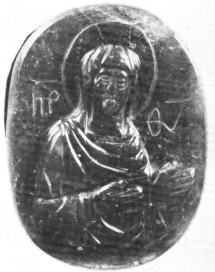
Abb. 7 «Hagiosoritissa». Halbfigur, «greenish quartz», Höhe 3,1 cm. Dumbarton Oaks Collection, Washington DC.