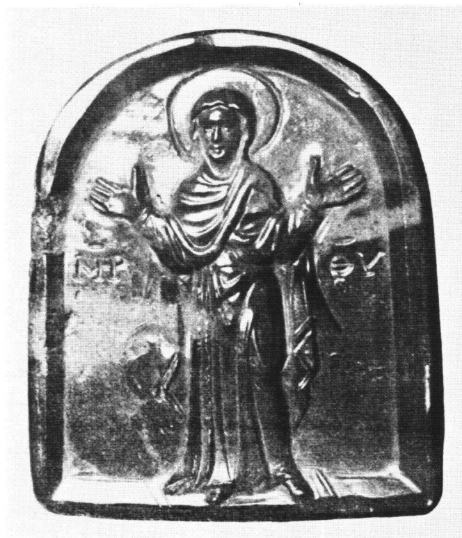
Abb. 4 «Blacherniotissa». Jaspis, Höhe 4,5 cm. Ermitage, Leningrad.

Die frühesten Steine stehen in eher lockerem Zusammenhang um eine Christuskamee im Victoria and Albert Museum in London 19 und ein Gemmenpaar mit der Blachernenmaria (Abb. 4) und einem Christus Pantokrator in Leningrad. 20 Die drei Jaspisgemmen haben Grösse, Arkadenform und Vertiefung in einen Rahmen gemeinsam. Alle drei zeigen Ganzfiguren, die – entsprechend den drei Marienkameen – die Höhe des Bildfeldes gänzlich ausfüllen, ja teilweise auf den Rahmen übergreifen. Die Gestalten, stark erhaben modelliert, sind gekennzeichnet durch ihre