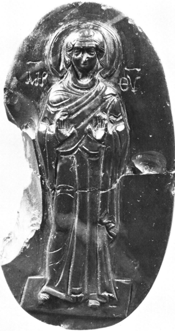
Abb. 5 «Blacherniotissa». Jaspis, Höhe 6,1 cm. Dumbarton Oaks Collection, Washington DC.

etwa auf dem Siegel von Erzbischof Ignatius (847–877) 24 , zeigen die füllige, kalottenartige Haargestaltung und Mariensiegel 25 , z.B. der Patriarchen Stephan (886–893) und Photius (858–867), die einheitlich frühe Haube der Theotokos (mit enganliegendem, von der breiten, flachen Bedekung der Stirn geradlinig zum schmalen Hals hinuntergeführten Tuch).