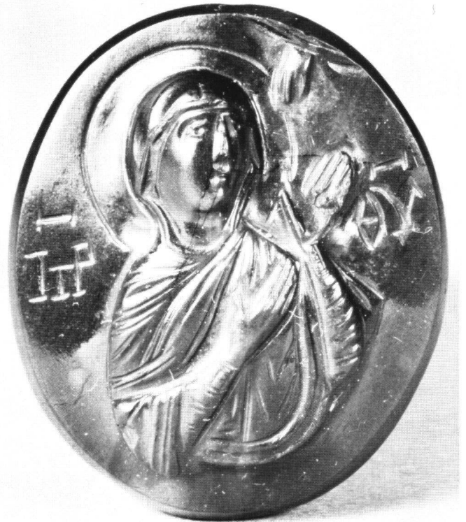
Abb. 6 «Chymeute». Halbfigur, Jaspis, Höhe 3,5 cm. Dumbarton Oaks Collection, Washington DC.

Eine dritte Gruppe zeichnet sich besonders durch ihre stilistische Geschlossenheit aus. Ikonografisch ist sie vielfältig: ein ganzfiguriger Christus Pantokrator in Moskau, vier Büsten desselben Typs in Philadelphia, Paris, Rom und London, ein Brustbild Johannes des Täufers in Wien, eine Kreuzigung mit Maria und Johannes in London, eine ganzfigurige Blachernenmaria in Dumbarton Oaks (Abb. 5) und ein Hl. Nikolaus ehemals in Lyon. 26 Allein die Pantokratorkamee im Kreml ist noch arkadenförmig, alle anderen