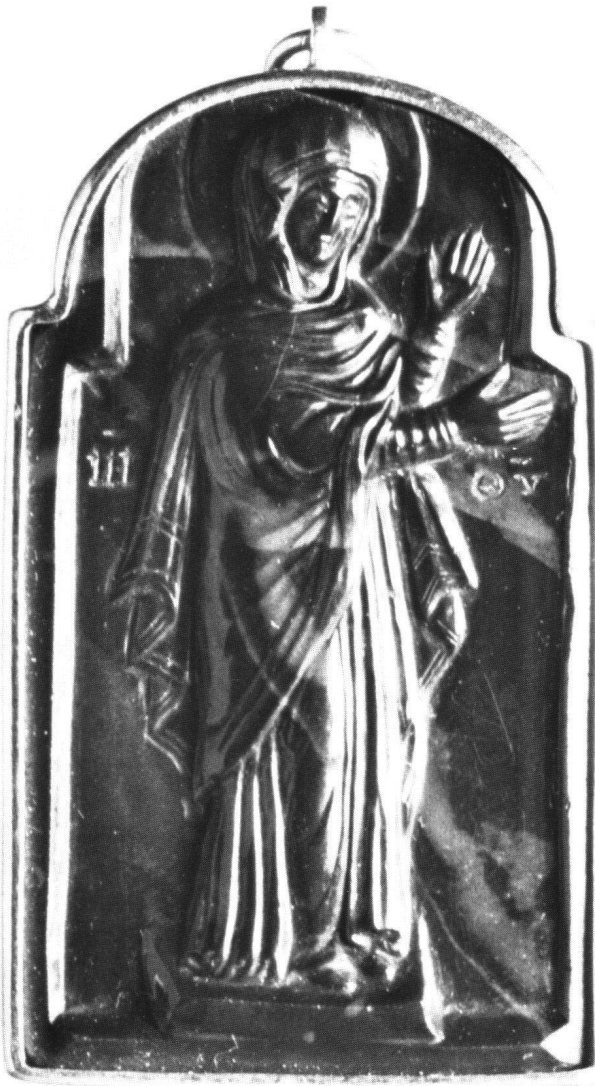
Abb. 2 «Hagiosoritissa». Jaspis, Höhe 3,5 cm. Walters Art Gallery, Baltimore.