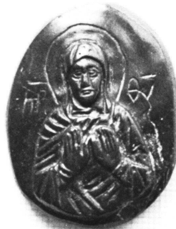
Abb. 8 «Blacherniotissa». Jaspis, Höhe 4,0 cm. Kloster Chilandari, Athos.

letzte Viertel des 10. und den Beginn des 11. Jahrhunderts. 29