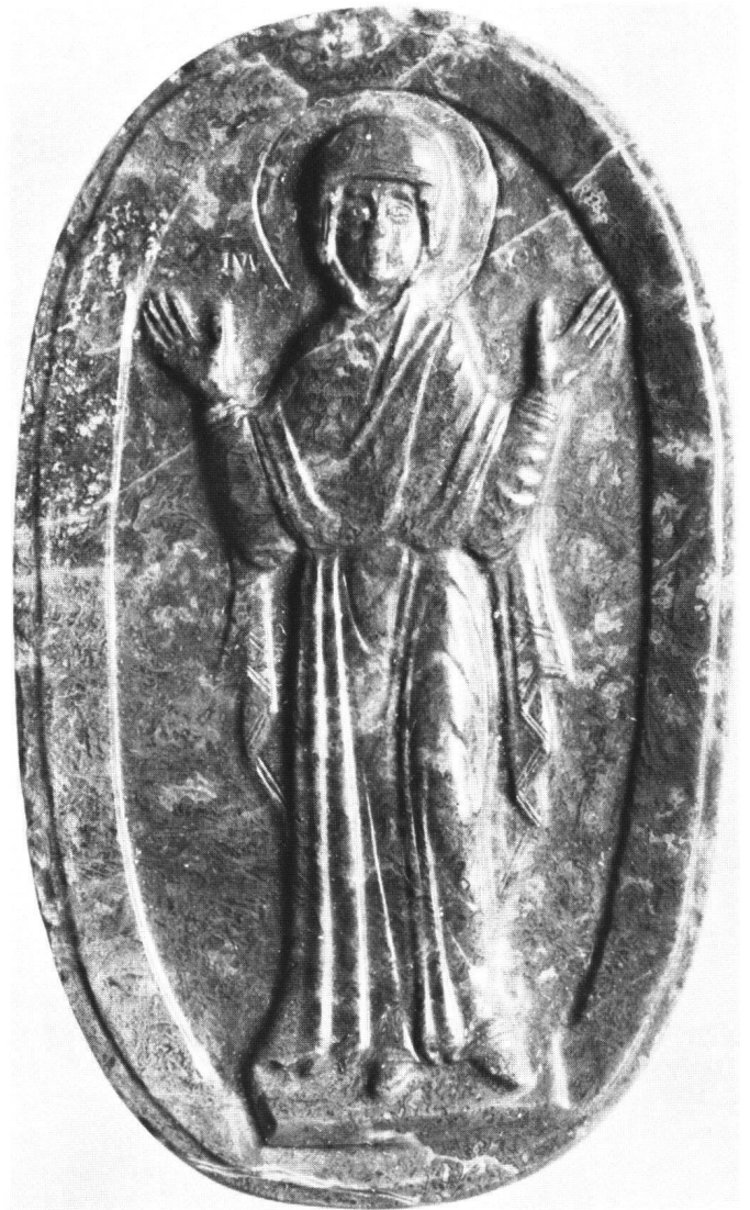
Abb. 3 «Blacherniotissa». Jaspis, Höhe 6,3 cm. British Museum, London.

müsste man sich eher nach der auf derselben Tafel im Sinaikloster wiedergegebenen «Chymeute» richten, die Gesicht und Hände zu dem im Himmelssegment erscheinenden Christus erhebt, im Gegensatz zu der sich mit gesenktem Haupt und Armen ihrem Gegenüber zuwendenden «Hagiosoritissa», die ursprünglich wohl aus einem Deesisbild stammt. Darstellungen der «Chymeute» sind selten, sie zeichnen sich in der Malerei häufig durch den deutlicher nach oben gewendeten Blick aus als auf Gemmen, wo – aus Platzgründen – Christus oder seine Hand kaum über Augenhöhe der Maria erscheinen. 4 Nur auf einer einzigen Kamee ist Christus auch wirklich dargestellt: auf der Jaspis-«Chymeute» in der Abegg-Stiftung! Drei weitere byzantinische Gemmen zeigen die segnende Hand: eine «Plasma»-Kamee in Wien 5 , ein Jaspis in Dumbarton Oaks 6 (Abb. 6) und eine verlorene, heute durch eine Kopie ersetzte Gemme an einem Astkreuz in Cividale 7 . Eine Theotokos