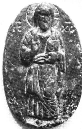
Abb. 9 Christus Pantokrator. Jaspis, Höhe 4,5 cm. Kloster Chilandari, Athos.

schmalen, aber grossen Mariengesichter voller, und es zeigen sich in Details wie der Haubengestaltung Analogien zur Kamee Nikephoros III. Wie bei der «Chymeute» in Dumbarton Oaks (Abb. 6) äussert sich die Verselbständigung der Faltenführung oft im Zusammenfliessen der Falten des Metaphorion vor der Brust zu einem den unteren Medaillonrand begleitenden Bogen. 34 Unter Manuel II. (1143–1180) wird das Brustbild des Christus Pantokrator, bisher stets Leitmotiv aller Münzserien, abgelöst durch das Bild des jugendlich bartlosen Christus-Emmanuel. Mit dieser Änderung im Münzprogramm hängt möglicherweise eine entsprechende Darstellung auf einer Kamee in Florenz zusammen. Die Stiltendenz dieser Gruppe lässt sich bis ins 12. Jahrhundert verfolgen. 35