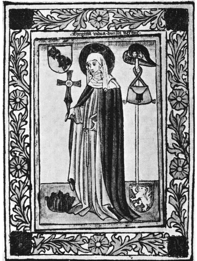
Abb. 10 «Byrgitta vidua...». Kolorierter Einblattholzchnitt, 20,9×15,7 cm. Deutschland, Oberrhein oder Augsburg, kurz nach 1450. – Paris, Louvre, Cabinet des estampes, Edmond de Rothschild (Inv.No. 26 Rés.). (Schreiber 1287).

Ein dreiteiliger, grosser, kolorierter Holzschnitt (Abb. 8, Schreiber Nr. 1283) schildert die «Sancta Birgita witi» als Äbtissin, wie sie von ihrer Sitzbank neben dem Schrägpult ihre Ordensregel zu sieben Nonnen und sieben Mönchen hinreicht. Unter dem Heiligen Geist, zwischen Gnadenstuhl und Gottesmutter mit Kind steht das Monogramm Jesu über ihrem Haupt. Im Spruchband über den knienden Nonnen wird sie als «sponsa Jesu» betitelt. Die Mönche des Doppelklosters, mit dem Zeichen des Jerusalemkreuzes an der Kutte, beten: «o pater de celis miserere nostri». Auch hier fehlt der Stab mit Tasche und Hut nicht. Das Löwenwappen und das SPQR-Schild flankieren links die Schwedenkrone, rechts die Wappen Wittelsbach und Oettingen. Engelberg Baumeister vermutet als Entstehungsort Augsburg und glaubt, dass dieser Holzschnitt vielleicht zur Einweihung des unter dem Schutze des Hauses Oettingen stehenden Birgittenklosters Maihingen im Jahre 1481 angefertigt worden sei (Heitz 40, 1913, p. 14). Mehrere Exemplare dieses Holzschnitttriptychons blieben erhalten, das vorliegende ebenfalls in Maihingen, einem Zentrum der Birgittenverehrung.