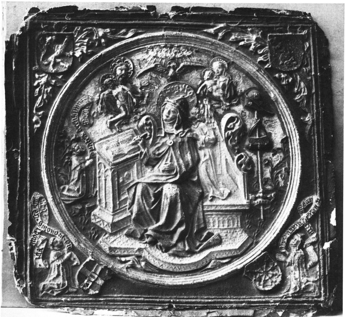
Abb. 2 «Sta. Brigitta» von Schweden schreibt auf Diktat eines Engels. Relief aus Papiermasse, koloriert; von einem Kästchen. Deutschland, Mittelrhein, 1. Hälfte 15. Jh. – Ehemals Wien, Sammlung Dr. Albert Figdor. (Ein zweiter Papierausguss in Köln, Kunstgewerbemuseum; ein entsprechender Tonmodel, Durchmesser 11,2 cm, in Trier, Provinzialmuseum G. 338).

Weiss aufhellt und die Schatten mit Russ modelliert, ohne Beobachtung von Reflexen, ausser bei den beiden kleinen Mantelknöpfen.