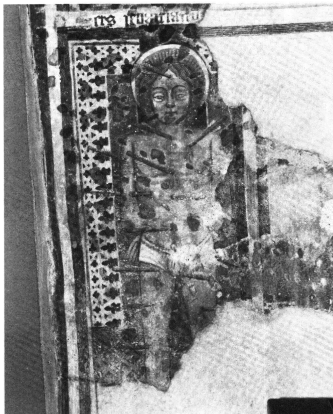
Abb. 5 S. Bernardo in Contra . Hl. Sebastian an der südlichen Schiffswand.