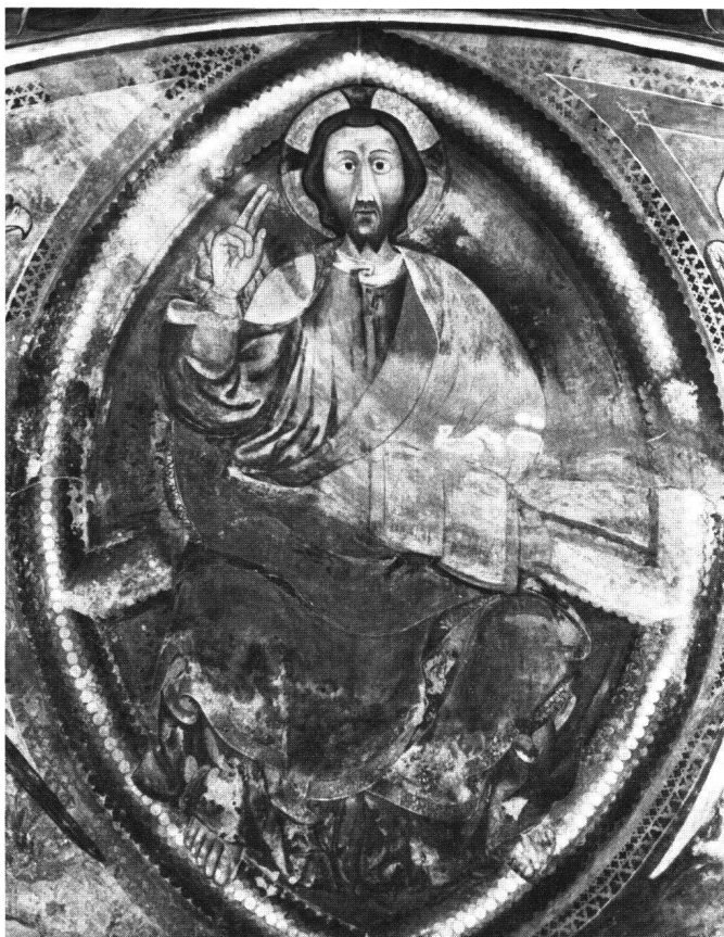
Abb.3 San Nicolao in Giornico , Kalottenscheitel der Apsis. Christus als Weltenrichter in der Mandorla (Maiestas Domini). Die Fresken sind unter dem südlichen Fenster signiert (1478).

das Bild vom heiligen Bernhardin von Pietro di Giovanni (in der Pinakothek von Siena) im Vergleich zu den Darstellungen des heiligen Bernhardin im Tessin erwähnt (vgl. Abb. 2). Von der höfischen Eleganz des sienesischen Stils bleibt allerdings nicht viel übrig. Im Gegenteil, wir haben es hier mit einer urtümlichen, volkstümlichen Kunst zu tun, in der sich das harte Leben in den von Gebirgen umgebenen Tessiner Tälern widerspiegelt. Die Seregnesi bleiben volksnah und steigern mit ihrer Einfachheit und Schlichtheit die Aussagekraft; sie prägen eine eigenständige Volkskunst. Man mag sie als roh, provinziell und rückständig betrachten, aber kaum – wie das HELENE SARTORIUS in ihrer Basler Dissertation von 1955 über «Die mittelalterlichen Chorausmalungen in den Kirchen des Tessins» ausdrückte (S. 56) – als «schwachen Abglanz, der vom Sonnenuntergang der gotischen Malerei in Oberitalien in die letzten Täler seiner Kulturprovinz hinüberscheint».