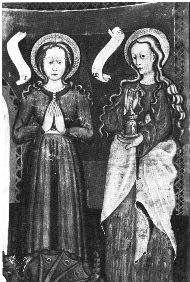
Abb.4 San Nicolao in Giornico , Apsis rechts unten. Die Hl. Margaretha und Magdalena.

In der Kirche Santa Maria del Castello wurde der heilige Bernhardin in traditioneller Weise gemalt. Das Ausmass der