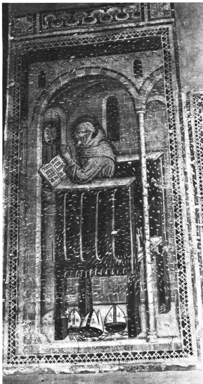
Abb. 2 S. Maria della Misericordia (Collegio Papio) in Ascona, Südwand des Schiffs mit Hl. Bernhardin von Siena, kniend auf der Kanzel ein Gebet verrichtend. Über dem offenen liturgischen Buch mit dem sichtbaren Text «pater manifestavi nomen tuum hominibus» (Joh. 17,6) eine Strahlenscheibe mit Christusmonogramm. Unter der Kanzel drei Mitren als Zeichen der von Bernhardin zurückgewiesenen Bischofswürden von Siena, Ferrara und Urbino.

Weitere Einwirkungen gehen von der sienesischen Malerei (stile gotico internazionale) aus. Als Beispiel sei lediglich