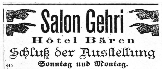
Abb. 8 Inserat im «Tagblatt der Stadt Biel», 7. März 1891.