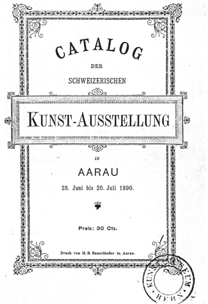
Abb. 2 Katalog der Schweizerischen Kunst-Ausstellung in Aarau, 1890.

1890 hat die Eidgenossenschaft die «Erste Nationale Kunstausstellung der Schweiz» organisiert (Abb. 1), welche sich von den «Schweizerischen Kunstausstellungen» (Abb. 2) einerseits dadurch unterscheiden sollte, dass sie an einem Ort stattfand, also nicht in mehreren Städten im «Turnus» gezeigt wurde, und andererseits – wesentlicher – darin, dass sie ausschliesslich Schweizer Künstlern oder in der Schweiz ansässigen Ausländern offenstand. Bundesrat und Volksvertreter wollten auf Anregung von Frank Buch-