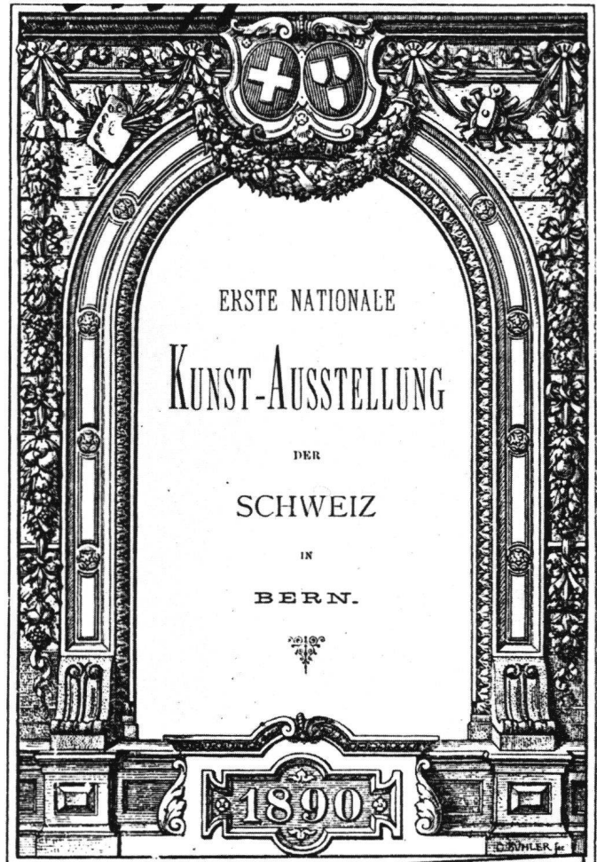
Abb. 1 Katalog der Ersten Nationalen Kunst-Ausstellung der Schweiz in Bern, 1890.

Diese Worte schrieb Marc Debrit am 2. Januar 1891 im «Journal de Genève» in seinem Rückblick auf das soeben beendete Jahr. Gewiss konnte er – um bei der bildenden