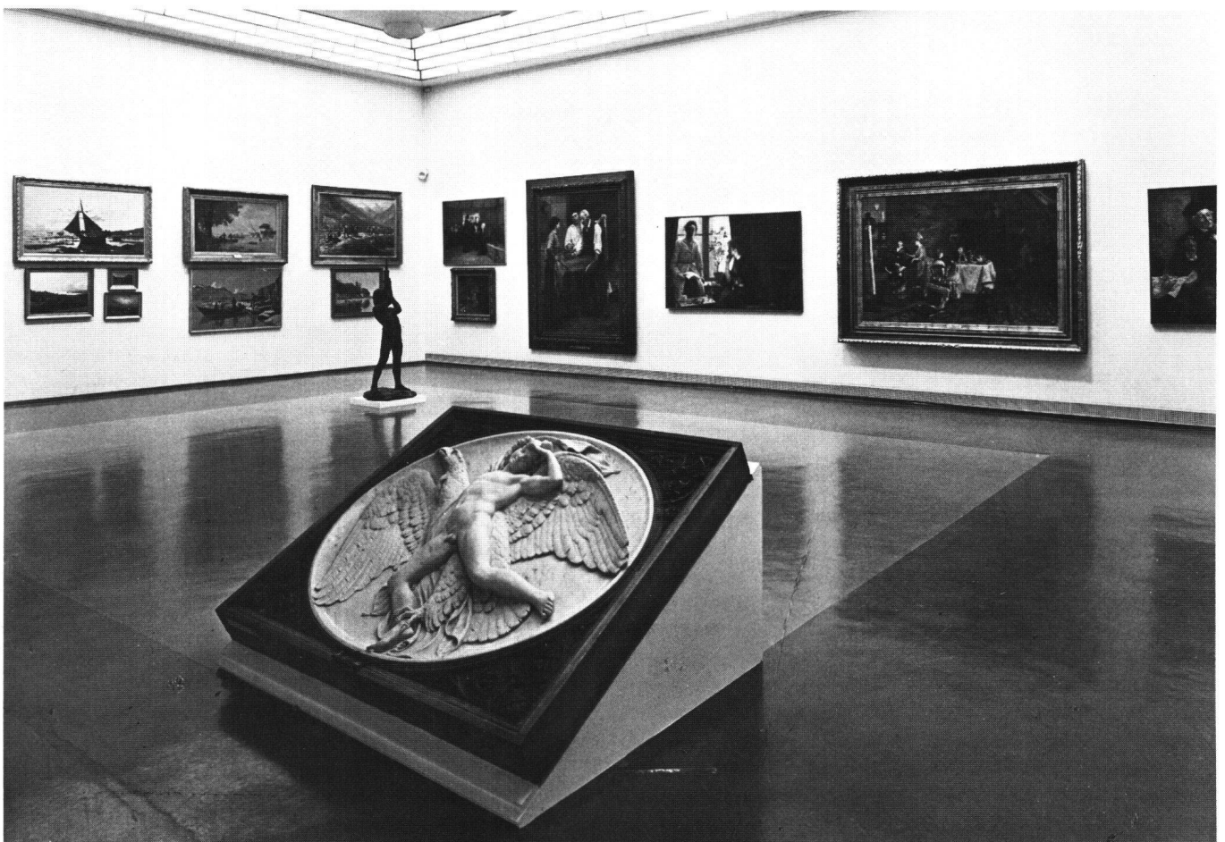
Abb. 5 Saalaufnahme in der Ausstellung «Kunstszene Schweiz 1890», Kunstmuseum Bern 1980.

Dank einem kurzen Pressebericht wissen wir, dass es die Familie des Künstlers war, welche «die gute Idee hatte» 8 , eine Ausstellung von Werken aus Privatbesitz und aus dem Nachlass des Künstlers zu organisieren. In Genf erschien ein gedrucktes Verzeichnis der ausgestellten Werke, das auch den Ort und das Datum der ersten Ausstellung anzeigt. In Bern – dem vermutlich letzten Ausstellungsort – war nur soviel zu erfahren, dass diese im Oktober 1891 im Kunstmuseum stattfand und rund 270 Werke umfasste (ebensoviele also wie die Genfer Ausstellung); die Bernische Kunstgesellschaft hatte aus diesem Anlass Ausgaben von Fr. 348.35 und Einnahmen von Fr. 123.– zu verzeichnen. Über Ort und genaue Daten konnte keines der Museen in den anderen Städten Angaben machen. In Unkenntnis der genauen Ausstellungsdaten hätte es übermässig viel Zeit beansprucht, an allen Orten möglichen Presseberichten nachzugehen.