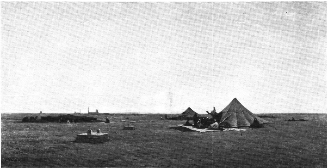
Abb. 6 Auguste Veillon, Kalifengräber in Ägypten; Kunstmuseum Bern.

In Genf fand die Eröffnung am 1. April 1890 statt. Am 14. April erschien eine Beschreibung der Ausstellung im «Journal de Genève», mit W.S. signiert, 120 Zeilen, ungewöhnlich ausführlich, wenn man bedenkt, dass sogar in den grösseren Zeitungen meistens nur eine kurze Mitteilung der lokalen Kunstgesellschaft, eine lapidare Aufreihung der Namen der ausstellenden Künstler oder ein Inserat auf eine Kunstausstellung hinwies – oft überhaupt nichts. Beim Durchblättern von Zeitungsjahrgängen gewinnt man den Eindruck, dass die Zeitungen den Theateraufführungen stets viel mehr Aufmerksamkeit schenken als den Kunstausstellungen.