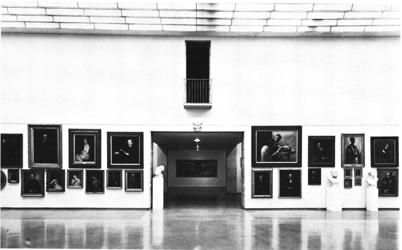
Abb. 4 Saalaufnahme in der Ausstellung «Kunstszene Schweiz 1890», Kunstmuseum Bern 1980.

Es dürfte aufschlussreich sein, einmal Aussagen von Künstlern zu dieser Frage zu sammeln. Als einen kleinen Beitrag dazu zitiere ich eine Briefstelle Ankers, wo er sich zwar nicht zum «Grünen-Heinrich-Zug», aber zur «Ersten Nationalen» äussert: «L'exposition, cette fameuse exposi-