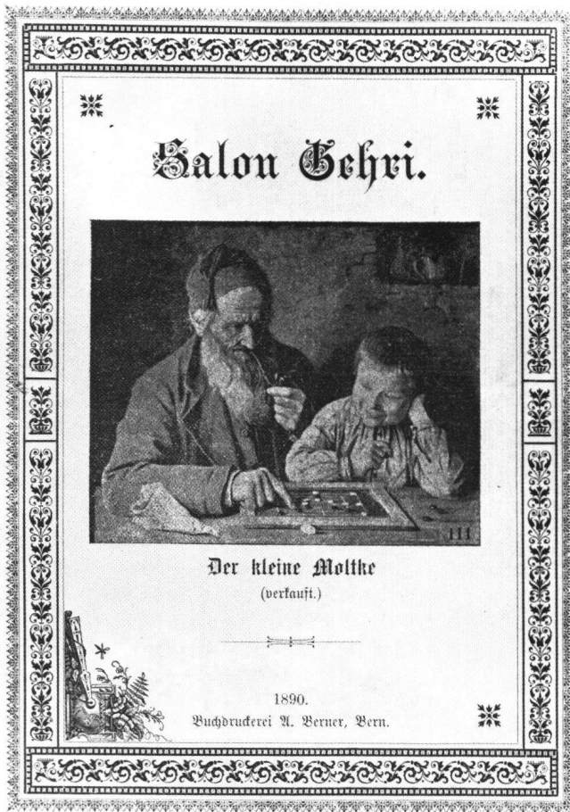
Abb. 7 Katalog des «Salon Gehri», 1890.

anderen als den bereits erwähnten Orten gezeigt wurde, ist gegenwärtig nicht bekannt. Die deutschsprachige Ausgabe des Katalogs erschien «im Dezember» 1890.