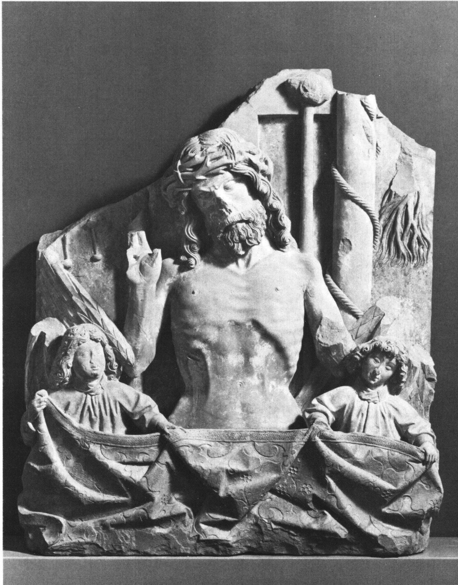
Abb. 1 Schmerzensmann des Erhart Küng aus Thorberg, Sandsteinrelief, um 1460, Bernisches Historisches Museum, Bern.

Das Werk, das hier vorgestellt werden soll, wurde um die Mitte der 60er Jahre bei Bauarbeiten auf dem Areal der Strafanstalt Thorberg gefunden und bald darauf als eine Arbeit des spätmittelalterlichen Bildhauers ERHART KÜNG