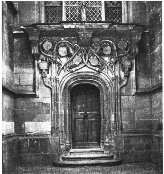
Abb. 5 Schulleissenpforte des Erhart Künig, 1491, Zustand kurz vor der Restaurierung von 1899, Bern, Münster.

Diese Beobachtungen lassen unseres Erachtens sehr gut die Ausgewogenheit der Komposition erkennen, die – trotz der grossen Zerstörung des Objektes – immer noch gut nachvollziehbar ist. Ebenso spürbar bleibt die hohe Qualität des Objektes, das mit zu den künstlerisch hochstehenden