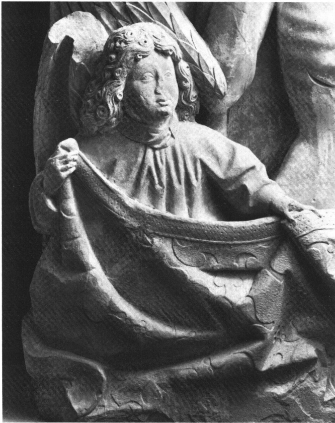
Abb. 4 Thorberg-Relief, linker Engel (Detail aus Abb. 1).

leicht zur rechten Schulter geneigt. Flankiert wird die Halbfigur von zwei einen Damast haltenden Engelsfiguren, die die Darstellung seitlich begrenzen und abschliessen. Im Reliefgrund zeigen sich die «arma Christi», die auf den Leidensweg des Gottessohnes hindeuten.