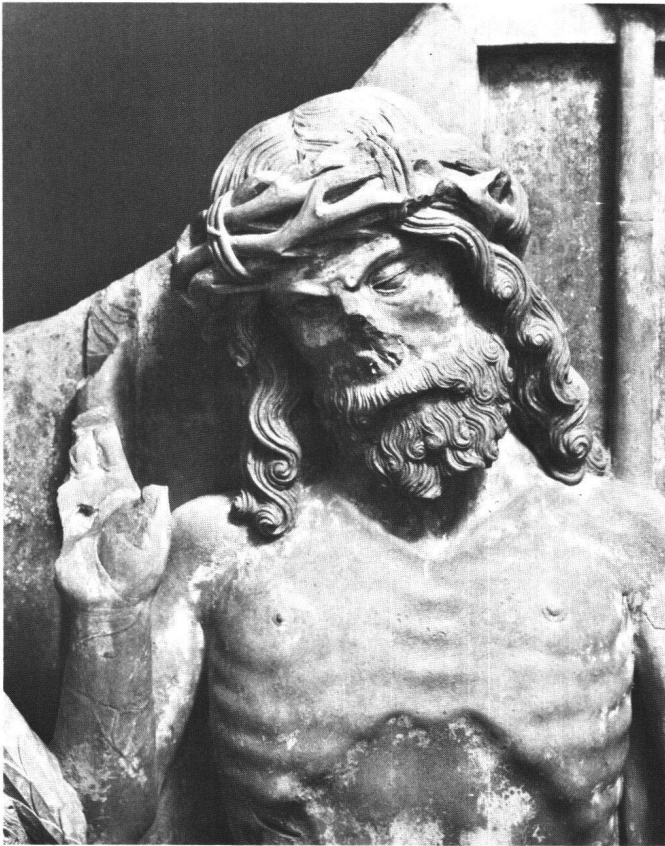
Abb. 2 Thorberg-Relief, Schmerzensmann (Detail aus Abb. 1).