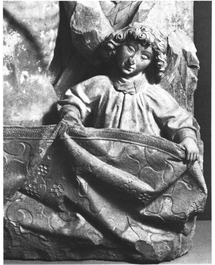
Abb. 3 Thorberg-Relief, rechter Engel (Detail aus Abb. 1).

stammt u.a. das Hauptportal mit der Darstellung des Jüngsten Gerichts. Der Westfale kann als die Bildhauerpersönlichkeit Berns zur Zeit der Spätgotik angesehen werden.