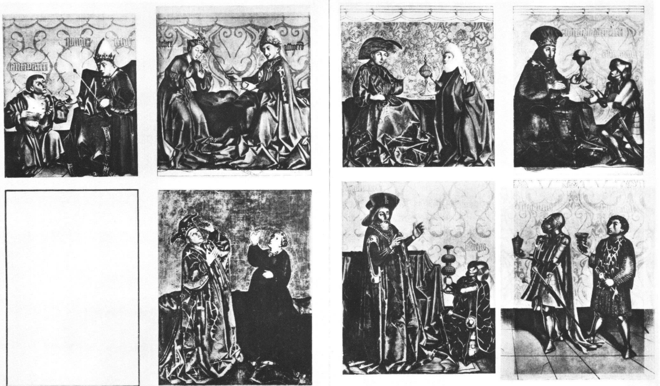
Fig. 4 Faces intérieures des volets du retable du Miroir du Salut. Reconstitution de HANS WENDLAND (1924).