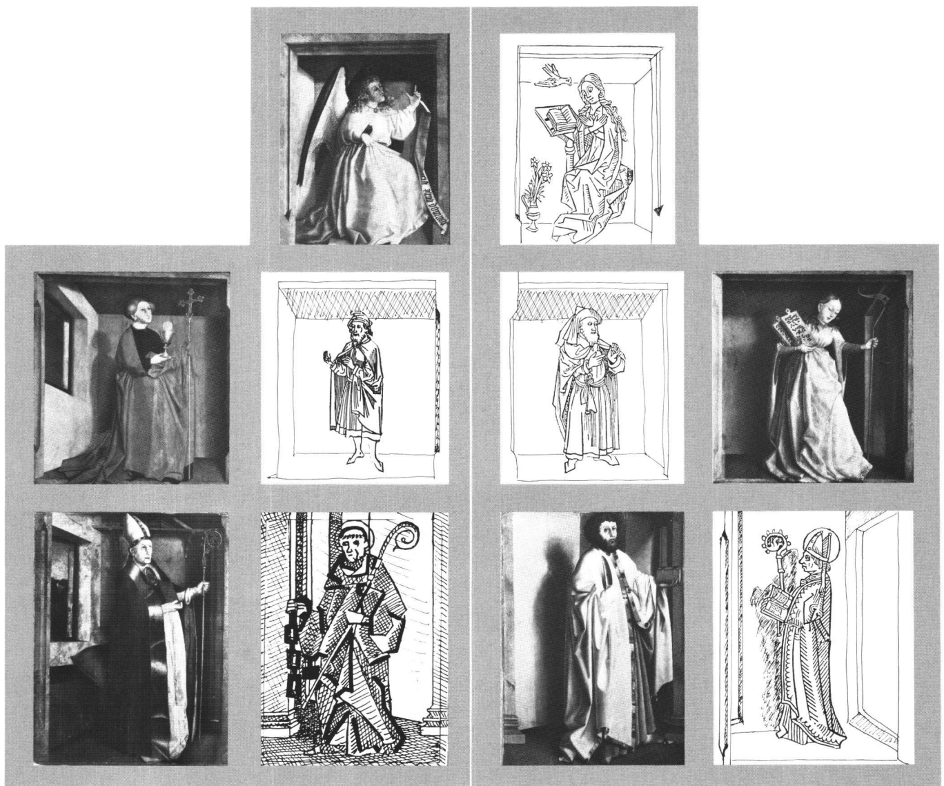
Fig. 5 Face extérieure des volets du retable de Saint-Léonard. Proposition de reconstitution de l'auteur.

de Sabothai - 70 cm, si l'on ne tient pas compte, pour celui-ci, des adjonctions modernes. Mais le panneau supérieur est conservé dans son intégralité, alors que ce n'est pas le cas des deux inférieurs. Le bord gauche du saint Barthélémy est intact et laisse voir des résidus de la barbe de la couche picturale, à droite il est coupé. L'importance du manque est difficile à évaluer. Le revers ne donne guère d'indications, puisque la peinture a été complétée par deux adjonctions à droite et à gauche. A droite, la superposition des radiographies des deux faces montre que la limite de la peinture originale correspond sensiblement au bord primitif. Par contre à gauche, la coupe de la peinture écorne un peu le vase de Sabothai, ce qui paraît peu vraisemblable, malgré le goût de Witz pour les découpes arbitraires: ce vase est, en effet un motif iconographique important. Il est donc logique de supposer un manque de 5 cm au moins - ce qui porterait à 75 cm la largeur de ces panneaux du centre, mais on ne