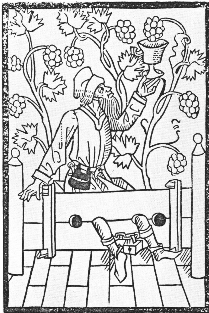
Fig. 8 Le Bouteiller du Pharaon. Illustration du Spiegel menschlicher Behaltnis de Bernhard Richel (Bâle 1476).

Il ne reste, dès lors qu'un second thème qui justifierait une autre représentation, celui de l'intercession du Christ. Or il est essentiellement présent par la scène de César et