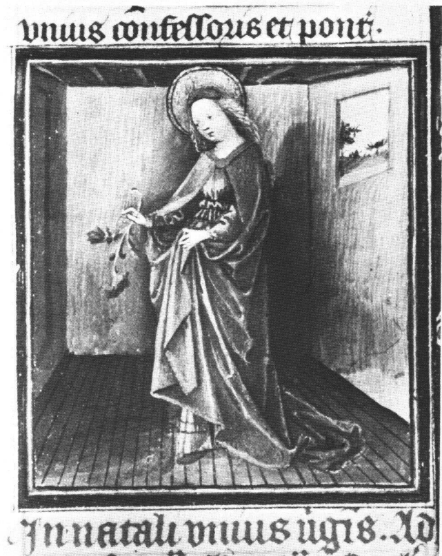
Fig. 6 Sainte Dorothée. Enluminure du Bréviaire de Renaud IV , Pierpont Morgan Library Ms 82, f° 422. (Courtesy of The Pierpont Morgan Library, New York).

La reconstitution de l'extérieur donne, en tout état de cause, des solutions picturales très originales. L'importance des encadrements architecturaux rappelle l'extérieur de l' Agneau Mystique , avec cette volonté sensible à Gand de vouloir associer la représentation au cadre de pierre dans lequel il se trouve. A Bâle, pourtant, la formule est assez différente. D'abord l'espace conserve beaucoup plus le caractère de boîte, au point que CHARLES STERLING a justement été frappé de l'extraordinaire ressemblance des figures féminines dans leur espace avec une enluminure du Bréviaire de Renaud IV de Gueldre de la Pierpont Morgan Library 20 (Fig. 6). Pourtant la comparaison fait bien sentir également la différence de vision des artistes. Pour le Néerlandais, le cadre n'est que secondaire à côté d'une figure encore toute imprégnée des grâces du gothique international. Au contraire, le Bâlois inscrit nettement son personnage dans un espace dont les bords sont nettement structurés. Or ces bords ne sont pas non plus quelconques: ce sont ceux des fenêtres des «hysli» bâloises, avec une cannelure coupant l'arête des pierres. La similitude ne saurait être accidentelle: c'est un choix volontaire du peintre qui cherche à donner un caractère plus familier, plus réaliste