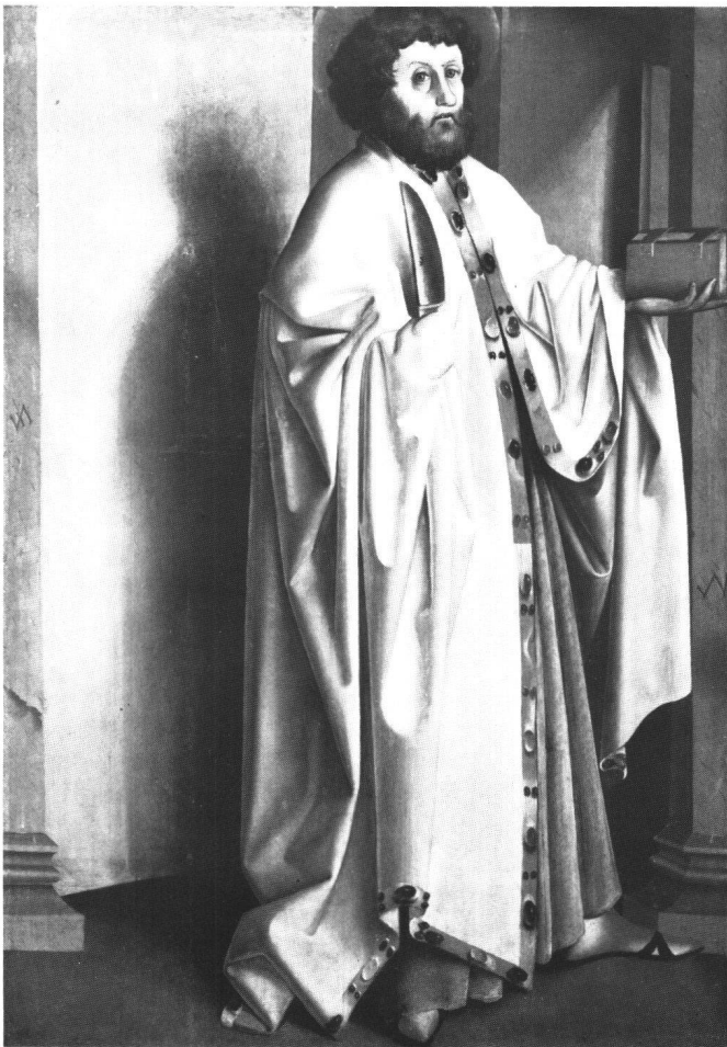
Fig. 1 Saint-Barthélémy. Panneau du «Heilsspiegelaltar» de Konrad Witz (Kunstmuseum Basel).

Dès lors, ceci veut dire que les quatre saints que l'on peut imaginer dans les quatre compartiments inférieurs étaient disposés non symétriquement par rapport à l'axe central, mais en deux couples se faisant face deux à deux et symétriques par rapport à l'axe, comme couples et non comme individus. On peut bien imaginer le saint évêque de gauche – est-ce bien saint Augustin? – associé à saint Léonard et saint Barthélémy à un second évêque, tel saint Théobald – saint Thibaut –, dont l'église Saint-Léonard conservait de précieuses reliques. Toutefois la chapelle Saint-Théobald est