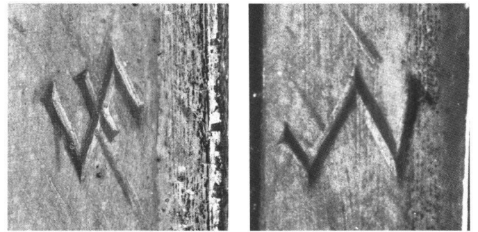
Fig. 1a et b Les deux marques de tâcherons sur le panneau de Saint-Barthélémy.

justement à gauche du chœur: aussi pourrait-on penser que l'évêque conservé à Dijon représente ce saint peu connu dont l'iconographie n'est pas très fixée et que son pendant était le vrai père de l'église. 18