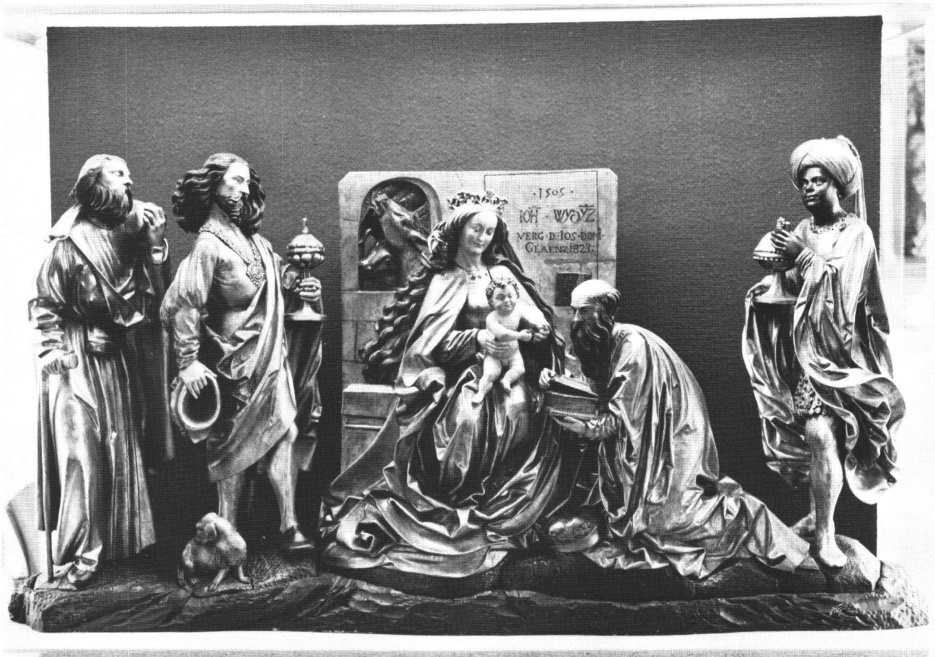
Fig. 10 Hans Wydyz, Adoration des mages. Cathédrale de Fribourg en Brisgau, 1505.

sans doute l'exemple le plus ancien connu jusqu'à maintenant de la nouvelle conception. Il est, sans doute, sensiblement contemporain de celui de Bâle, que Konrad Witz a dû entreprendre, semble-t-il, peu après avoir acquis le droit de bourgeoisie, c'est à dire peu après 1434. Cette contemporanéité est plutôt un indice positif en faveur de l'hypothèse, car il paraîtrait singulier qu'un sculpteur-architecte venu d'Ulm ait pu proposer une solution autre que celle que Multscher développait dans cette ville.