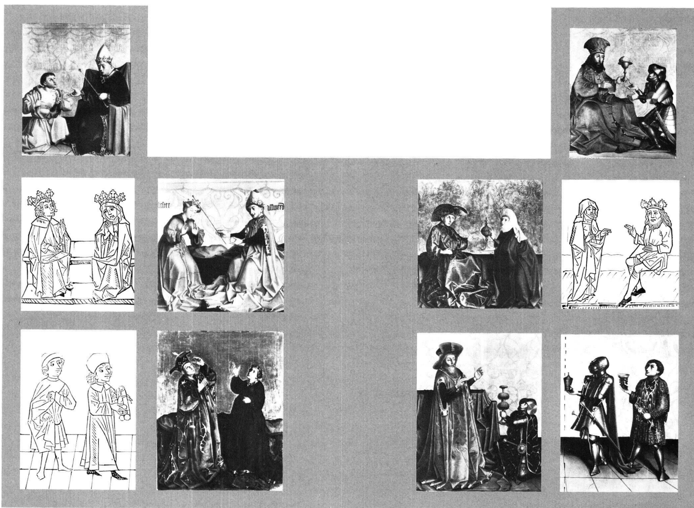
Fig. 7 Face intérieure des volets du retable de Saint-Léonard: proposition de reconstitution de l'auteur.

figurent également dans le traité. Cependant, dans sa dernière étude, DANIEL BURCKHARDT faisait son « mea culpa » et s'excusait d'avoir voulu lier si étroitement l'ensemble au seul Speculum . 22 De fait il n'est pas de typologie que du Miroir du Salut . C'est une notion beaucoup plus répandue et pour n'en citer que d'autres traités aussi connus, il suffit de mentionner la Biblia pauperum et la Concordia caritatis . Bien plus, de nombreux autres textes y ont également recours, telle la Légende dorée et plus généralement de nombreux théologiens. Même si le Miroir du Salut est probablement né non loin de Bâle, il n'est pas nécessaire d'imaginer que le concepteur du programme iconographique ne se soit servi que de lui.