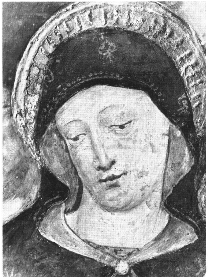
III. 3 Parete divisoria, parte superiore: Fuga in Egitto, dettaglio del volto della Vergine. Stefano Scotto (?), circa 1485.

Le conoscenze sui dipinti della chiesa della Grazie, dunque, si fondano tuttora sull'inquadramento critico del Suida. 18 Egli accomuna gli affreschi incompiuti della cappella di san Bernardino e quelli sull'arco del coro, con lieve