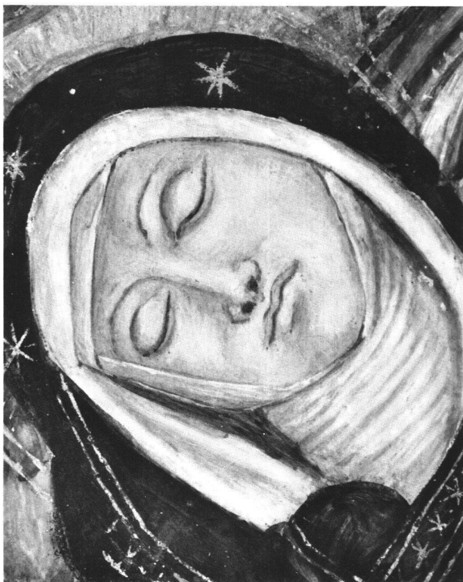
Ill. 4 Parete divisoria, riquadro centrale: crocifissione, dettaglio del volto della Vergine sorretta dalle Pie Donne. Gaudenzio Ferrari, verso il 1495.

Tenendo quindi conto dei possibili tempi di costruzione della chiesa e della determinazione della Committenza, il maestro della Passione ed il suo primo giovane compagno, responsabile della cappella di san Bernardino e della Annunciazione sull'arco del coro, potrebbero in effetti giungere a Bellinzona già attorno al 1485.