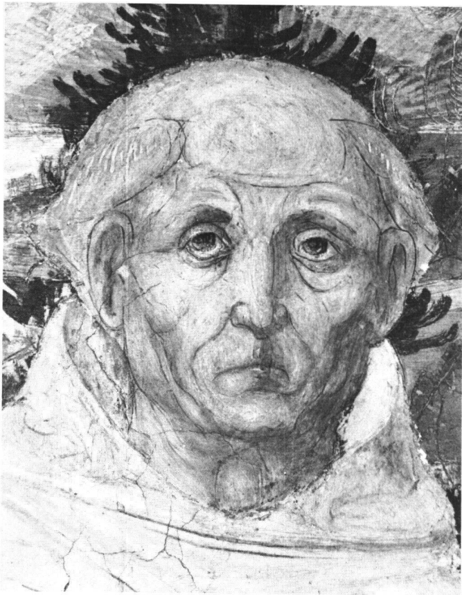
Ill. 5 Capella di san Bernardino: dettaglio, volto di san Bernardino. Ambrogio da Fossano e fratello Bernardino (?), verso il 1485.