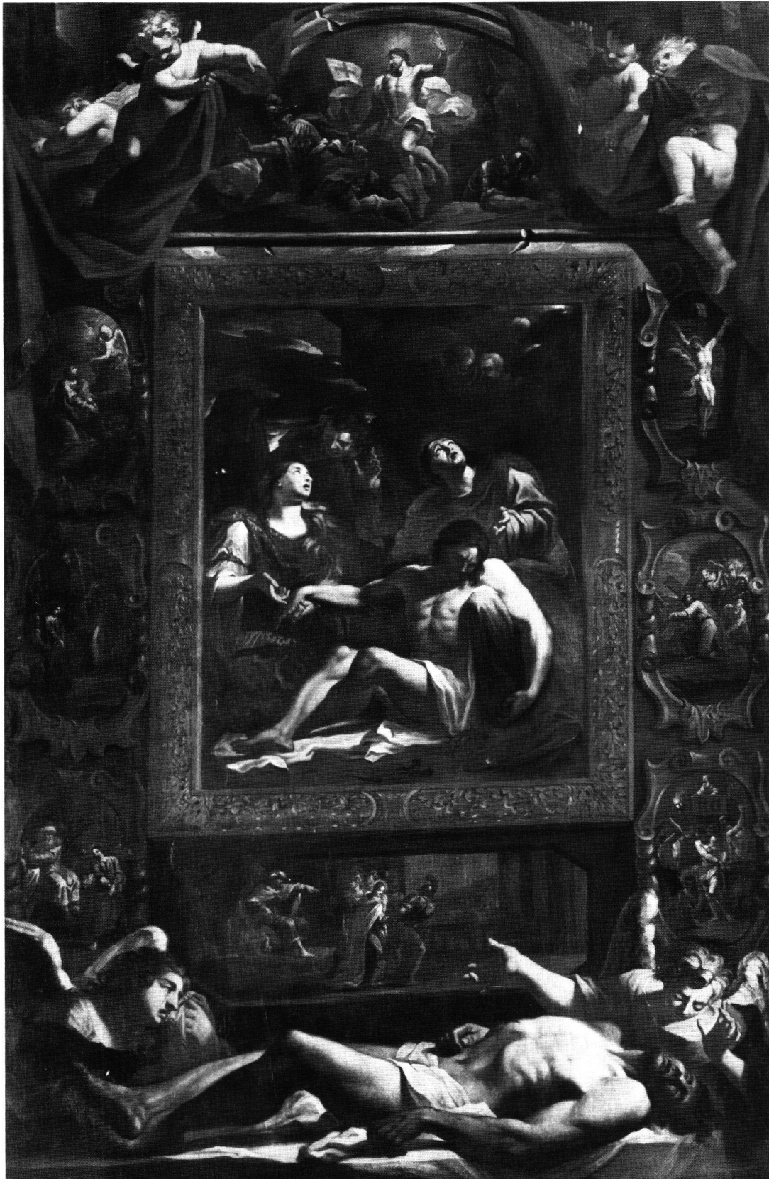
Fig. 2 Pala della Pietà, Pierre Bergaigne. Mosogno-di-Sotto, Oratorio della Beata Vergine Immacolata.