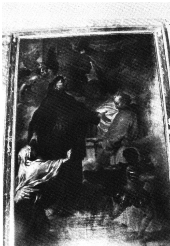
Fig. 8 Miracolo di Sant'Antonio da Padova , Godefridus Maes. Druogno, Chiesa parrocchiale di San Silvestro.

A questo punto possiamo ipotizzare per la pala di Loco, l'intervento dello stesso Maes o di un artista a lui vicino, tanto più che i due quadri oltre ad avere una provenienza comune legata all'emigrazione 23 , giungono entrambe – sebbene in circostanze diverse e purtroppo non del tutto