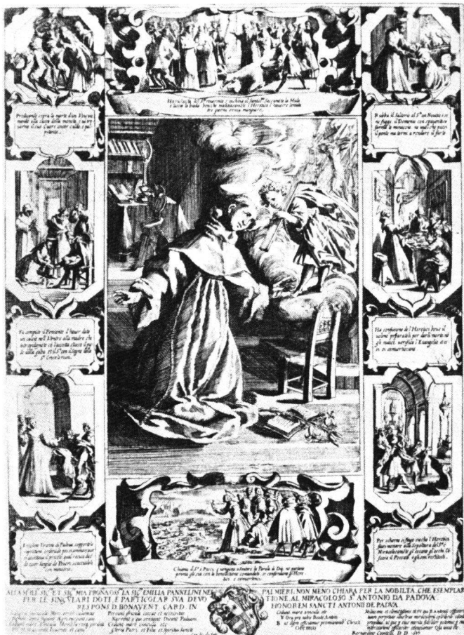
Fig. 3 La devozione di Sant'Antonio da Padova a Gesù Bambino, Bernardino Capitelli, 1694.

messe in risalto da cornici e da motivi decorativi in «trompe-l'œil». Nei tratti generali, l'intera composizione richiama lo schema proprio alla pagina di frontespizio di testi devozionali con diversi piccoli scomparti lungo i lati e una parte centrale più importante (Fig. 3). 8