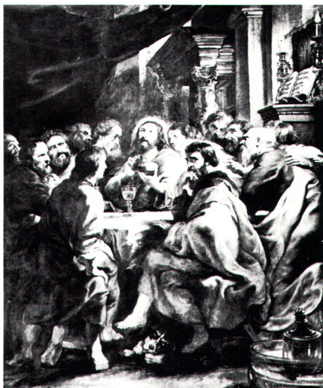
Fig. 7 Ultima Cena, Pieter Paul Rubens. Milano, Brera.

a risolvere il problema: dal 1680 al 1683 i libri dei conti registrano le spese relative al dipinto – i pagamenti, le somme versate dai parrocchiani e le spese per la sua sistemazione in Chiesa. 15