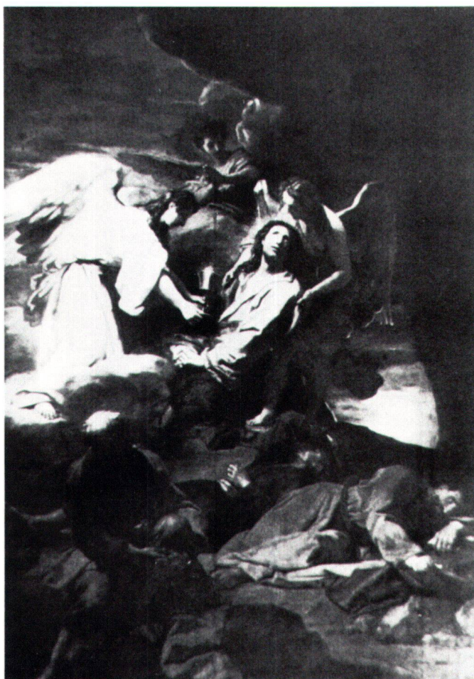
Fig. 6 Cristo nel giardino degli ulivi, Jean Jouvenet. Orléans, Cattedrale.

Il ricorso a quest'iconografia insolita, è da ascrivere senz'altro sia a ragioni legate alla devozione locale – a Loco infatti si trovava fin dall'inizio del Seicento un Oratorio intitolato alla Santissima Trinità 14 – che alla committenza. In proposito, gli archivi parrocchiali di San Remigio ci aiutano