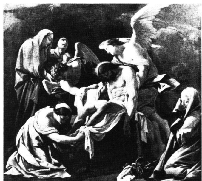
Fig. 4 Deposizione di Cristo, Simon Vouet. Bruxelles, Museo di Belle Arti.

Ma è comunque certo che il Bergaigne, da un punto di vista stilistico si mostra debitore della cultura artistica francese, attingendo infatti dalle opere di Vouet 9 (Fig. 4) e del più tardo Jouvenet 10 (Fig. 6), a lui coevo: in particolare nelle forme dilatate che caratterizzano alcuni personaggi (si noti in particolare la Maddalena), nella loro disposizione nello spazio (la messa in scena) e nell'adozione di un «classicismo epurato» proprio di questi artisti francesi che hanno creato un loro linguaggio a partire da modelli iconografici italiani. Il Bergaigne invece, nel riproporre il repertorio sopra-citato, non ne dimostra un'assimilazione tale da consentirgli l'elaborazione di una pittura più personale e infatti il risultato al quale attende presenta scadimenti,