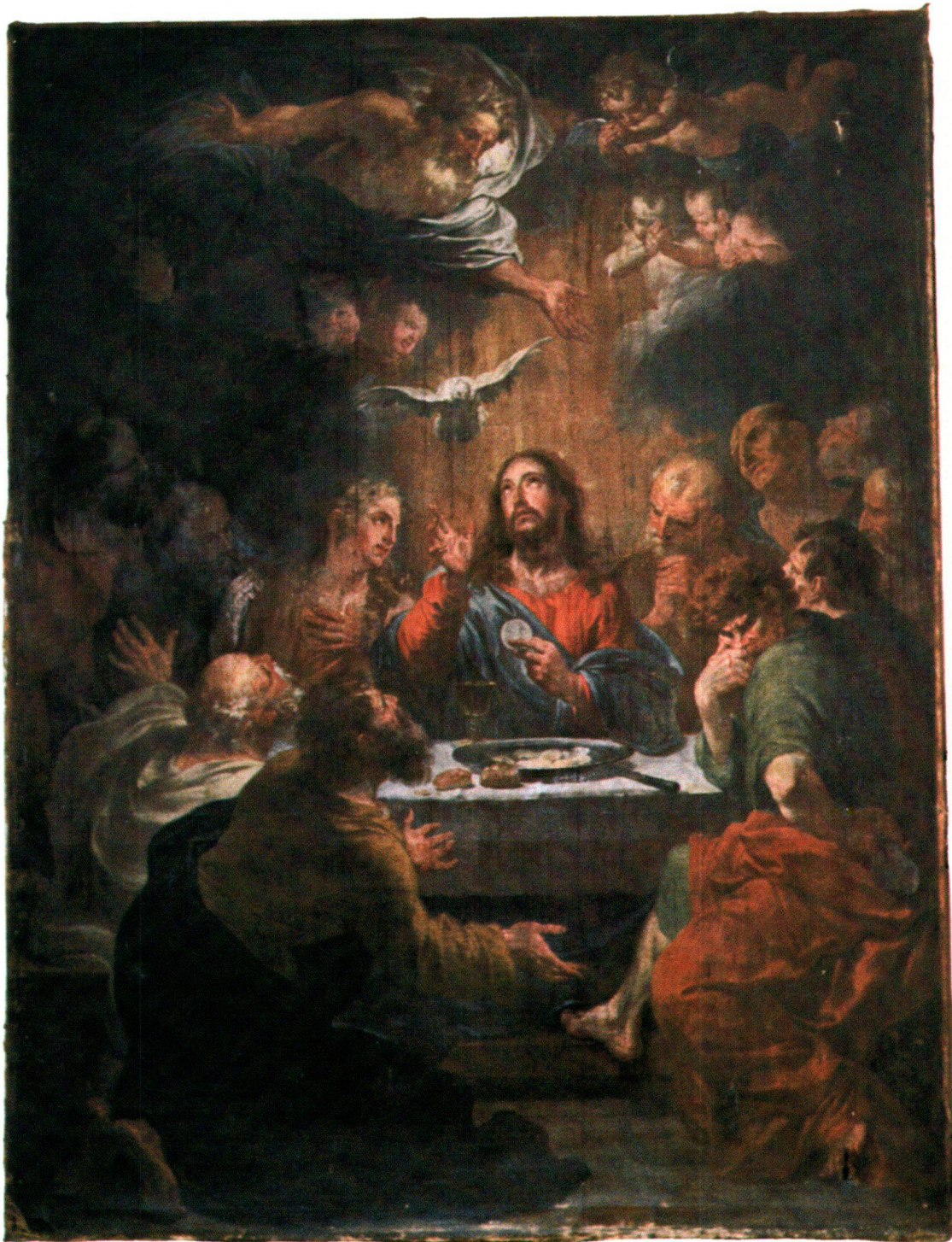
Fig. 5 Ultima Cena. Loco, Chiesa parrocchiale di San Remigio.

Il secondo dipinto del quale tratteremo in modo più diffuso, è l' Ultima Cena (Fig. 5) conservato nella Chiesa parrocchiale di Loco. L'opera, che misura 2,8 \times 2,2 m, è attualmente in restauro e non reca né la firma, né la data di esecuzione. La storiografia ha spesso segnalato la presenza del quadro suggerendo a volte attribuzioni diverse, dalla cerchia degli Orelli fino - in tempi più recenti - a una paternità rubensiana, ma nel corso del nostro lavoro avremo modo di dimo-