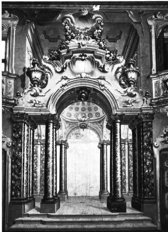
Fig. 10 Giovan Antonio Torricelli: quadrature. Sondrio, palazzo Sertoli in Quadrivio, salone d'onore.

A conclusione di questa rassegna, osserviamo che dei due fratelli Torricelli il più interessante ed originale è senz'altro Giovan Antonio, le cui opere migliori in Lombardia sono quelle eseguite in collaborazione con il mal conosciuto Pietro Solari da Bolvedro. Le architetture del Solari, la cui remota ma sostanziale matrice culturale borrominiana (comune ad altri maestri del rococò in Piemonte e nell'Europa centrale) traspare con evidenza nella raffinata e nervosa sensibilità decorativa, ed inoltre nella predilezione per le piante centrali e per gli spazi raccolti, animati da giochi complessi e movimentati di aperture, costituiscono il supporto più adatto per l'opera dei quadraturisti: tanto per la elegante fragilità, costruita su di un teso e calligrafico lineatismo, del Coduri in palazzo Malacrida, quanto per le scenografie esuberanti e dinamiche di Giovan Antonio Torricelli.