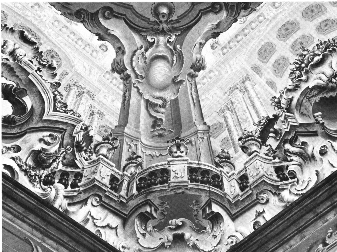
Fig. 9 Giovan Antonio Torricelli: quadrature. Sondrio, palazzo Sertoli in Quadrivio, salone d'onore.

piazza Castello 34 , il cui salone maggiore presenta sulla volta una decorazione illusionistica a mio giudizio riferibile, se non proprio a Giovan Antonio Torricelli, quanto meno alla sua scuola, e direttamente ispirata al modello più felice di palazzo Sertoli a Sondrio.