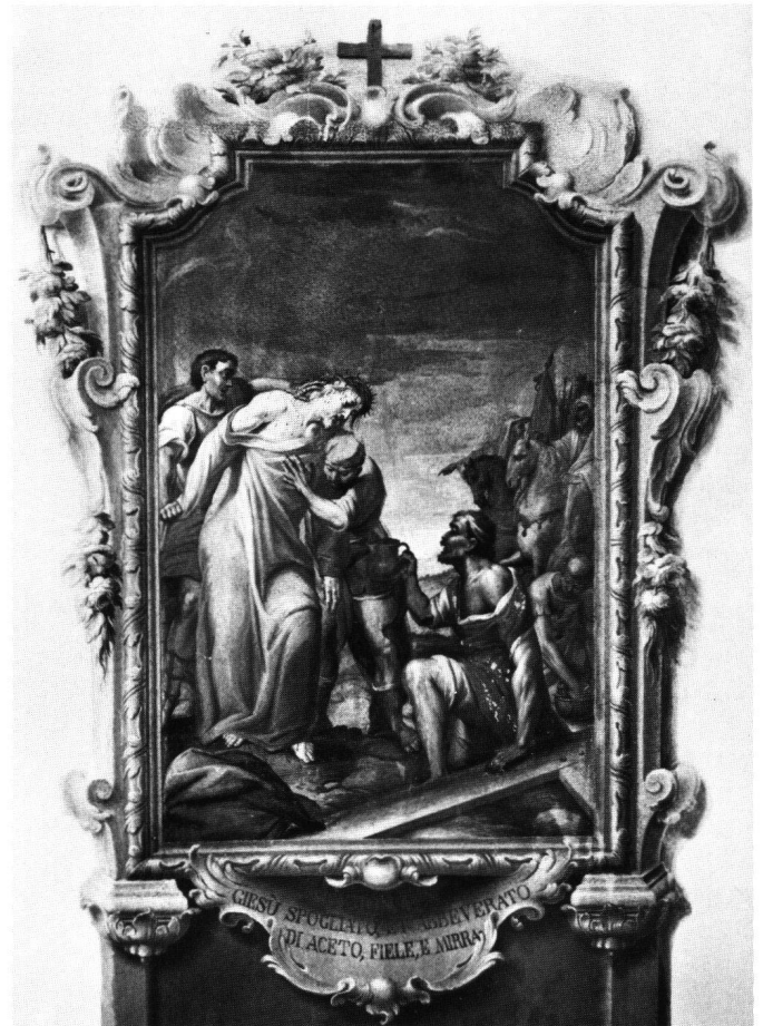
Fig. 4 Giuseppe Antonio e Giovanni Antonio Torricelli: Cristo spogliato delle vesti. Lugano, convento delle Cappuccine, Via Crucis, stazione X.

piegati i medesimi modelli compositivi, però con una stesura pittorica più rigida e calligrafica, probabilmente anche per effetto di ridipinture (Fig. 3-4) 16 ; e si tratta del resto, per quanto si ricava dai pochi frammenti superstiti, degli stessi utilizzati nel 1747-48 a Valmadrera. Non mi è riuscito di accertare se i Torricelli si servirono ripetutamente della stessa fonte grafica, oppure se spetti a loro l'invenzione dei modelli, sfruttati a più riprese in occasione delle frequenti richieste di Vie Crucis ai nostri pittori, veri e propri specialisti del genere (è del 1757 il progetto di un'altra Via Crucis per Campo Val Maggia). 17 Nelle scene migliori del ciclo di Roncaglia, l'intensa Spogliazione delle vesti (stazione X), la Deposizione dalla Croce (stazione XIII) e la Deposizione nel sepolcro (stazione XIV), ritornano gli influssi petrini, anche se Giuseppe Antonio Torricelli non raggiunge mai gli esiti di severa e allucinata drammaticità del pittore di Carona.