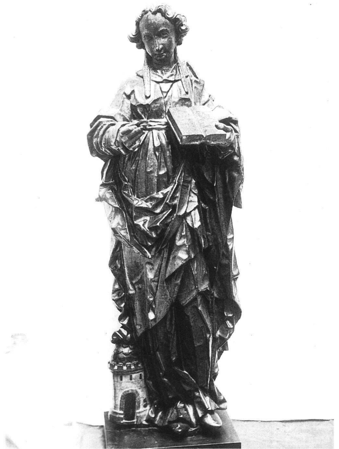
Fig. 8 Sainte Barbe, collection épiscopale.

Les personnages de Sâles, en particulier, sainte Marie-Madeleine et saint Antoine témoignent d'un tempérament vigoureux, original, servi par une habileté technique bien au point, tout comme ceux du retable de Bonn; leur stature monumentale en fait la représentation la plus typique du style de Jacques Reyff, à son apogée.