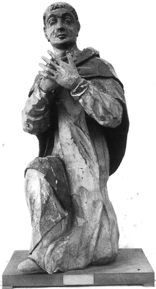
Fig. 9 Saint Dominique, collection épiscopale.

Les vêtements de saint Dominique, modelés avec exactitude, sont traités d'une façon simple et rude mais habile; un coup de gouge, au bon endroit, suffit à les faire vibrer. Le manteau de bure, attaché autour du cou, trouve son point de suspension sur le genou; la robe tombe droit, à peine visible. Volontairement les formes corporelles s'estompent pour mettre en valeur une physionomie spirituelle illuminée par la présence de l'Esprit. 22