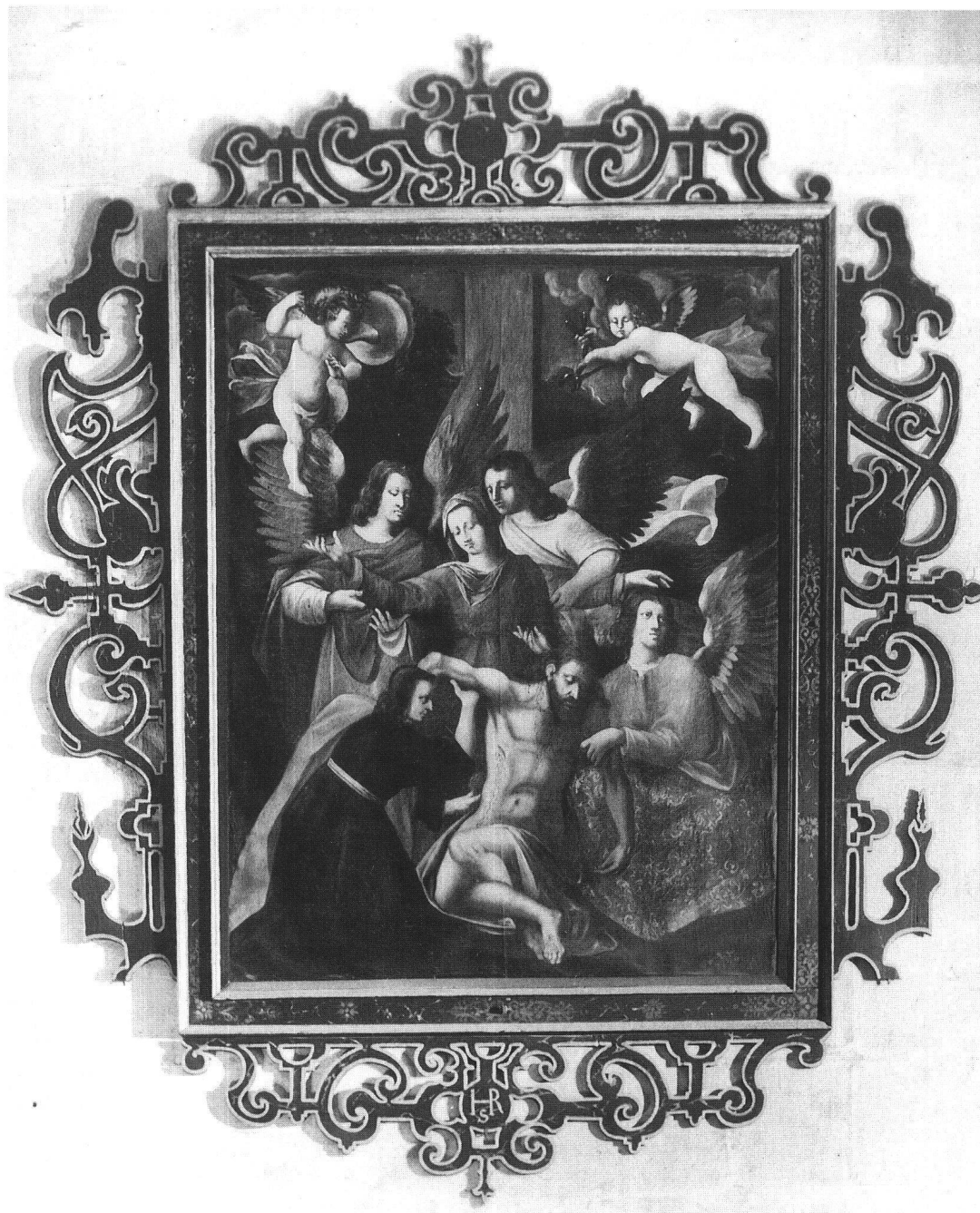
Fig. 11 Descente de Croix, cadre de Jacques Reyff.

paysanne majestueuse et bonne, vers qui les gens aiment à se tourner.