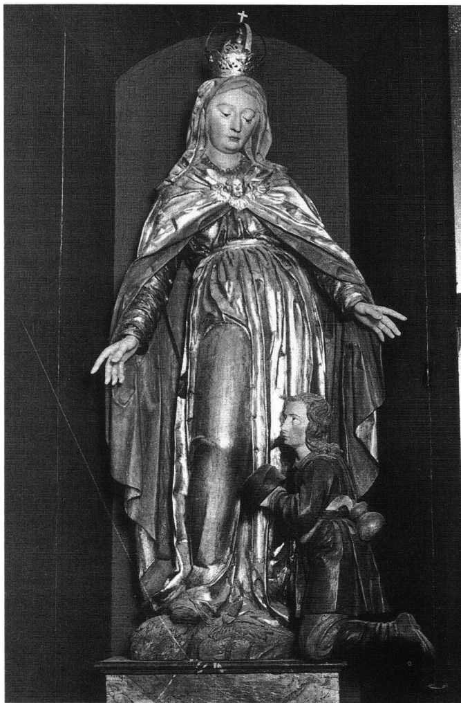
Fig. 12 Notre-Dame d'Obermonten.

Le Christ bénissant, jadis au musée d'art et d'histoire, offert par le gouvernement de Fribourg à celui de Schaffhouse, au