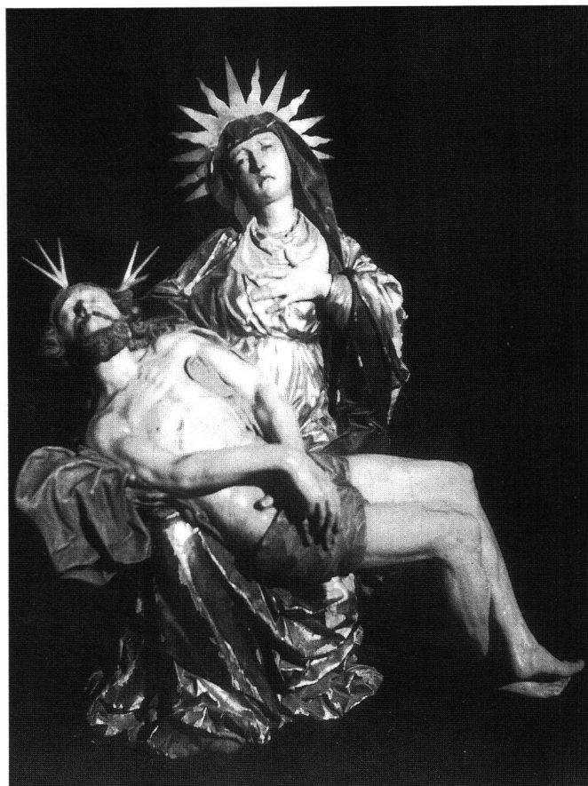
Fig. 15 Pietà de Bourguillon.

Pour l'autre, nous n'avions pas d'opinion fiable. C'est le «retour à la vie» de Jacques Reyff qui, récemment, nous a inspiré la solution.