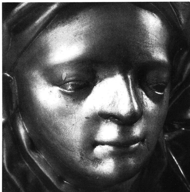
Fig. 18 Portrait présumé de Jacques Reyff.

Ce qui frappe, d'emblée, c'est la vivacité et la finesse du visage de la Madone, encadré de cheveux qui tombent en spirales, la froissure du manteau qui recouvre la robe, le