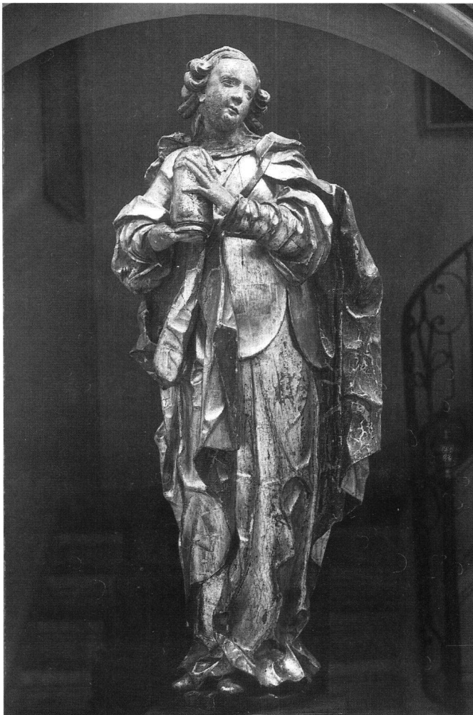
Fig. 5 Sainte Marie Madeleine, de l'ancienne église de Sâles, 1642-1645, Fribourg; collection épiscopale.

Si l'on considère, par exemple, l'apôtre saint Jean, on note, chez lui, sous un manteau tout froissé aux bords découpés, retenu à l'épaule, une robe où prédominent quelques plis allongés qui parcourent le corps entier, en décrivant une ample courbe, pour lui imprimer un élan, une élasticité, une spiritualité exceptionnels. Ce mouvement est