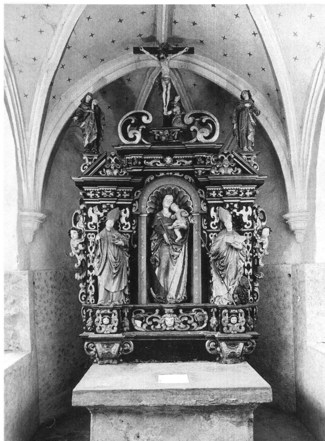
Fig. 1 Le retable de la chapelle de Bonn, 1642-1644, Guin (Düdingen).