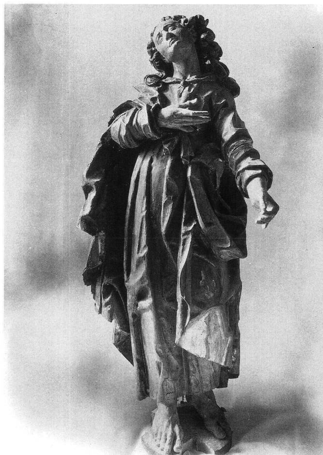
Fig. 2, 3 La Vierge Marie et saint Jean, Calvaire du retable de Bonn.

l'atelier Reyff, situé à la rue d'Or, dans le quartier de l'Auge. Des recherches approfondies ont démontré qu'il fallait abandonner cette piste. 4