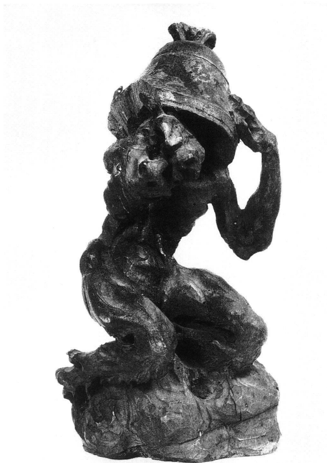
Fig. 20 Diablotin, au Musée d'art et d'histoire, Fribourg.

Jacques une justification totale: l'atelier, pensait-il, n'aurait pas à souffrir des distances qu'il prenait à son égard, puisqu'il avait pour lui succéder, en qualité de chef, un maître-sculpteur habile et qui jouissait de son entière confiance.