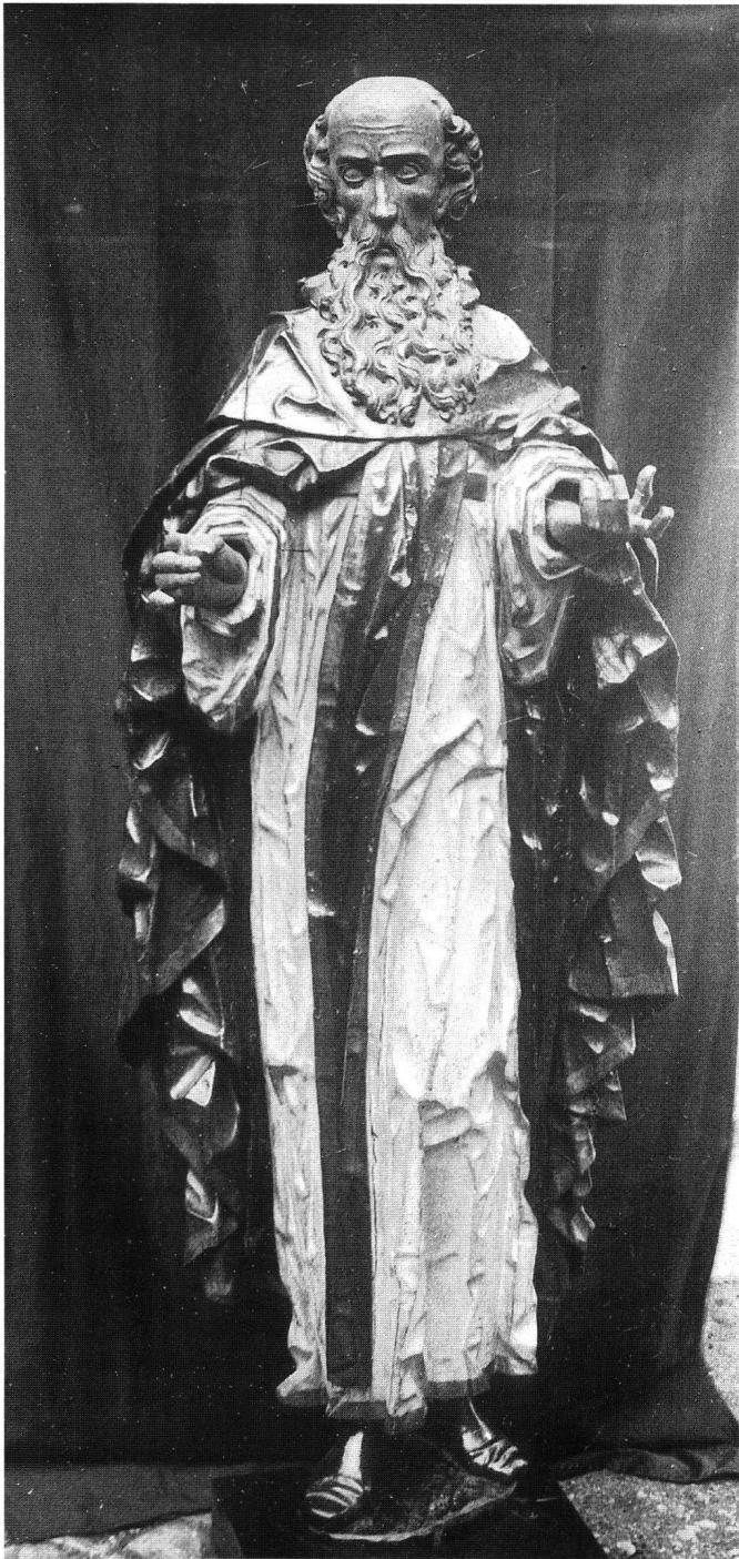
Fig. 6 Saint Antoine, Ermite, collection épiscopale.

encore accentué par la position de la tête, fortement inclinée sur le côté, en direction de la croix, pour traduire l'intensité des sentiments qui l'unissaient à son maître.