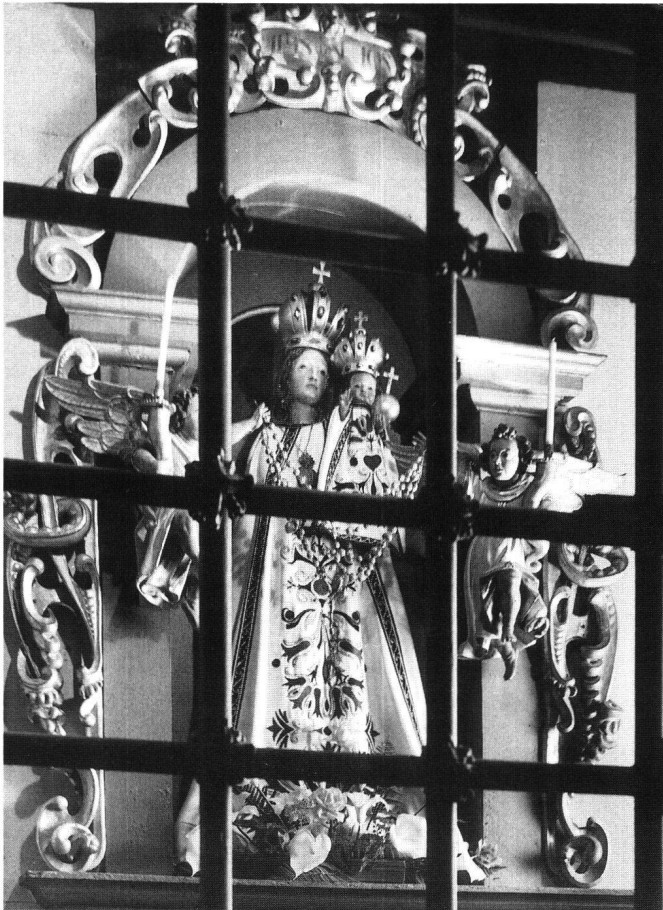
Fig. 14 La Vierge de Lorette.

Mère, et largement épanouis chez l'enfant, leur font un cadre élégant, dominé par deux couronnes ornées de pierres, dans le goût de l'époque.