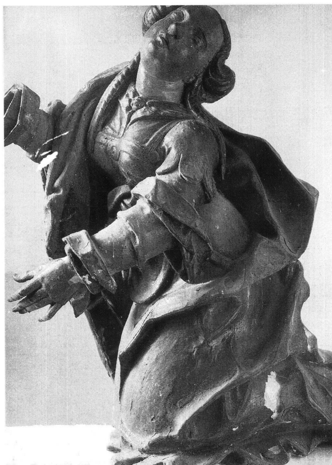
Fig. 4 Marie-Madeleine, Calvaire du retable de Bonn.

C'est Jacques enfin, qui effectua, ou du moins acheva de tailler les retables commandés à son frère aîné par les gens d'Orsonnens. Une convention pour la livraison de deux autels et de «deux beaux crucifix pour mettre sur les autels» avait été passée entre les Commissaires de la paroisse