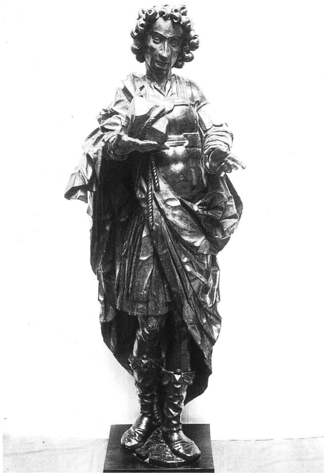
Fig. 7 Saint Etienne, collection épiscopale.