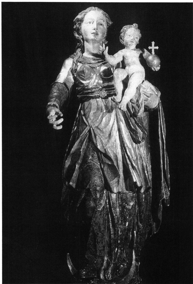
Fig. 19 Vierge à l'Enfant du Fort Saint-Jacques.