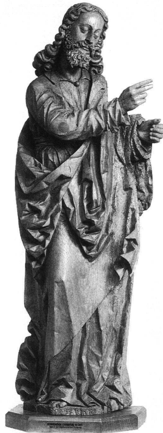
Fig. 13 Christ bénissant, au Musée de Schaffhouse.