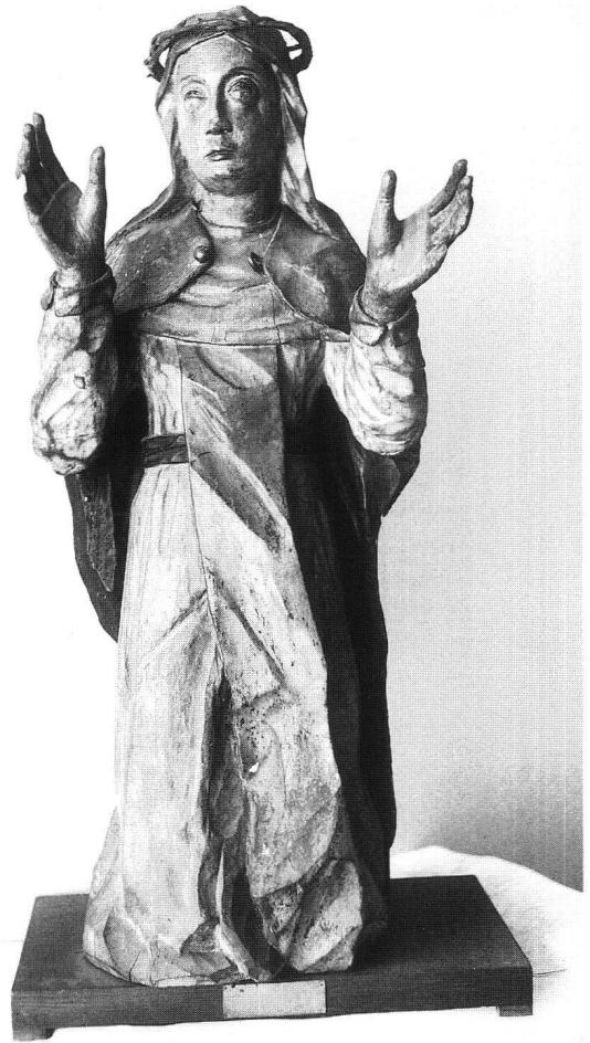
Fig. 10 Sainte Catherine, collection épiscopale.

Le tableau de la Descente de Croix que peignit François Reyff, vers 1640, d'après un original de Van Dyck, est pourvu d'un cadre découpé et ajouré, de même esprit que le décor du retable de Bonn; ce cadre n'a pas son pareil à Fribourg.