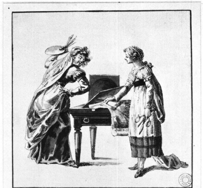
«Gespräch zwischen der Mahlerey und der Kupferstecherey».

Spahr er ja die Farben nicht; Handhoch aufgetragen! Da er jezt zween Thaler kriegt Hat er nichts zu klagen. Auch die Tafel wird ja klein,