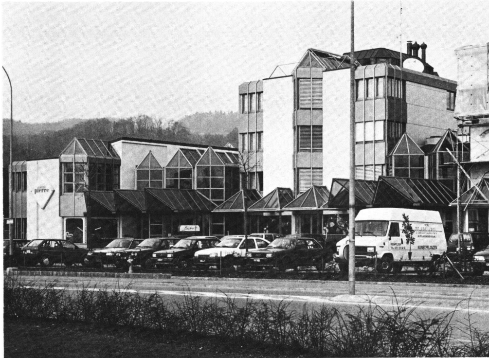
Abb. 2 Einkaufszentrum Amriswilerstrasse, Weinfelden TG.

ebensowenig drücken sie aus, dass Widersprüche und Ambivalenzen zu permanenter und zugleich offenerer Auseinandersetzung und Deutung auffordern. Statt dessen gilt «everything goes», oder es wird eine bestimmte Interpretation forciert: das öffentliche Ärgernis.