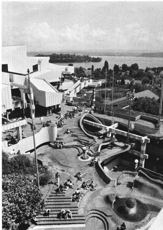
Abb. 1 Universität Konstanz, Aussenansicht.

Wir sollten darum unterscheiden zwischen einer elaborierten (reflektierten) und einer naiven (opportunistischen) Postmoderne. Beispiele für Werke der ersten Kategorie sind, um einige wenige zu nennen, Stirlings Neubau der Stuttgarter Staatsgalerie, die Bilder von Rauschenberg, die Musikpraxis des Kronos Quartetts, die Schriften von Calvino. In verschiedener Hinsicht trägt auch die Architektur der Universität Konstanz Züge einer elaborierten Postmoderne (Abb. 1). Was die zweite Kategorie betrifft, stossen wir auf sie in vielen Neubauten, beispielsweise das Einkaufszentrum am östlichen Dorfeingang von Weinfelden (Abb. 2), oder auf der Fahrt durch die Laube in Konstanz die der Brunnenplastik von Lenk; jeder von uns könnte weitere Ärgernisse dieser Art nennen. Ihnen fehlt der kreative und selbstkritische Umgang mit Pluralität;