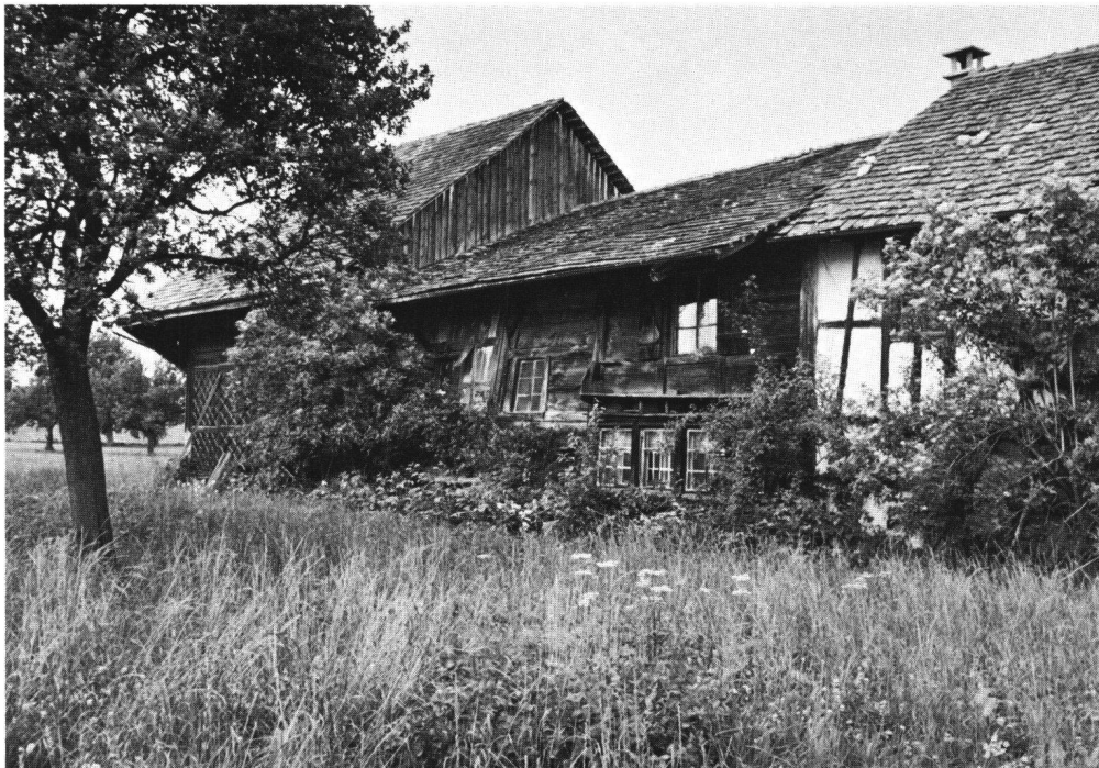
Abb. 3 Haus Affentranger, Amriswil-Schrofen TG, vor der Restaurierung, Juni 1982.

10. Nun habe ich in meinen Ausführungen das Konzept der Postmoderne in zweierlei Weise verwendet. Ich habe mich auf seine Herkunft in der Literatur-, Architektur- und Kunstkritik bezogen, und ich habe es für die soziologische Zeitdiagnose genutzt. Damit will ich den Doppelcharakter des Konzeptes hervorheben. Die Postmoderne als Thema der Kulturanalyse ist von der Postmoderne als Gesellschaftsanalyse nicht zu trennen. Dieser Verknüpfung entspricht die vermehrte Zuwendung zu Semiotik und Pragmatik, um nicht zu sagen die Soziologisierung der Kunstwissenschaften ebenso wie das neue Interesse an Kultur in den Gesellschaftswissenschaften und – wichtiger noch – in der gesellschaftlichen Praxis. Hier ist als das wohl