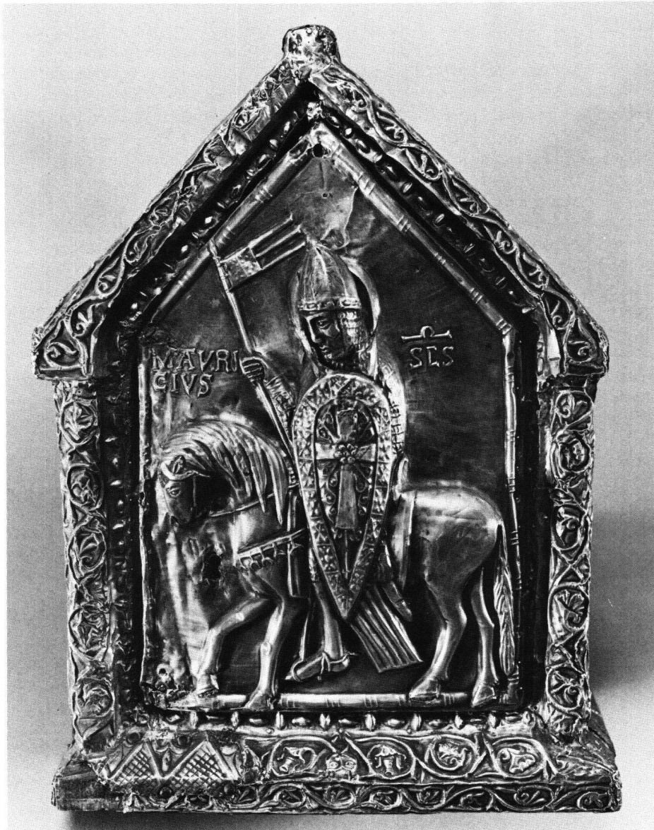
Fig. 5 Saint Maurice équestre, châsse des Enfants de saint Sigismond, vers 1160. Saint-Maurice, trésor de l'Abbaye.

militaire du XIII e siècle; il est armé d'un écu et d'une lance. 58 Vers 1200, il figure sur un vitrail au croisillon sud du transept de la cathédrale de Strasbourg, où il est associé à saint Candide et saint Victor. Les trois militaires sont en pied, un écu et une arme dans chaque main. 59