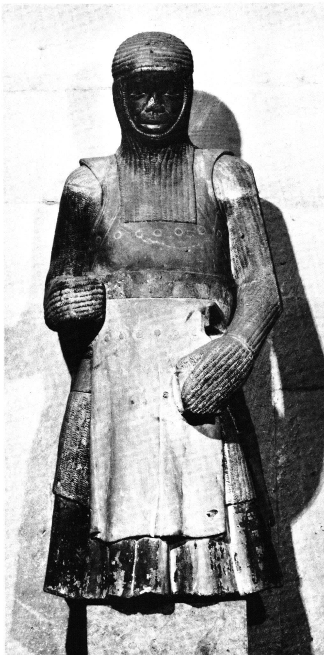
Fig. 1 Saint Maurice de Magdebourg, vers 1240.

C'est cet épisode que relate – par exemple – la peinture murale d'Essen-Werden, de la fin du X e siècle, qui déve-