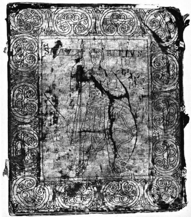
Fig. 4 Plat ciselé du codex mosan-rhénan de Mayence, fin du X e siècle.

armes sont à terre, et les futurs martyrs s'inclinent en signe de soumission. 39 A la cathédrale du Puy, dans une peinture murale du milieu du XI e siècle, il est en soldat devant l'empereur qui ordonne le martyre. 40