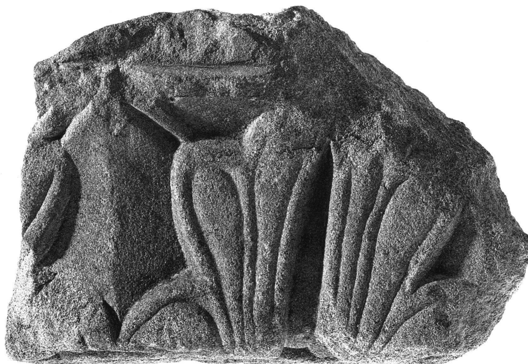
Fig. 1 Fragment sculpté en molasse, peut-être trabes d'une clôture de chœur, trouvé à Lausanne, rue Vuillermet n° 6, vue de face.

La face principale représente une feuille, traitée schématiquement, aux extrémités presque pointues et vraisemblablement au nombre de cinq à l'origine. On remarque à gauche l'amorce d'une deuxième feuille, semblable. La forme et l'articulation renvoient au modèle de la feuille d'acanthé chère à l'art antique, bien qu'on en ait modifié la structure organique et le dessin classique, réduits à une stricte frontalité et à un relief aplati. Trois des pointes de la