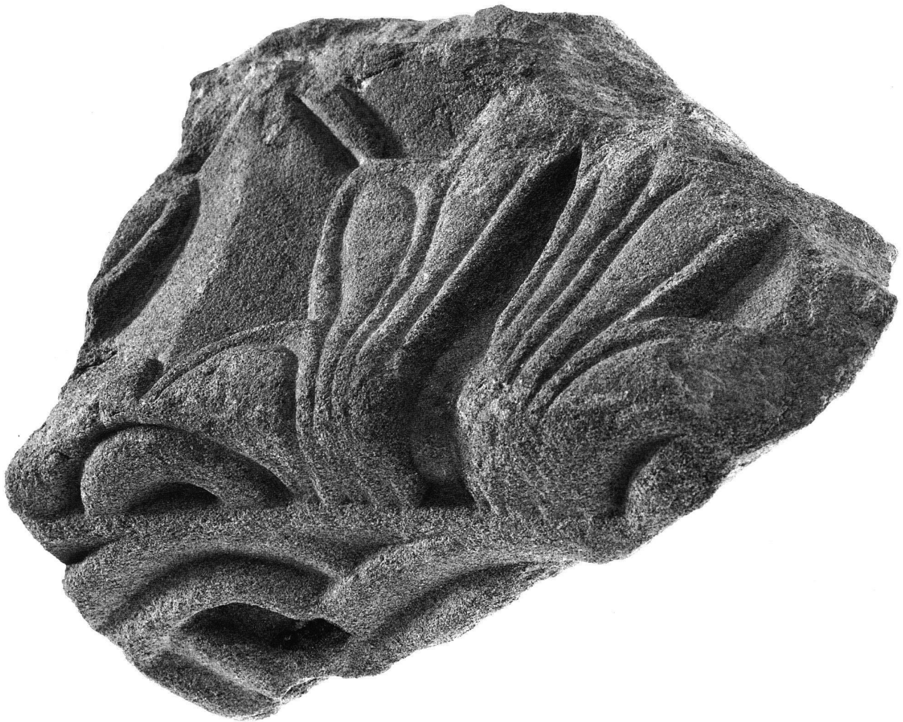
Fig. 3 Fragment sculpté en molasse, vue oblique d'en bas avec les deux faces sculptées.

quantité de formes variées et non exclusivement à l'époque romaine, sont ici sculptés dans la pierre.