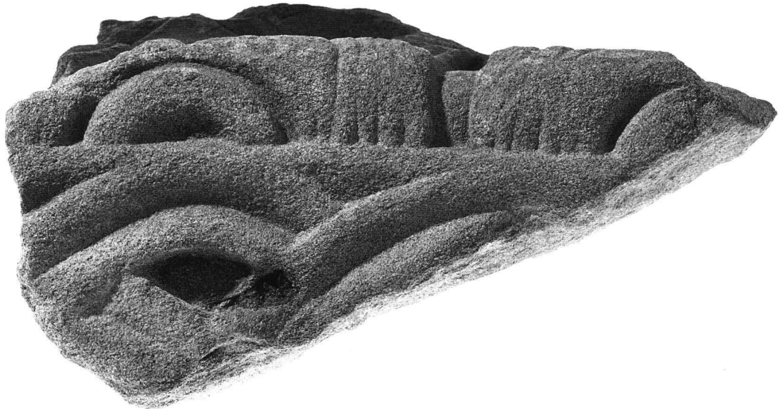
Fig. 2 Fragment sculpté en molasse, vue d'en bas.

feuille d'acanthé stylisée sont endommagées. Chacune des pointes de feuille est partagée par le milieu et fait saillie, sans pourtant se détacher du fond; elles sont toutes cernées d'une rainure peu profonde. Les pointes latérales des feuilles d'acanthé s'inclinent l'une vers l'autre et chevauchent une feuille d'eau, dont l'extrémité est également endommagée; son rendu est raide et lisse, avec une nervure médiane faisant arête ainsi que, pour toute articulation interne, une rainure bordant la feuille. La corbeille s'achève en haut par une rainure horizontale, dont seul subsiste le départ des bords, au profil torique. On peut déduire, de la hauteur originale présumée des pointes de feuille abîmées, que celles-ci couvriraient la rainure horizontale, ou même qu'elles s'élevaient bien plus haut. L'extrémité supérieure du bloc est perdue.