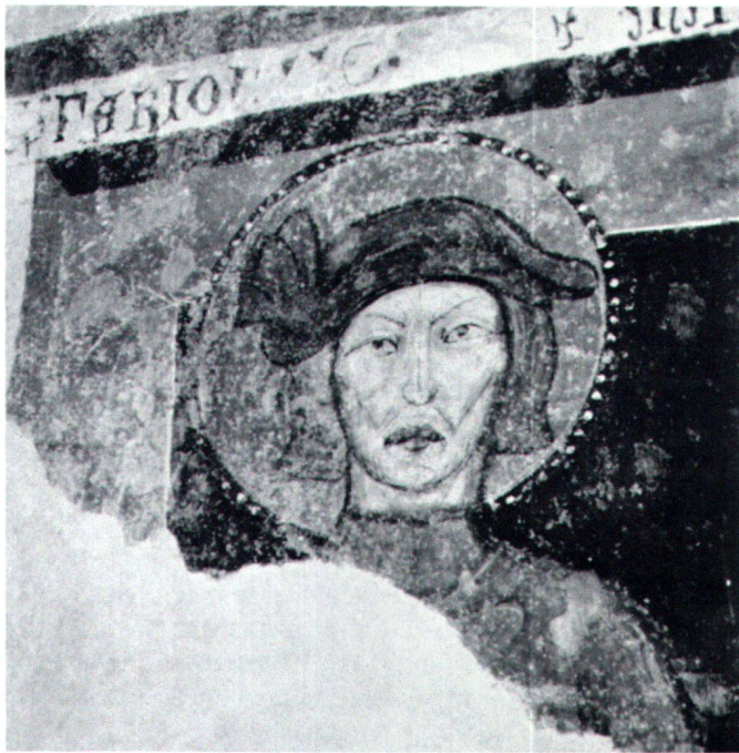
Fig. 2 San Feriolo, fine XIV secolo. San Vittore, Cappella di San Lucio.

gruppo di Santi. Le aree maggiormente ricettive per i Santi da me citati si dimostrano essere: il Bellinzonese, la Valle Leventina e la Valle di Blenio. Un ruolo secondario giocano invece il Locarnese, la Mesolcina, il Luganese ed il Mendrisiotto. È lecito a questo punto chiedersi che cosa determini la diffusione o meno di un Santo all'interno di una regione. Forse la provenienza? Forse il luogo in cui sono conservate le reliquie? Non è facile rispondere a queste domande in modo certo. Cercherò tuttavia di presentare in breve la vita dei Santi per vedere se almeno una prima ipotesi sia ricavabile.