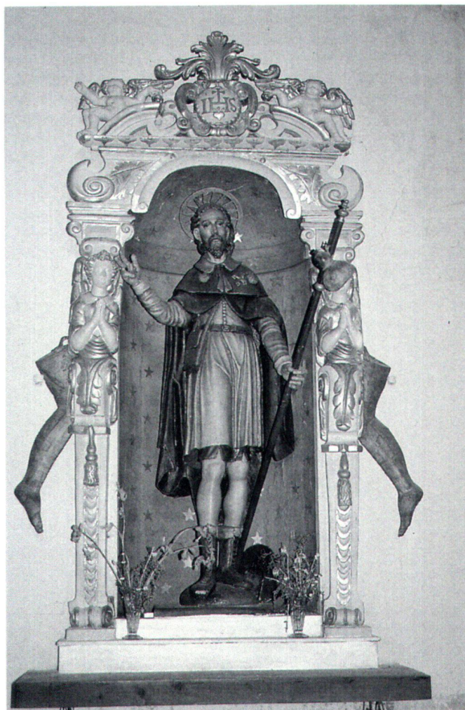
Fig. 6 San Pellegrino, II metà XVI secolo. Giornico, Chiesa di San Pellegrino.

Per quanto riguarda la pala d'altare, posso dire che la raffigurazione del Santo è quella classica. Egli infatti sopra l'abito da viandante, indossa una mantella e il sanrocchino, ha i calzari a lacci e sulla testa porta il cappello. Oltre al bordone, porta con sé una piccola sacca e la borraccia, legate insieme. Sul sanrocchino ha il doppio simbolo della croce e la foglia, e con la mano destra fa un segno di benedizione alla greca. L'insieme è inserito in un paesaggio molto dilatato.