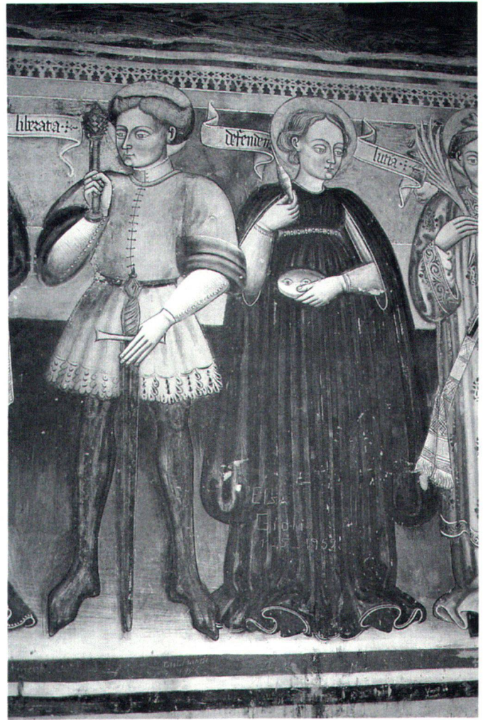
Fig. 3 San Defendente, seconda metà XV secolo. Monte Carasso, Chiesa di San Bernardo.

Per San Mamete (conosciuto anche come Mamas, Mamante, Mammete) la storia della vita non è certa: sembra comunque che la sua origine sia da ricercare nell'Oriente greco e che poi – dopo il martirio avvenuto per ordine dell'imperatore Aureliano (III sec.) – il suo culto si sia diffuso in Italia (soprattutto nell'area veneta), in Germania e in Francia, dove nel circondario di Aurillac esiste un borgo a lui intitolato: St-Mamet-le-Salvetat. Dove siano conservate le sue reliquie non si sa. In ogni modo la sua commemorazione avviene il 17 agosto. 11