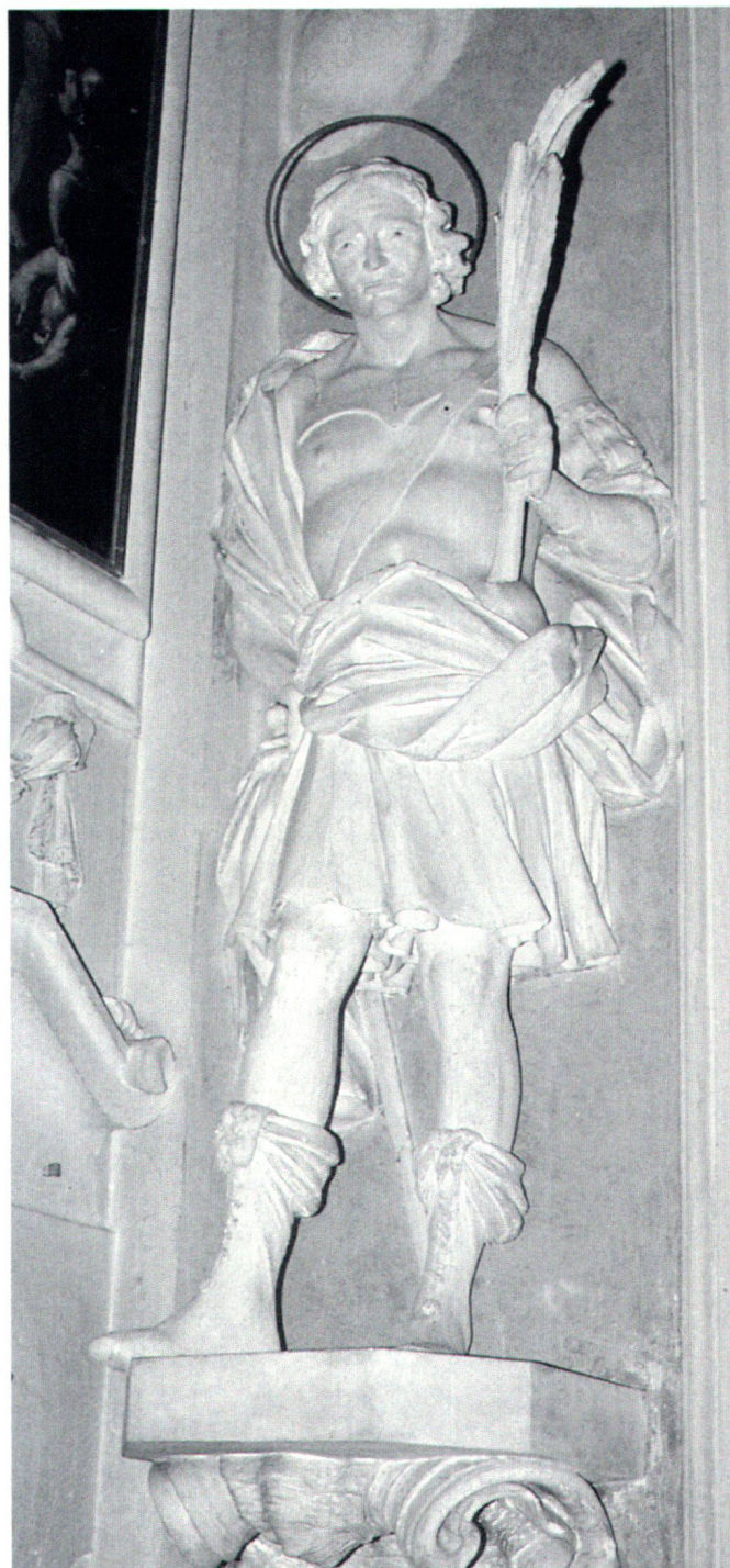
Fig. 5 San Defendente, XVII secolo. Castel San Pietro, Chiesa di Sant'Eusebio.

Raffigurato sempre come giovane cavaliere, San Defendente ha qui i capelli biondi divisi da una scriminatura, e la sua testa è aureolata. Indossa una calzamaglia rossa e sopra porta una corta tunica grigia decorata con bottoncini e cintura rossa alla vita. Particolare il colletto alto che completa la tunica e le maniche di pelliccia, che arricchiscono l'insieme. Anche in questo esempio il santo tiene nella mano destra la mazza ferrata e nella sinistra la spada. Allo stesso modo di Ascona, al fianco del capo reca la scritta «DEFENDENS». 25