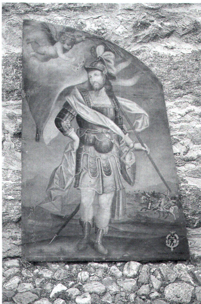
Fig. 4 San Defendente, XVII secolo. Berzona, Chiesa di San Defendente.

vita. 13 La sua memoria è conservata a Delebio in Valtellina, nella chiesa dedicata al suo nome dove, nel gennaio 1785, venne trasferito anche il corpo di Sant'Agrippino, allorché venne soppresso il monastero dei Cistercensi dell'Acquafredda, sul lago di Como, dove era stato venerato fino a quel momento.