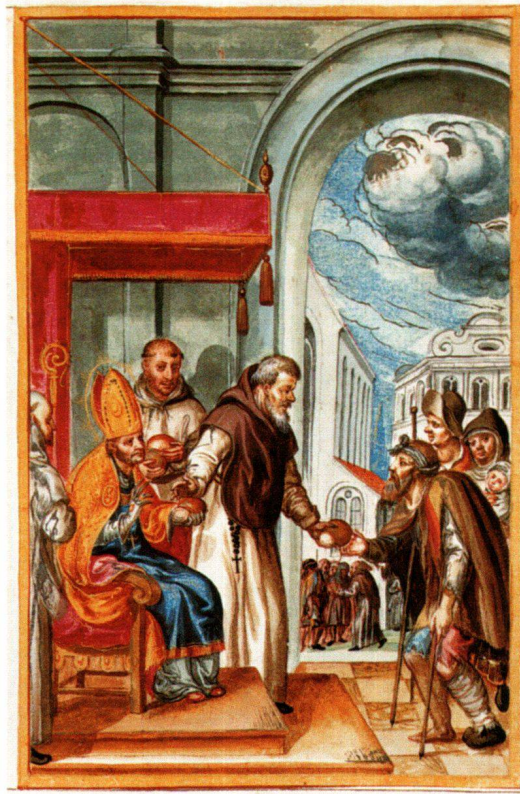
Abb. 14 Der heilige Anthelmus, Gratulationsminiatur um 1628/29, 23×15 cm. Kantonsbibliothek Frauenfeld, Necrologium Ittingense.