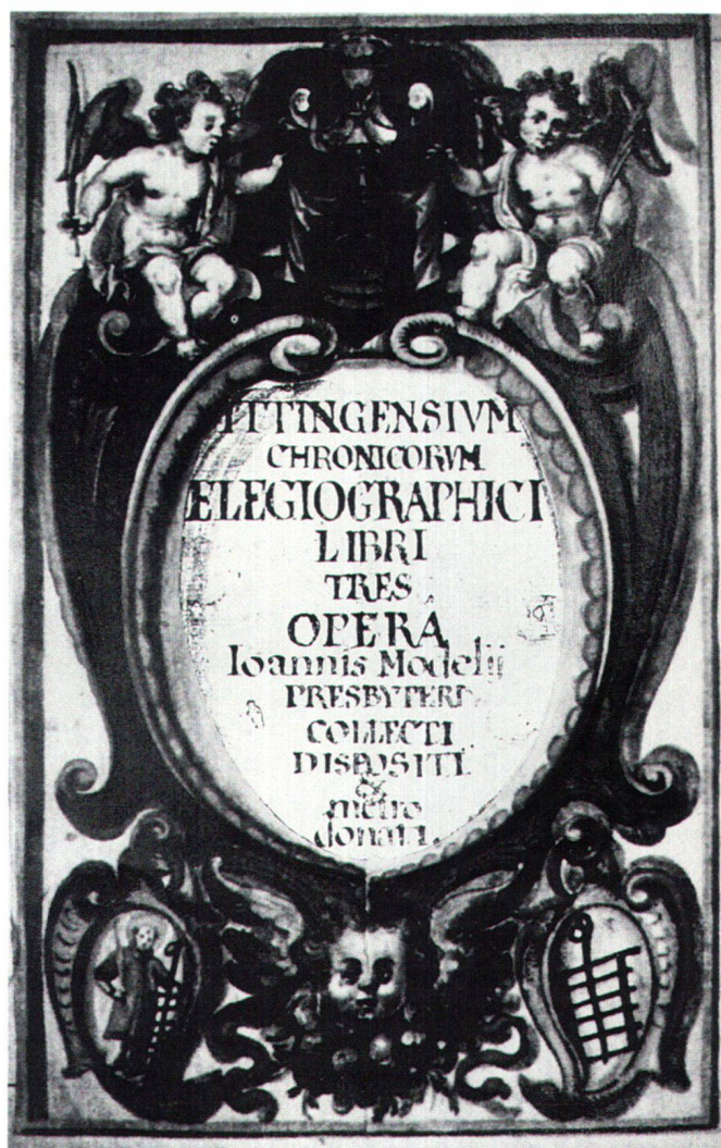
Abb. 2 Fotomontage, Titelblatt der Elegienbücher des Modelius, um 1623.