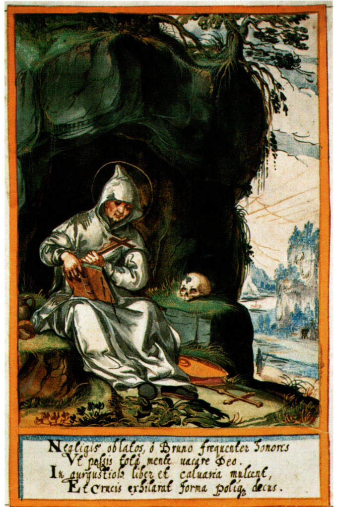
Abb. 8 Der heilige Bruno, Gratulationsminiatur 1629, 23,3 × 15 cm. Kantonsbibliothek Frauenfeld, Necrologium Ittingense.

noch in seiner Eigenschaft als Vikar (Stellvertreter des Priors) zugeeignet. Von den meisten Gedichten ist der Verfasser genannt. 29