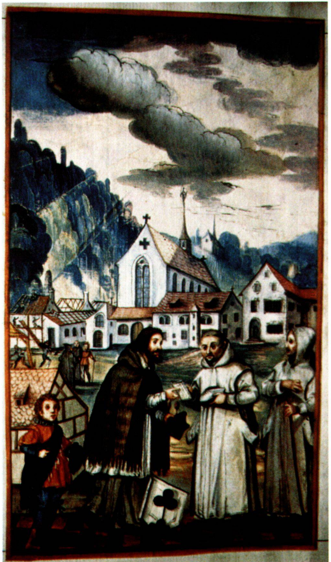
Abb. 5 Die Kartäuser in Ittingen, aus den Elegienbüchern des Modelius, um 1623, 24 × 14,2 cm. Grande Chartreuse, Chronicon Ittingense.

Dieser Titelausschnitt muss nach 1856 in Ittingen zum Vorschein gekommen und aufgeklebt worden sein, denn in diesem Jahr stellte man – handschriftlich hinten im Entwurf eingetragen – unzutreffende Vermutungen über den Verfasser an. Die Form des Ausschnitts passt nun aber genau in die Lücke der Titelminiatur des «Chronicon»! Zudem läuft auch die graue Schattenmalerei links weiter, und einige ganz kleine Spuren der ursprünglichen Schrift, die nicht mit ausgeschnitten worden waren, sind noch erkennbar, so der äusserste Punkt des Schluss-M der ersten Zeile des Modelius-Titels rechts unterhalb des N des Seilern-Titels «CHRONICON» sowie die Hälfte des Schluss-