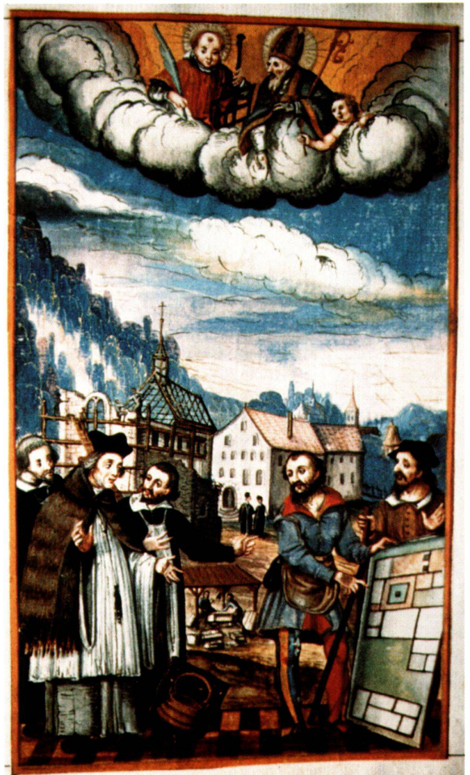
Abb. 4 Die Augustinerchorherren in Ittingen, aus den Elegienbüchern des Modelius, um 1623, 23,7 × 14,2 cm. Grande Chartreuse, Chronicon Ittingense.

gleiche Weise gestaltet. Da sie aber keine eingeklebten Miniaturen enthält, kann sie hier ausser acht gelassen werden.