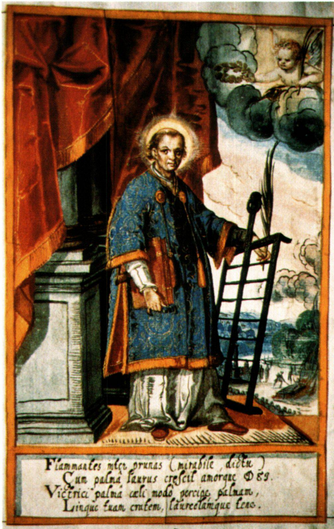
Abb. 6 Der heilige Laurentius, Gratulationsminiatur, 1628, 23,5 × 15 cm. Grande Chartreuse, Chronicon Ittingense.