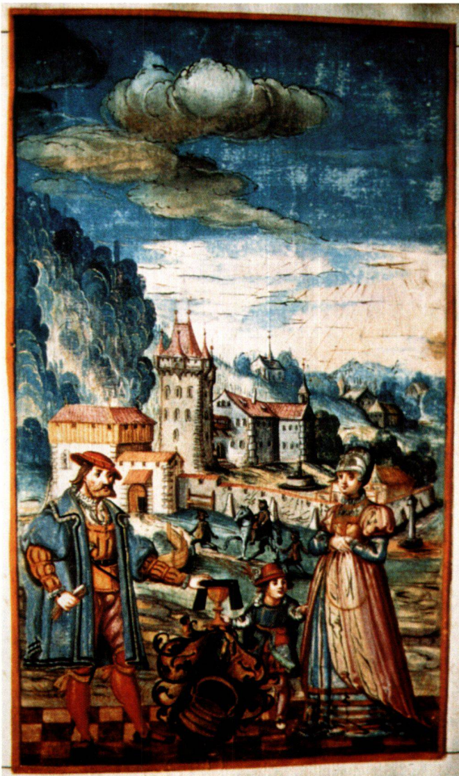
Abb. 3 Die Truchsessen von Ittingen, aus den Elegienbüchern des Modelius, um 1623, 23,9 × 14,2 cm. Grande Chartreuse, Chronicon Ittingense.