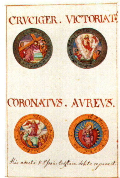
Abb. 10 Vier Medaillen, Gratulationsminiatur 1630, 23,1 x 15 cm. Kantonsbibliothek Frauenfeld, Necrologium Ittingense.

schwerden, insbesondere vom Schwinden des Augenlichts, gezeichnet gewesen sein, derentwegen er 1648 vom Amt abgelöst wurde. War das der Grund? Hatte er altershalber seine Ausstrahlungskraft eingebüsst?