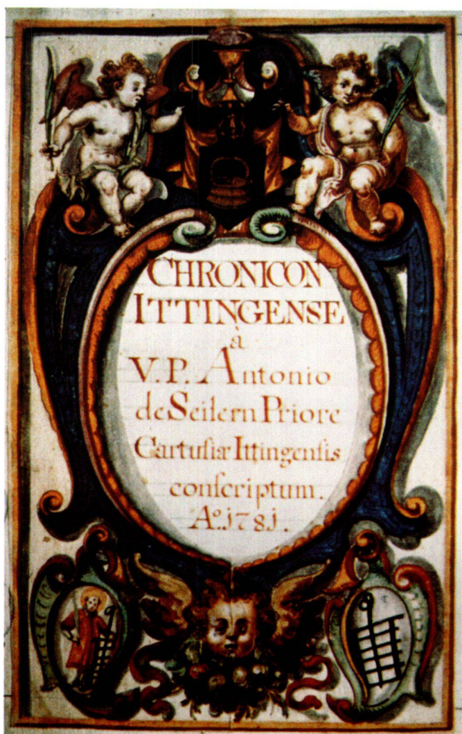
Abb. 1 Titelblatt zum Chronicon Ittingense, aus den Elegienbüchern des Modelius, um 1623, 24,7 × 16,5 cm. Grande Chartreuse, Chronicon Ittingense.

klebten Miniaturen verziert sind. Diese Miniaturen aus dem frühen 17. Jahrhundert sind sorgfältig in Tempera auf Papier ausgeführt und mit Gold, teilweise auch mit Silber, gehöht. Alle messen, wenn nicht beschnitten, ca. 23–24 cm in der Höhe und 14–16 cm in der Breite (die genauen Masse 1