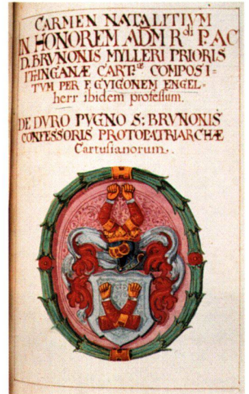
Abb. 15 Das Wappen Hartefaust, Gratulationsminiatur 1629, 23,5×14,8 cm. Klosterband.

Kreuzgangs mit einer ganzen und dem Rand einer angeschnittenen Zelle. Die Mönchshäuschen des Ostflügels sind nur noch knapp angedeutet. Diese vier östlichen Zellen wurden gemäss Datierung über der Tür 1621 neu gebaut, die drei südlichen aber waren erst 1627 fertig, der anschliessende Kreuzgang gar erst 1629. Hat der Maler 1624 das zukünftige Aussehen vorweggenommen? Solches ist ja öfters gemacht worden. Auch ist nur das westlichste Häuschen ganz sichtbar, das zweite angeschnitten. Oder aber stammt das Bild doch von 1628? Da waren die Zellen fertig, der Kreuzgang aber noch nicht, was die recht schmale Dachlinie andeuten könnte. Wir hätten in diesem Fall erst die Südwand des künftigen Kreuzgangs vor uns.