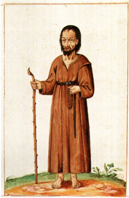
Abb. 13 Niklaus von Flüe, Gratulationsminiatur 1629, 23×15 cm. Kantonsbibliothek Frauenfeld, Necrologium Ittingense.