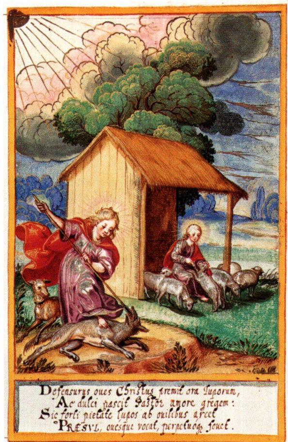
Abb. 12 Christus als guter Hirte, Gratulationsminiatur 1628, 23,6×15 cm. Kantonsbibliothek Frauenfeld, Necrologium Ittingense.

Bildlich umgesetzt finden sich eben diese Medaillen auf der Miniatur N3 (23,1×15 cm). Sie ist auf der Vorderseite des 26. Blattes eingeklebt. Als Umfassung zeigt das Blatt die gleiche braune Linie wie das Bild mit dem Heilsbrunnen. Es ist ganz knapp ausserhalb dieser Linie ausgeschnitten