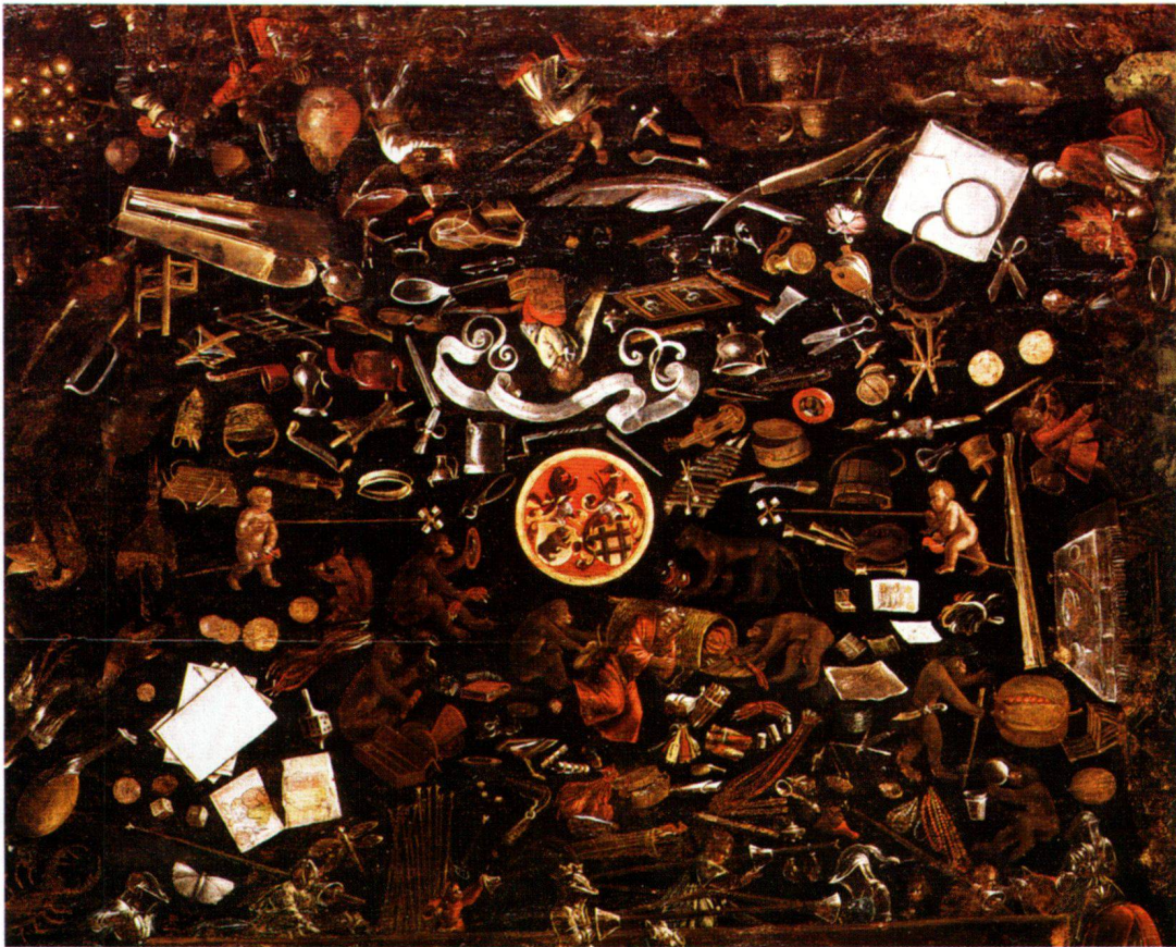
Abb. 3 Sog. Holbeintisch. Mittelfeld der bemalten Tischplatte, Basel 1515.

in der Nacht des schwarzen, von weissen, wie mit Kreide auf Schiefer gezeichneten Lichtern durchsetzten Grundes. Sucht man den Weg in die Welt der in diesen Lichtern aufscheinenden Gegenstände, dann stösst man zunächst unter dem Allianzwappen auf die Figur des schlafenden Krämers, der von Affen ausgeraubt wird. Die gegenüberliegende, vom Wappen abgewandte Seite nimmt ein flatterndes Schriftband ein, unter dem die Gestalt des Niemand sitzt; auf sie bezogen lautet die Inschrift des Bandes: «Ich heiss nieman. All ding muss ich zerbrochen han. Des truren ich, Das ich nit kan verantworten mich.» Diese zwei Motive und die Schilderung ihres zugehörigen Umfeldes, der Affen, die den Besitz des Krämers verstreuen, und der Gegenstände, die «Niemand» zerbrochen haben soll, umgeben als ein kreisförmiger Wirbel das Mittelmedaillon. Ausserhalb dieses Wirbels erfolgt die Überführung von der Kreisform der Mitte zum Rechteck des Tischblatts; den Übergang bilden ein trompe-l'œil gemalte Zwickel: Zuvorderst und in nächstem Bezug auf das zentrale Allianzwappen liegt da ein Kartenspiel auf dem Tisch mit dem aus dem Spiel gezogenen, zerrissenen Rosen-König; im diagonal gegenüberliegenden Eckfeld liegen ein verschlossener Brief mit Lesebrille, eine Nelke sowie als Schreibzeug Federmesser, Gänsekiel und Petschaft. Auf dem Papiersiegel des Briefes