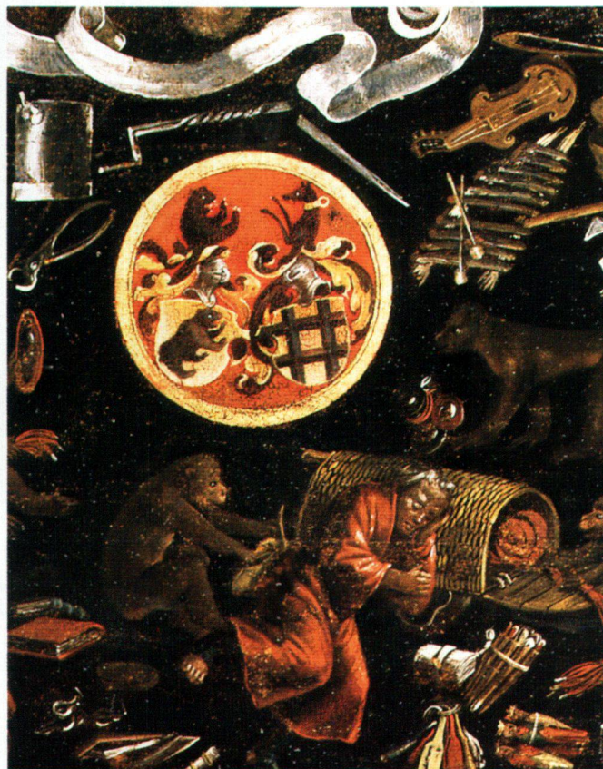
Abb. 1 Sog. Holbeintisch. Zentrum der bemalten Tischplatte mit Allianzwappen Hans Baer-Barbara Brunner und schlafendem Krämer, Basel 1515. Zürich, Schweizerisches Landesmuseum, Inv Nr. Dep. 527.