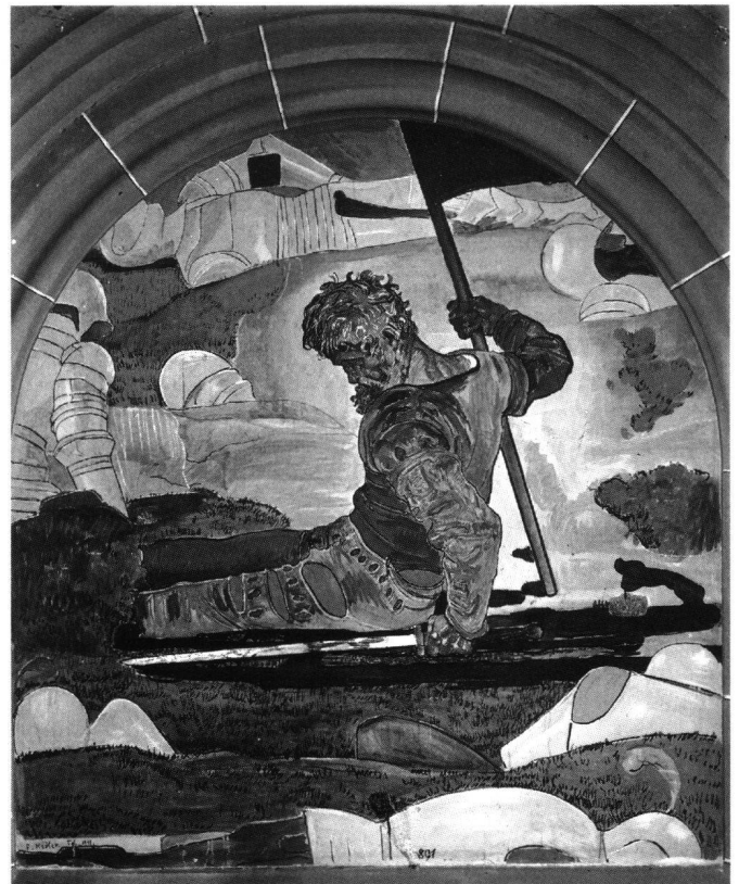
Abb.10 Der sterbende Fähnrich aus dem «Rückzug von Marignano», 1900. Fresko von Ferdinand Hodler. Zürich, Schweizerisches Landesmuseum, Waffenhalle.

Nach der Entdeckung des Namens von Hans Herbst auf Petschaft und Papiersiegel der Trompe-l'œil-Malerei des Tischblatts muss die Tafel in der Werkstatt Herbsts entstanden sein. Haben hier Petschaft und Papiersiegel aber wirklich die Bedeutung einer Autorschaft und Eigenhändigkeit bezeugenden Signatur? Oder sind sie nicht vielmehr im Sinne des Trompe-l'œil ganz als das zu verstehen, als was sie erscheinen und was sie uns sagen: dass nämlich der hier liegende Brief eine Botschaft enthält, die Hans Herbst geschrieben, gesiegelt und gesandt hat? Antwort auf die Frage nach dem Inhalt des Schreibens gibt wohl der Tisch selbst mit seinen das Leben eines Verstorbenen reflektie-