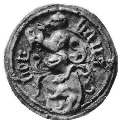
Abb. 5 Siegel des Hans Bär von 1513. Abguss nach einem Originalsiegel im Staatsarchiv Basel-Stadt. Siegelsammlung des Schweizerischen Landesmuseums, Zürich.

Ein Zeichen dafür, dass Hans Bär nicht mehr unter den Lebenden weilte, als der Tisch gemalt wurde, dürfte die Binde über der Helmdecke seines Wappens sein, die sonst auf dem Wappen seines Siegels fehlt (Abb. 5). 18 Eine entsprechende Binde zeigt hingegen auch das Wappen des Grabsteins seines 1502 verstorbenen Vaters Hans Bär; die einstige Bemalung dieses Grabsteins war von Hans Herbst besorgt worden. 19