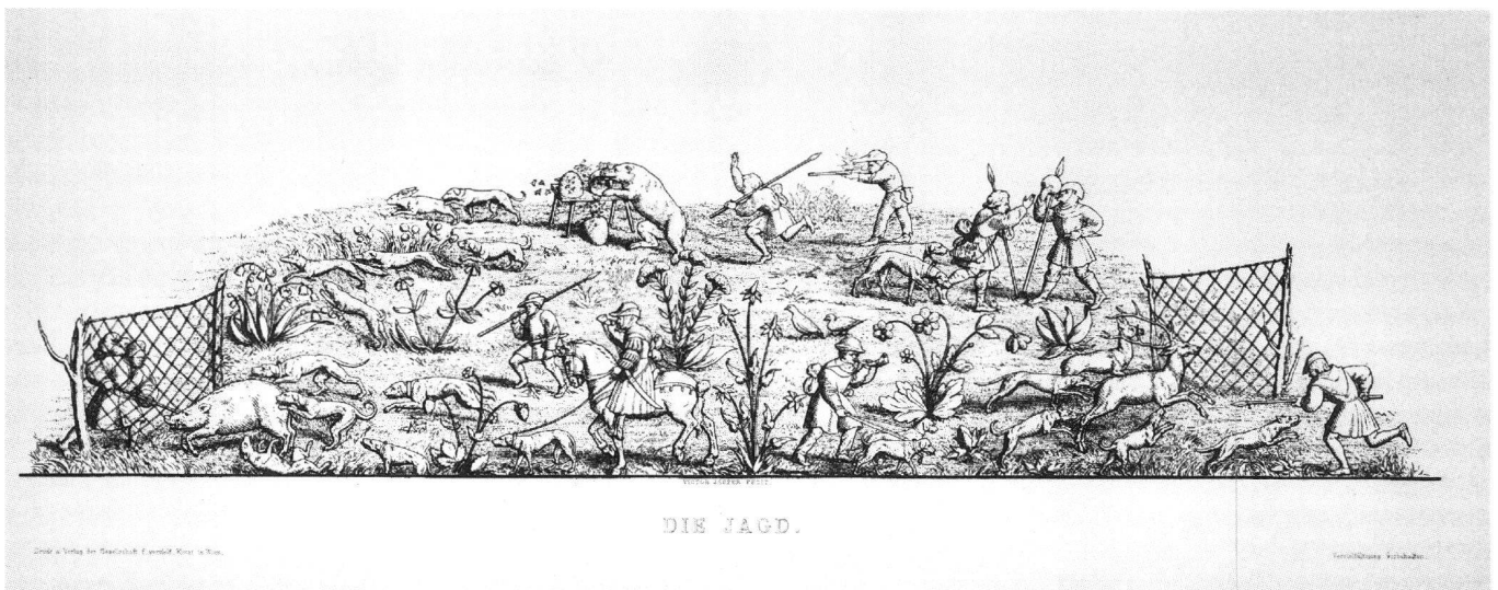
Abb. 7 Sog. Holbeintisch. Radierung der Jagd von Viktor Jasper, Wien 1878.

Der Fischfang (Abb. 9) endlich findet im kalten Element des Wassers statt. Gefischt wird hier in einem Fluss um eine Halbinsel, auf die ein merkwürdiger Zug von Frauen sich