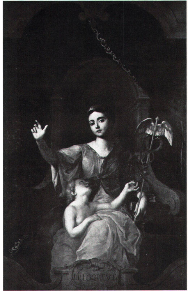
Abb. 6 «L'ELOQUENCE». Allegorie der Beredsamkeit. Ölgemälde von Sébastien II Le Clerc oder Atelier, 1734. Feldbrunnen-St. Niklaus, Schloss Waldegg.

Die genaueren Umstände und der ursprüngliche Aufstellungsort im Schloss erhellen sich durch den Briefwechsel zwischen Johann Viktor II. von Besenval als Auftraggeber in Paris und dessen in Solothurn lebendem Bruder Peter Joseph (1675–1736), der die Erneuerungsarbeiten auf Waldegg leitete. Aus diesen brieflichen Anweisungen an den jüngeren Bruder geht hervor, dass Johann Viktor in Paris neun Gemälde in Auftrag gegeben hatte, die auf Schloss Waldegg innerhalb eines noch bestimmbareren Raumes auf der Südseite der Bel-etage ausgestellt werden sollten, der zur Bibliothek umgestaltet werden sollte (Abb. 3, 4). Besenval hatte sich darüber genaue Vorstellungen gemacht: Die drei fensterlosen Wände des Zimmers hatten je drei Bücherschränke in der Höhe von 6 pieds de roi aufzunehmen. Oberhalb dieser neun Nussbaumschränke mit Messinggittern in den Türen sollten neun Bilder