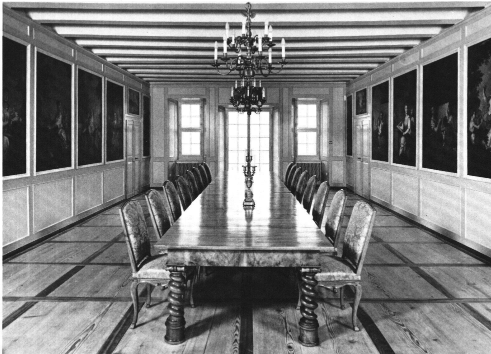
Abb. 2 Gartensaal im Schloss Waldegg mit dem Bilderzyklus in der heutigen Aufstellung.

von Frankreich aus dirigierte: Im Schloss liess er um 1725/30 einen Theatersaal einrichten und auf dem Schlossareal 1727–1734 nach Plänen eines anonymen französischen Architekten eine Schlosskapelle erbauen. Aus Frankreich wurden zahlreiche Gemälde und weitere Ausstattungsstücke nach Solothurn spedit, und in diesem Zusammenhang gelangte 1734 auch der Zyklus der Allegorien der Künste und Wissenschaften auf Schloss Waldegg. 3 Johann Viktor II. von Besenval konnte ihn leider nie mehr an seinem Bestimmungsort besichtigen, da er bereits am 11. März 1736 im Schloss Mesnil in Frankreich verstarb.