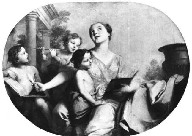
Abb. 10b «La Musique». Ölgemälde von Sébastien II Le Clerc, 1724/25. Paris, Rue d'Antin 3.

Als ob es noch eines zusätzlichen Hinweises auf die weite Verbreitung der Le-Clercschen Bildmotive gebraucht hätte, konnte in Solothurner Privatbesitz noch eine weitere Gruppe dieser vier eben genannten Allegorien gefunden werden. Der Schweizer Maler Johann Melchior Wyrsh (1732–1798) hatte die vier Ölbilder 1766 detailgetreu nach Jeurats Ovalstichen von 1724 kopiert. Es handelt sich um die Themen «La Peinture» (Abb. 12b), «La Poésie» (Abb. 13b), «L'Histoire» (Abb. 14b) und «Les Mathématiques» (Abb. 15, 15a). 20