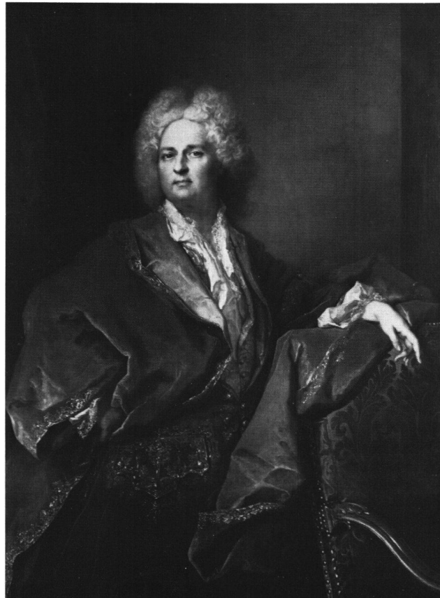
Abb. 1 Porträt von Johann Viktor II. von Besenval, dem Auftraggeber des Bilderzyklus auf Schloss Waldegg. Ölgemälde von Nicolas de Largillière, um 1716. New York, Privatsammlung.

Den Gegenstand unserer Publikation bildet ein zehnteiliger Ölgemäldezyklus mit allegorischen Darstellungen der Künste und Wissenschaften im Schloss Waldegg in Feldbrunn-St. Niklaus bei Solothurn. 1