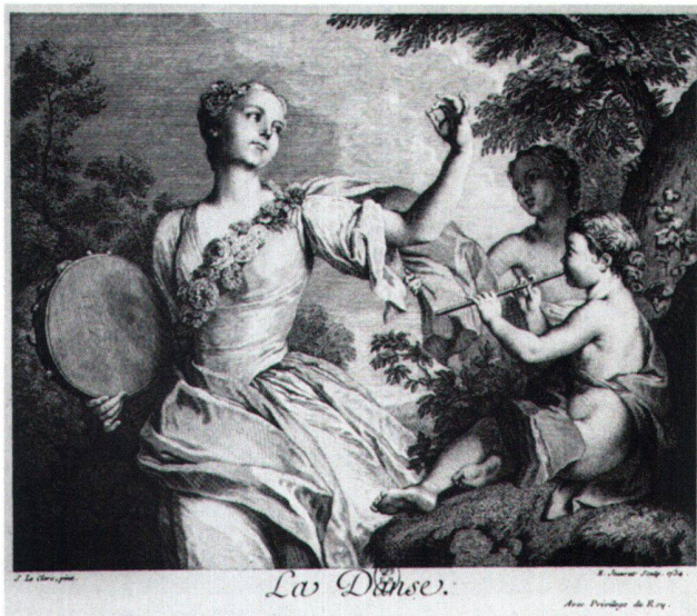
Abb. 8a «La Danse». Radierung von Edme Jeaurat nach Sébastien II Le Clerc, 1734. Paris, Bibliothèque Nationale.

In Kenntnis des Schicksals eines solch ungewöhnlichen Zyklus war das Interesse natürlich gross, auch den Namen von dessen Schöpfer zu kennen. Das Studium der Literatur zur französischen Barockmalerei der ersten Hälfte des 18. Jahrhunderts ergab keine konkreten Anhaltspunkte für eine Zuschreibung an einen bestimmten Maler. Ein eigenartiger Zufallsfund bestärkte uns hingegen in unserer Suche nach dem unbekanntem Künstler: Bei der Durchsicht alter Glasnegative aus dem Besitz der früheren Schlossbesitzer fiel die Photographie eines Innenraumes im Von-Sury-Haus am Marktplatz 47 in Solothurn auf, der neben Möbelstücken und Gemälden an