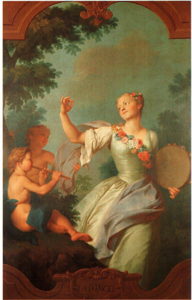
Abb. 8 «LA DANCE». Allegorie der Tanzkunst. Ölgemälde von Sébastien II Le Clerc oder Atelier, 1734. Feldbrunnen-St. Niklaus, Schloss Waldegg.

jedoch nicht ganz von der Hand zu weisen: denn auch «L'HISTOIRE» von Gaudenz Taverna geht auf eine Vorlage von Sébastien Le Clerc zurück und ist möglicherweise bloss ein Ersatz des 19. Jahrhunderts für ein zugrunde gegangenes Originalgemälde von 1734 (Abb. 14, 14a).