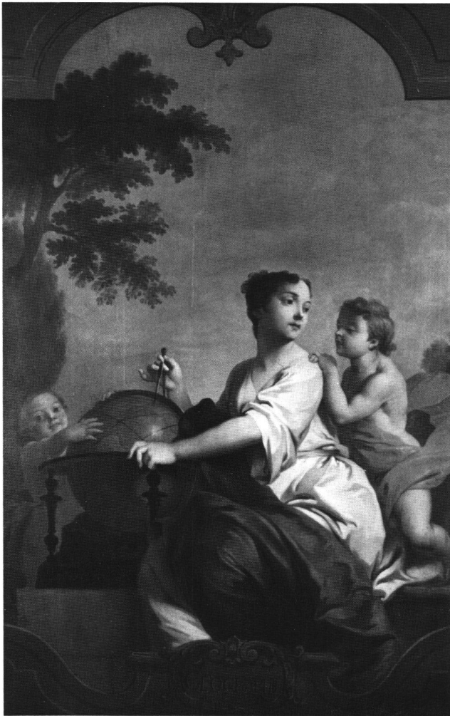
Abb. 11 «GEOGRAPHIE». Allegorie der Geographie. Ölgemälde von Sébastien II Le Clerc oder Atelier, 1734. Feldbrunnen-St. Nikolaus, Schloss Waldegg.

illusionistische Schnitzkartusche im Régence-Stil mit der französischen Bezeichnung der jeweiligen Allegorie in Antiquaschrift. Die heutige strenge Einpassung in ein grau gestrichenes Wandtäfer widerspricht der spielerischen Grundauffassung des Ensembles.