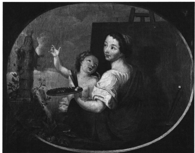
Abb. 12b «La Peinture». Ölgemälde von Johann Melchior Wyrsh, 1766. Solothurn, Privatbesitz.

die Gemälde kaum auf Virtuosität angelegt. Der Vorstellung höfischen Charmes der Epoche von Louis XV entspricht noch am ehesten «LA DANSE» in ihrem bunten Blumenschmuck. Sicherlich hatte die Werkstatt wesentlichen Anteil an diesen unsignierten Bildern.