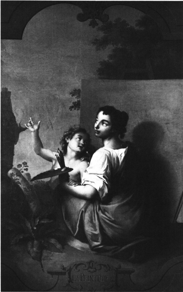
Abb. 12 «LA PEINTURE». Allegorie der Malkunst. Ölgemälde von Sébastien II Le Clerc oder Atelier, 1734. Feldbrunnen-St. Nikolaus, Schloss Waldegg.