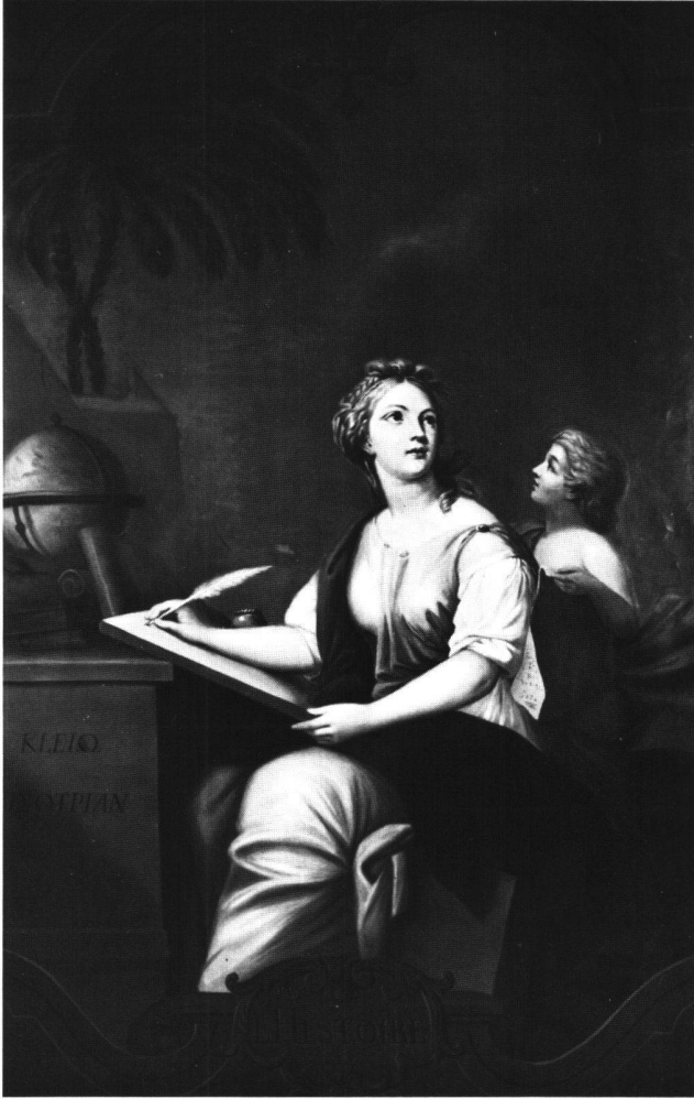
Abb. 14 «L'HISTOIRE». Allegorie der Geschichte. Ölgemälde von Gaudenz Taverna, um 1865/1878. Feldbrunnen-St. Niklaus, Schloss Waldegg.