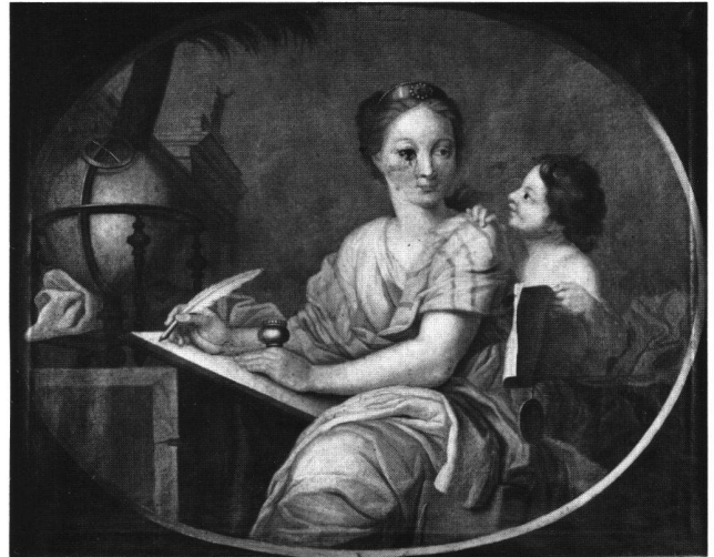
Abb. 14b «L'Histoire». Ölgemälde von Johann Melchior Wyrsch, 1766. Solothurn, Privatbesitz.

mutig gestaltet. Die Allegorie der Musik singt – Blick himmelwärts – nach dem Notenbuch in ihrer rechten Hand. Drei Kinder begleiten sie singend oder Querflöte spielend. Sitzbank, Terracotta-Vase und Säulenarchitektur als Elemente einer Parklandschaft bewirken höfisches Gepräge.