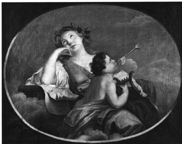
Abb. 13b «La Poésie». Ölgemälde von Johann Melchior Wyrsch, 1766. Solothurn, Privatbesitz.

Gott der Rhetorik gegolten hatte. Weitere Symbole der Redekunst sind die auf dem Thron und darunter liegenden Bücher sowie der Lorbeerkranz, den der vor dem Mädchen kniende Knabe hält (ein entsprechender Stich ist nicht bekannt).