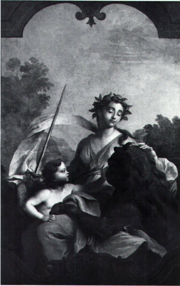
Abb. 7 «LA VALEUR». Allegorie der Stärke. Ölgemälde von Sébastien II Le Clerc oder Atelier, 1734. Feldbrunnen-St. Niklaus, Schloss Waldegg.