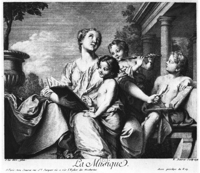
Abb. 10a «La Musique». Radierung von Edme Jeurat nach Sébastien II Le Clerc, 1734. Paris, Bibliothèque Nationale.