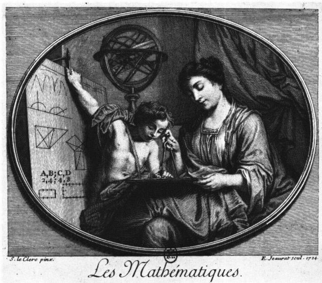
Abb. 15 «Les Mathématiques». Allegorie der Rechenkünste. Radierung von Edme Jeurat nach Sébastien II Le Clerc, 1724. Paris, Bibliothèque Nationale.

Le Clercs Werkgruppe lässt sich ansatzweise aber auch mit den Sieben Freien Künsten (Septem Artes Liberales) verknüpfen; und diese Verbindung der Musen und der Freien Künste kann in der Kunstgeschichte wiederholt beobachtet werden. 24 Im Zyklus der Waldegg hätten die Disziplinen der Rhetorik, Musik, Astronomie und Arithmetik ihre Entsprechung in den Bildern «L'ELOQUENCE», «LA MUSIQUE», «LA GEOGRAPHIE». Edme Jeurats Radierung «Les Mathématiques» (Abb. 15) hat im Waldegg-Zyklus keine Nachfolge gefunden.