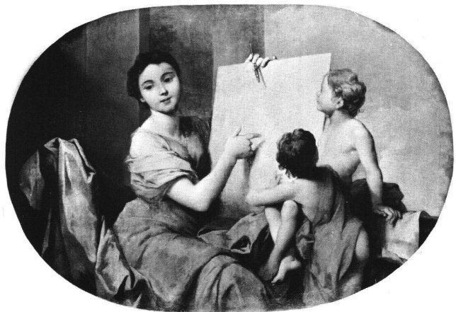
Abb. 9b «Le Dessin». Ölgemälde von Sébastien II Le Clerc, um 1724/25. Paris, Rue d'Antin 3.

Ebenfalls aus den mittleren 1720er Jahren stammt eine weitere vierteilige Gemäldegruppe mit Motiven von Le Clercs Allegorien. Die hochovalen Supraporten von «La Géographie», «La Poésie», «La Peinture» und «Les Mathématiques» befanden sich im Régence-Getäfer des Petit-cabinet im Hôtel Cressart an der Place Vendôme 18 in Paris. In den 1930er Jahren gelangten die Bilder zusammen mit weiteren Ausstattungsstücken dieses Hôtels in den Kunsthandel. Der heutige Standort der vier Allegorienbilder ist nicht bekannt. Aufgrund des zur Verfügung stehenden Bildmaterials kann nicht gesagt werden, ob es sich dabei um eigenhändige Werke von Le Clerc handelt. Jedenfalls zeugt diese Bildergruppe für die Verbreitung von Le Clercs Allegorien der Künste und Wissenschaften. 19