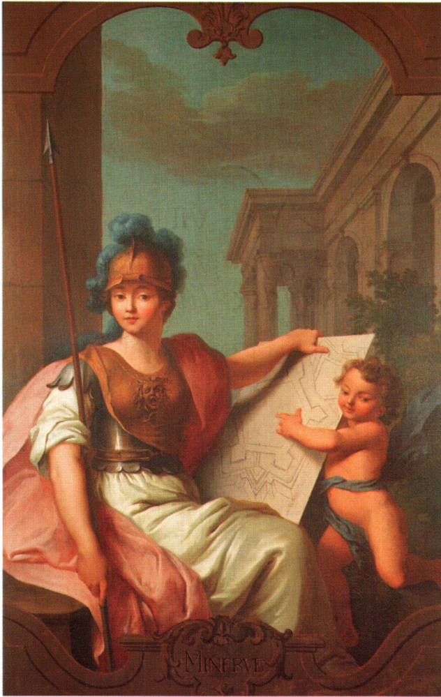
Abb. 5 «MINERVE», die Göttin Minerva, Patronin der Künste und Wissenschaften. Ölgemälde von Sébastien II Le Clerc oder Atelier, 1734 (Zuschreibung). Feldbrunnen-St. Niklaus, Schloss Waldegg.