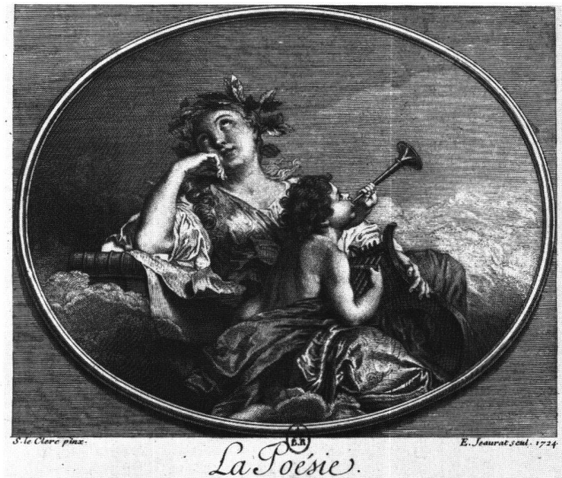
Abb. 13a «La Poésie». Radierung von Edme Jeaurat nach Sébastien II Le Clerc, 1724. Paris, Bibliothèque Nationale.