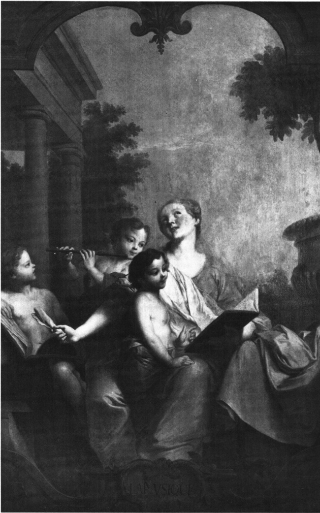
Abb. 10 «LA MUSIQUE». Allegorie der Musik. Ölgemälde von Sébastien II Le Clerc oder Atelier, 1734. Feldbrunnen-St. Niklaus, Schloss Waldegg.