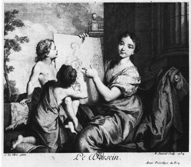
Abb. 9a «Le Dessin». Radierung von Edme Jeaurat nach Sébastien II Le Clerc, 1734. Paris, Bibliothèque Nationale.

Seine erste Fassung eines Allegorienzyklus dürfte Le Clerc schon um 1724/25 für Etienne Bourgeois de Boynes geschaffen haben. Dieser war der Bauherr eines eleganten Stadthauses an der Rue d'Antin 3 in Paris, dem heutigen Sitz der Banque Paribas. In einem ehemaligen Salon mit Régence-Getäfer von Nicolas Pineau befinden sich vier querovale Supraporten mit Darstellungen von «La Danse» (Abb. 8b), «Le Dessin» (Abb. 9b), «La Musique» (Abb. 10b) und «La Géographie» (Abb. 11b) ganz analog zu den entsprechenden Gemälden auf der Waldegg. Neben dem Format (85 × 120 cm) unterscheidet sich auch das Kolorit der beiden Gruppen. Die etwa zehn Jahre älteren Pariser Bilder sind in viel leuchtenderen Pastellfarben gehalten und präsentieren sich in duftiger Malweise. 17 Die hohe künstlerische Qualität dieser Gruppe lässt an eine eigenhändige Arbeit von Le Clerc denken. 18