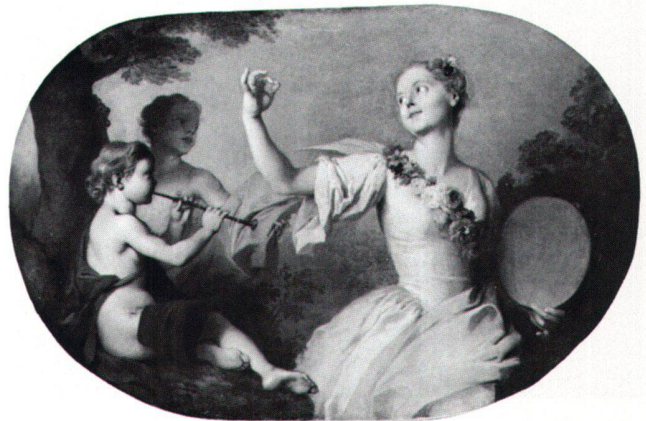
Abb. 8b «La Danse». Ölgemälde von Sébastien II Le Clerc (Zuschreibung), um 1724/25. Paris, Rue d'Antin 3.

Sieben dieser Stiche stimmen inhaltlich und weitgehend auch formal mit den Gemälden auf Schloss Waldegg überein. Aus dieser Ähnlichkeit und aus der Datierung 1734 auf unseren Ölgemälden und den Stichen schlossen wir auf einen unmittelbaren Zusammenhang mit Sébastien Le Clerc. Gegen die Vermutung, dass die Waldegg-Bilder unmittelbare Vorbilder für die vier Stiche von 1734 gewesen wären, spricht die Unterschiedlichkeit der Formate: Die Stiche sind querrrechteckig, die Ölgemälde sind dagegen dank grosszügiger Hinter-