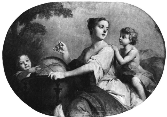
Abb. 11b «La Géographie». Ölgemälde von Sébastien II Le Clerc, 1724/25. Paris, Rue d'Antin 3.

(«MINERVE», «LE DESSIN», «L'ELOQUENCE»). Eichenbaumlandschaften, teilweise angereichert mit in die Tiefe führenden klassizistischen Architektur-Versatzstücken, bilden den Hintergrund – einen Musenhain? Eine Ausnahme bildet der Innenraum der Thronszenerie von «L'ELOQUENCE».