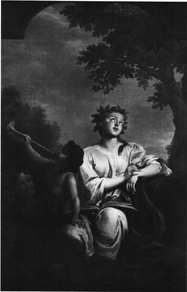
Abb. 13 «LA POESIE». Allegorie der Dichtkunst. Ölgemälde von Sébastien II Le Clerc oder Atelier, 1734. Feldbrunnen-St. Niklaus, Schloss Waldegg.