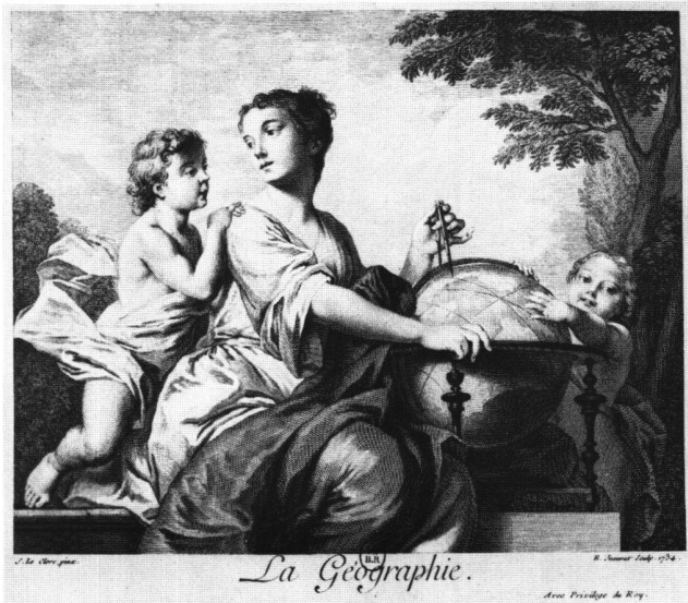
Abb. 11a «La Géographie». Radierung von Edme Jeaurat nach Sébastien II Le Clerc, 1734. Paris, Bibliothèque Nationale.

Die Einzelgemälde sind als zwei- bis vierköpfige Gruppen konzipiert, mit einer jungen Frau als Verkörperung der jeweiligen Allegorie und mit begleitenden leicht geschürzten Kindern in der Ausstrahlung von Putten, Amoretten oder Genien. Ihr Arrangement ist recht variiert und keinesfalls stereotyp. Die auf Symmetrie bedachte Lichtregie unterstreicht die Präsenz der Hauptfiguren, die in ihrem Pathos teilweise auch etwas plakativ geraten sind (z.B. «LA POESIE» oder «LA MUSIQUE»). Einige der Protagonistinnen schauen aus dem Bild heraus und suchen Blickkontakt mit dem Betrachter