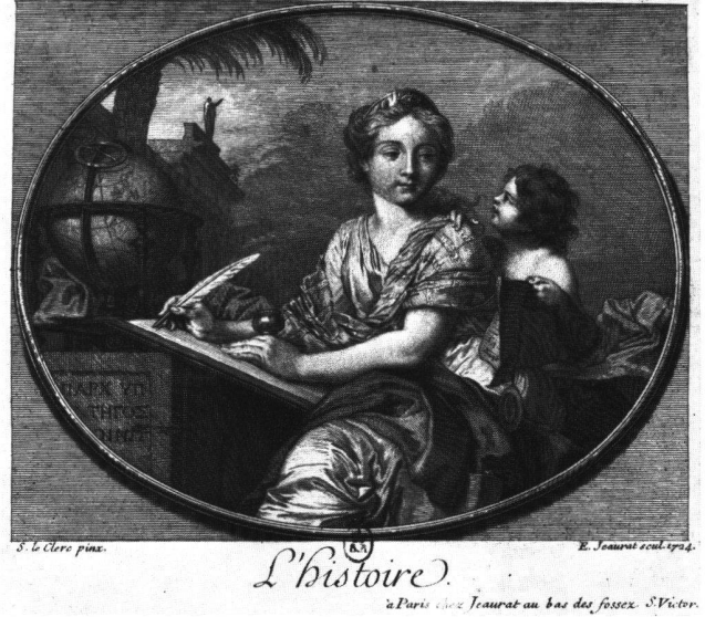
Abb. 14a «L'Histoire». Radierung von Edme Jeaurat nach Sébastien II Le Clerc, 1724. Paris, Bibliothèque Nationale.