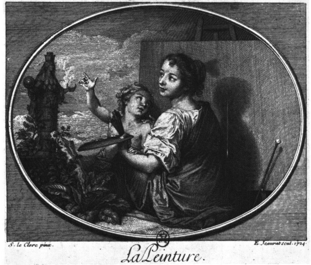
Abb. 12a «La Peinture». Radierung von Edme Jeaurat nach Sébastien II Le Clerc, 1724. Paris, Bibliothèque Nationale.