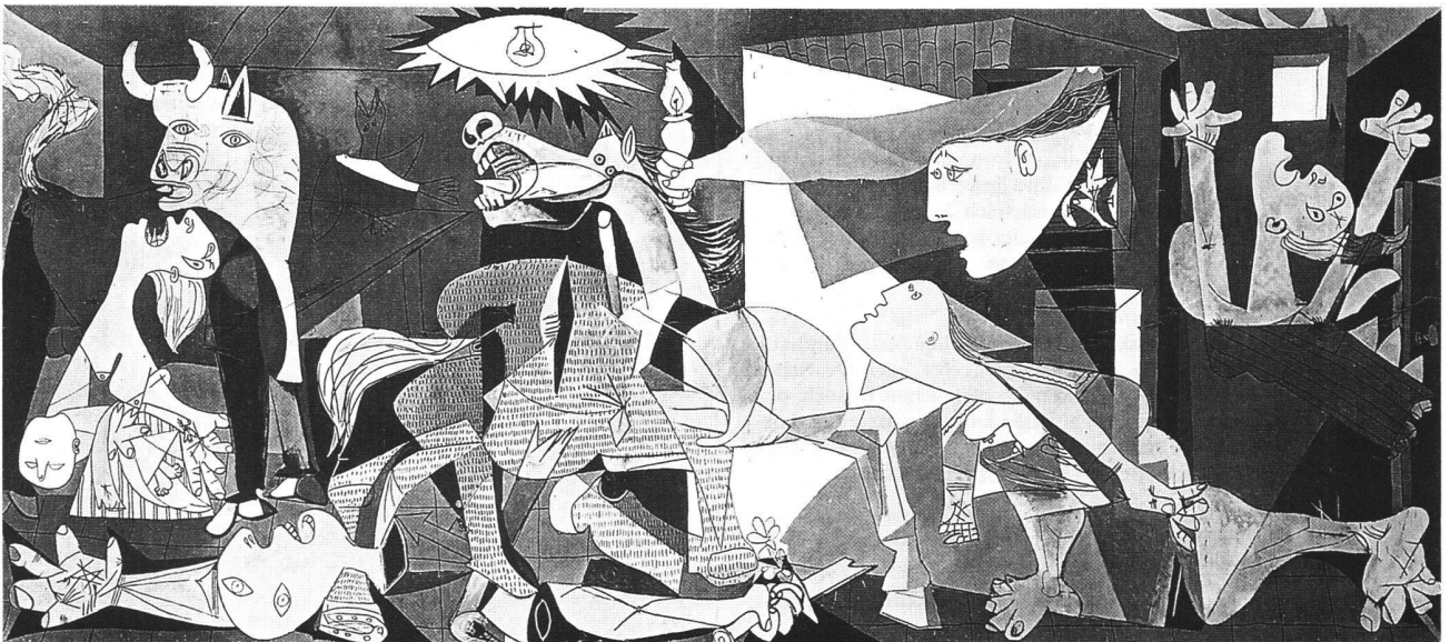
Abb. 1 Guernica, von Pablo Picasso, 1937. Öl auf Leinwand, 350 × 777 cm. Madrid, Museo del Prado.