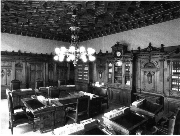
Abb. 2 Sitzungszimmer des Bundesrates im Bundeshaus West, Bern. Aufnahme 1995.