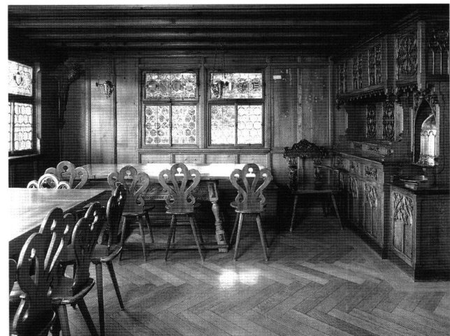
Abb. 7 Rütlistube nach der Rückführung des neugotischen Buffets. Aufnahme nach 1989.