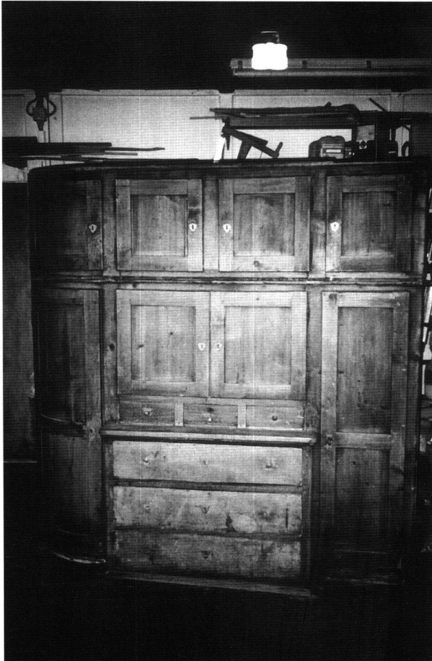
Abb. 8 Das Spätbiedermeier-Bufferet aus der Schifferleutenstube im Haus auf dem Rütli. Aufnahme während der Restaurierung.

Stelle des alten Rütlihauses ein neues Pächterhaus zu erstellen. Der Architekt Johann Meyer (1820–1902) in Schwyz wurde mit dem Bau beauftragt, und dieser war 1869 vollendet. Das neue Haus entsprach dem Schema eines klassischen Chalets und wurde in der Folge zum Paradebeispiel eines Schweizer Hauses, wie sie von Chaletfabriken später serienweise hergestellt wurden.