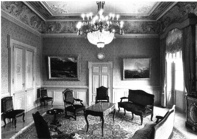
Abb. 3 Salon des Bundesrates im Bundeshaus West, Bern. Aufnahme 1995.