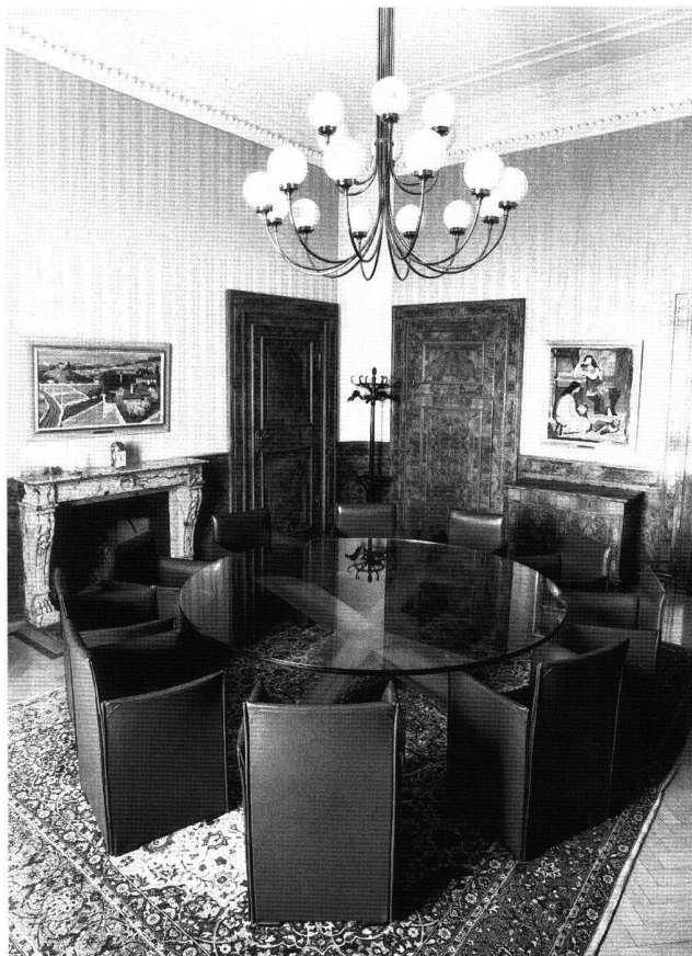
Abb. 1 Vorzimmer im Bundeshaus West, Bern. Aufnahme 1995.

In der Literatur werden diese Räume kaum je erwähnt, und es ist aus den wenigen erhaltenen Fragmenten schwierig zu sagen, wo und wie sich diese Räume in das Gesamtkonzept des Bundesrathauses einfügen. Denn, um die ständerätliche Kommission zu zitieren, es war sehr wohl ein Programm für das Bundesrathaus vorhanden: »Wenn wir durch dasselbe [Programm] der Kunst die Gelegenheit eröffnen, die nationalen Vorzüge unseres Vaterlandes in