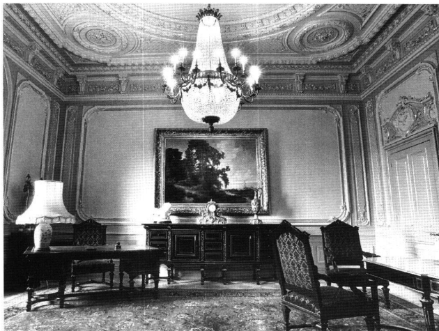
Abb. 4 Präsidentenzimmer im Bundeshaus West, Bern. Aufnahme 1995.

Um 1889 wurden diese vier Räume verändert. Das Sitzungszimmer (Abb. 2) wurde mit seiner noch heute vollständig erhaltenen Renaissance-Ausstattung versehen. Zur alten, bereits oben erwähnten Holz-Stuckdecke kamen das Wandtäfer sowie das Sitzungsmobiliar hinzu. Der Leuchter stammt ebenfalls aus dieser Zeit; er ist sowohl für elektrische wie auch für Gasbeleuchtung geschaffen und als eines der letzten erhaltenen Beispiele für diesen Doppelgebrauch von Bedeutung. Das Audienzzimmer (Abb. 3) wurde mit einer Barockstuckdecke und das sogenannte Präsidentenzimmer (Abb. 4) mit einer Louis XVI-Stuckdecke versehen. Von der übrigen Ausstattung dieser beiden Zimmer ist kaum mehr etwas vorhanden. Die originalen, zum Hause gehörenden Fauteuils und Sofas kamen mit der Ausstattung des Neubaus 1902 hinzu. Die heutige schwarze Fassung dieser Möbelstücke ist allerdings eine Rückführung und nicht mehr original. Beide Zimmer wurden 1989 renoviert und mit qualitativ sehr schönen Napoleon III-Möbeln ergänzt.