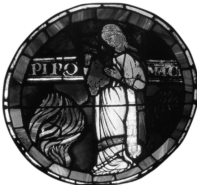
Fig. 2 La Pyromancie, rose de la façade méridionale, 1230. Lausanne, cathédrale.