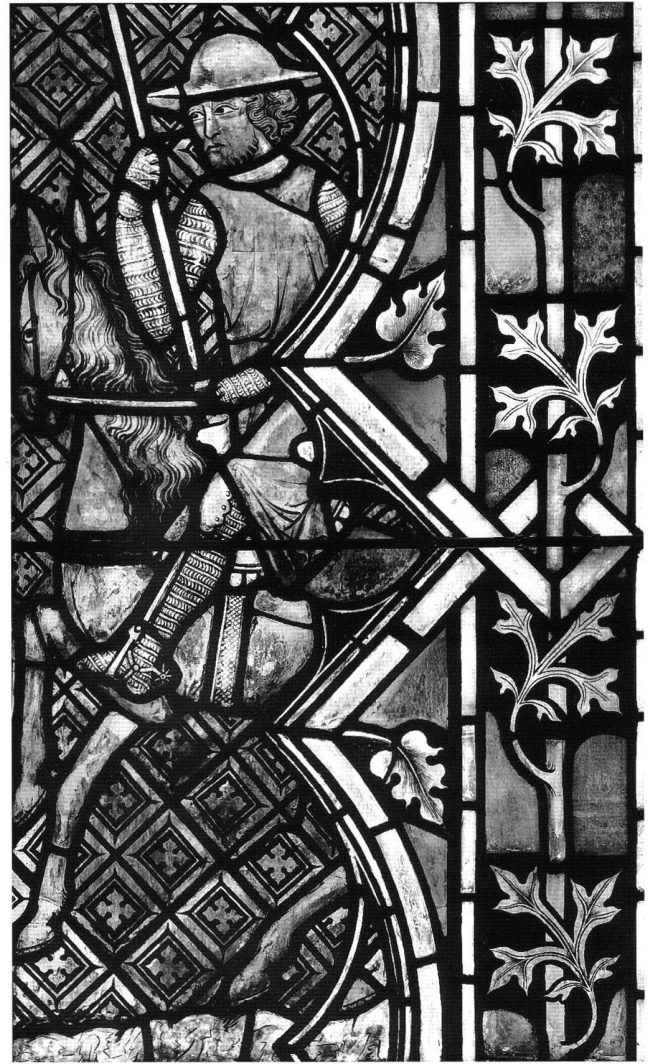
Fig. 1 Conversion de saint Paul, vitrail de saint Paul et de la Mort de la Vierge (S III), 1330/40. Königsfelden, ancienne abbatale.

pays, nous disposons aujourd'hui d'un nombre croissant de volumes appartenant à cette série (38 volumes de la série principale). Le Corpus des vitraux est l'une des seules entreprises de recherche en histoire de l'art qui, depuis presque un demi-siècle, ne se soit jamais arrêtée, mais continue au contraire à évoluer et à augmenter 13 . Les causes du ralentissement de la publication des derniers volumes sont multiples. Mentionnons-en seulement une qui, à côté des problèmes financiers, me semble la plus importante: au début, l'entreprise s'orientait vers des initiatives semblables à celles du Corpus Vasorum , fondé au 19 e siècle 14 . C'est pourquoi l'inventorisation, la documentation et le catalogue des vitraux étaient, et sont toujours, le but le plus important de la rédaction des volumes. Mais les différents auteurs se sont rendu compte qu'une simple inventorisation ne suffisait pas pour assurer la sauvegarde du vitrail. Il fallait aussi lui rendre son importance histo-