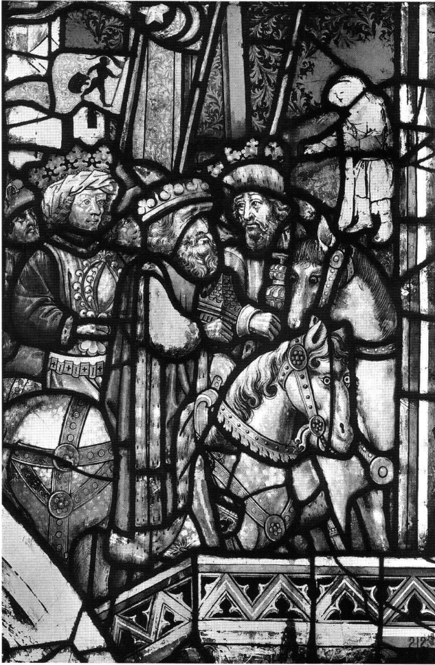
Fig. 3 Le voyage à Bethléhem, vitrail des Rois Mages (n III), 1450/55. Berne, ancienne collégiale.

Nous rangeons également au nombre des avantages les colloques du Corpus international organisés tous les deux ans par l'un des comités nationaux 29 . A cette occasion, les chercheurs, qui dans de petits pays comme la Suisse travaillent souvent isolément, peuvent échanger, dialoguer avec leurs collègues et présenter leurs travaux en tenant des conférences. Une bibliographie de tous les membres du Corpus Vitrearum est alors mise à la disposition des chercheurs. Et pour terminer ces réflexions consacrées aux avantages dont bénéficie la recherche portant sur le vitrail, je voudrais faire une allusion à un aspect purement matérialiste, mais qui est important pour le progrès du travail. Etre membre d'une organisation internationale peut augmenter le poids d'un projet auprès des autorités assurant le financement des recherches. Le Fonds national a jusqu'à présent pris en charge toutes les recherches qui ont été faites dans le cadre du Corpus Vitrearum , bien que le dernier projet ait été si considérablement réduit qu'il fallut recourir à d'autres sources financières.