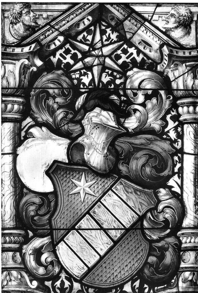
Fig. 5 Vitrail héraldique de la famille Brüggler (S VII), 1559/60. Berne, ancienne collégiale.

seur d'histoire de l'art à l'École polytechnique fédérale à Zurich, a ouvert la voie aux études modernes en 1866 41 . Prudemment, il a appelé son étude «un essai». Une de ses observations a par la suite marqué profondément la vision de l'histoire du vitrail en Suisse. Selon l'auteur, l'adoption de la Réforme par certains cantons a entraîné un changement fonctionnel du vitrail: il a passé d'un art ecclésiastique à un art civil qui a fait par la suite quelques intrusions dans les églises (il se réfère notamment à l'ancienne collégiale de Berne), une observation d'ailleurs qui ne peut pas être retenue avec autant de rigueur que l'ont fait tous les auteurs à partir de l'étude de Wilhelm Lübke 42 . Même après l'introduction de la Réforme, les fidèles ont continué à faire des donations de vitraux dans les églises, et leurs motivations sont restées au moins partiellement les mêmes: le vitrail était toujours le signe extérieur de la charité du