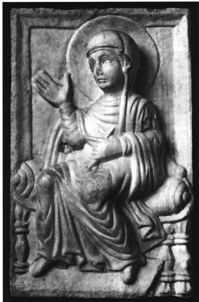
Abb. 1 Verkündigung an Maria, Marmorreliefs, 10. Jahrhundert, Ravenna, S. Apollinare in Classe. Marias linke Hand weist sechs Finger auf.