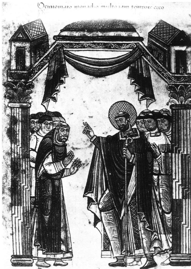
Abb. 4 Der hl. Albinus, Handschrift, 11. Jahrhundert, Angers. Albinus heilt mit seiner sechs-fingrigen Segenshand einen erblindeten Mönch. Paris, Bibliothèque Nationale, Ms. nouv. acq. lat. 1390, fol. 4v.

Er ist in Frankreich sehr verehrt worden, was noch heute der Name St. Aubin mancher Kirchen und Ortschaften bezeugt. Unter den Wundertaten, die ihm zugeschrieben wurden, gehörten auch Blindenheilungen. Eine solche ist dargestellt auf einer in Angers angefertigten Buchmalerei des ausgehenden 11. Jahrhunderts (Abb. 4). 25