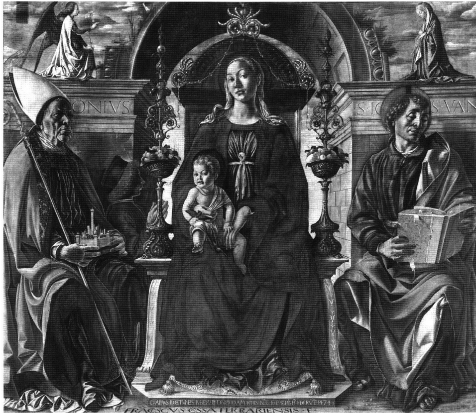
Abb. 1 Thronende Madonna mit Kind und Heiligen, sogenannte «Pala dei Mercanti», von Francesco del Cossa, 1474. Bologna, Pinacoteca Nazionale.