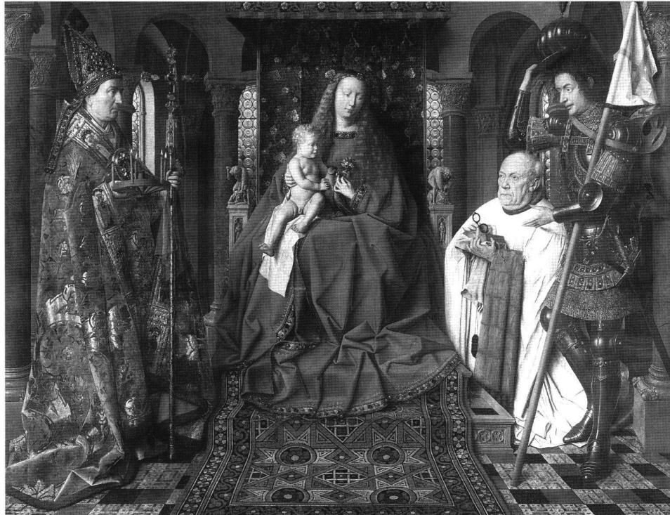
Abb. 2 Madonna des Kanonikers Georg van der Paele, von Jan van Eyck, 1434–1436. Brügge, Groeningemuseum.