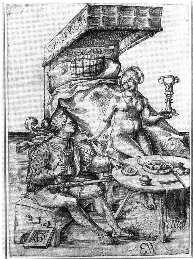
Abb. 3 Reisläufer mit Dirne, von Urs Graf. Feder in Schwarz, 31,1 × 21,6 cm. Frankfurt, Städelsches Kunstinstitut, Inv.-Nr. 15673.

Ein vergleichbarer Unterschied bestimmt auch die Gestaltung der Physiognomien beider Frauen. Im Gegensatz zum freundlichen Gesichtsausdruck und der einladend offenen Gestik der Venus wird die Darstellung der Lais