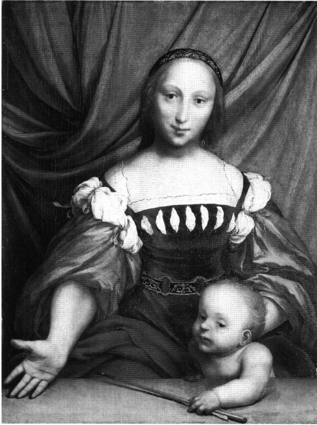
Abb. 2 Venus und Amor, von Hans Holbein d. J., um 1525 (?). Holz, 34,5×26 cm. Basel, Öffentliche Kunstsammlung, Inv.-Nr. 323.

Leuchtkraft des Bildes bewundern zu können. Also noch vor der Erkenntnis des ikonographischen Sachverhalts stellt sich dem Betrachter die Frage, ob es sich bei Holbeins