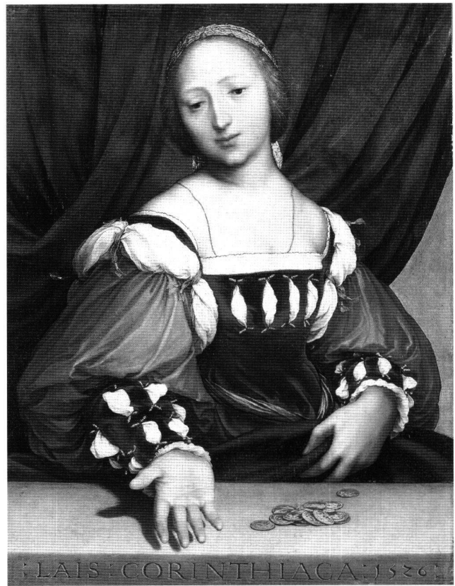
Abb. 1 Laïs Corinthiaca, von Hans Holbein d.J., 1526, Holz, 35,6×26,7 cm. Basel, Öffentliche Kunstsammlung, Inv.-Nr. 322.

Holbeins Tafel misst Höhe vor Breite gerade einmal 35,6×26,7 cm. Der pyramidale Aufbau der Komposition und der starke Illusionismus der Darstellung bewirken einen Grad von Monumentalität, der mit der tatsächlichen