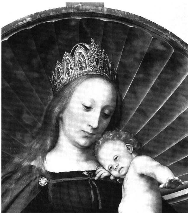
Abb. 4 Madonna des Bürgermeisters Jakob Meyer zum Hasen, sogenannte «Darmstädter Madonna», von Hans Holbein d. J., wohl nach 1526, Ausschnitt. Darmstadt, Schlossmuseum.

In der Sekundärliteratur ist darauf hingewiesen worden, dass Holbein den Gesichtstypus der Lais ebenfalls für seine Darstellung der sogenannten Darmstädter Madonna (Tafel 13 und Abb. 4) genutzt hat, die wohl nach 1526 entstanden ist. Jedenfalls scheint es unter Malern nichts Aussergewöhnliches gewesen zu sein, ein und denselben Typus für ein profanes und ein christliches Sujet zu verwenden. Dieses Vorgehen allerdings hat heftige Kritik hervorgerufen, denn Erasmus von Rotterdam könnte Holbein vor Augen gehabt haben, als er im «Ciceronianus» aus dem Jahre 1528 schrieb: